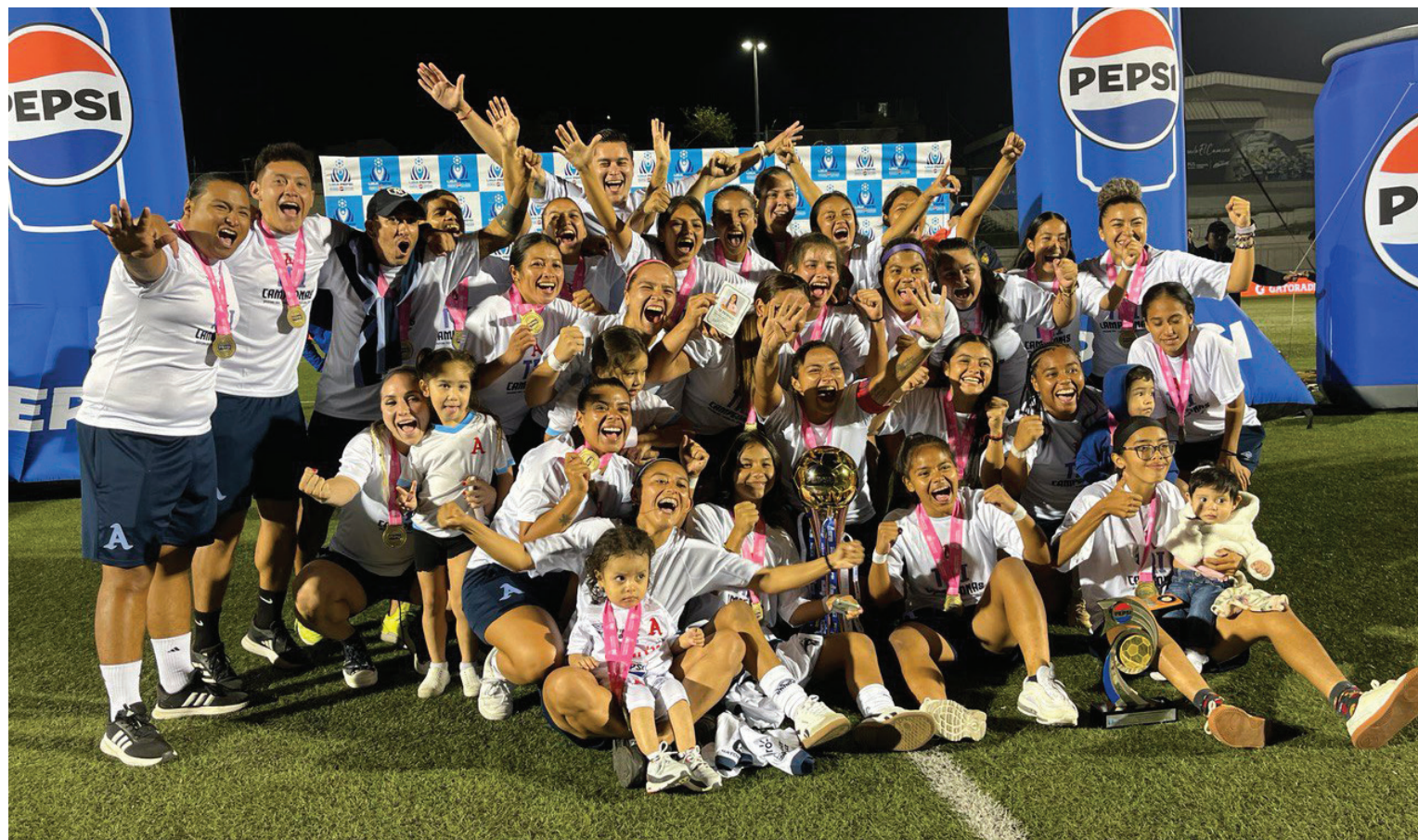
Alianza levanta la copa del Apertura 2024 tras vencer 2-0 a Municipal Limeño en Las Delicias.