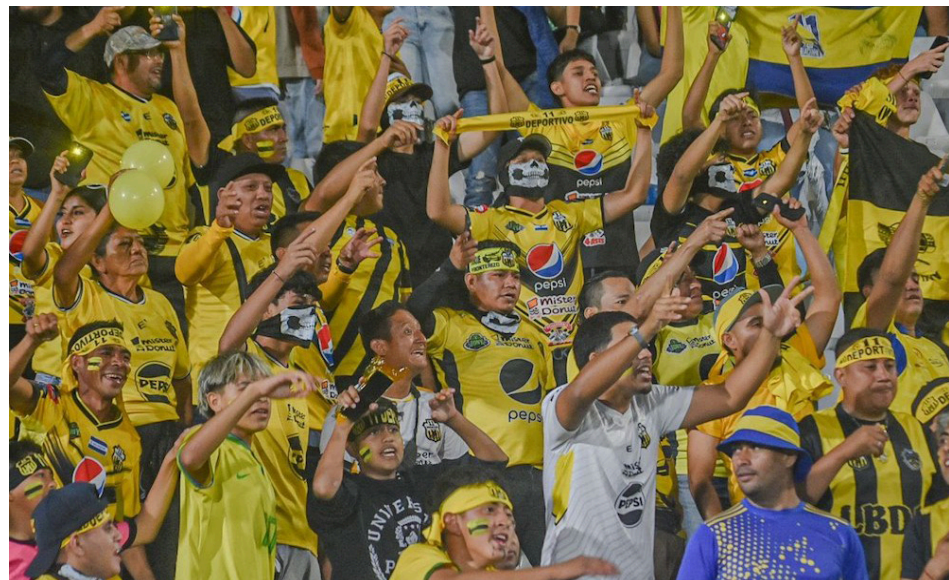
Afición ahuachapteca vistió “El Mágico” de amarillo, a pesar de la masividad de FAS.