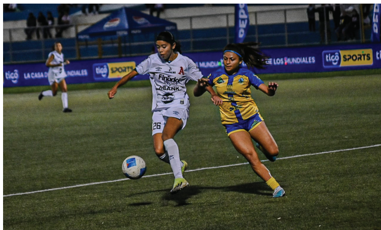
Alianza enfrenta a Municipal Limeño en la Final del Apertura 2024.

El equipo blanco eliminó a Firpo en los cuartos de final y en las semifinales reeditó la semifinal del Apertura 2023 con Águila, para confirmarse en la final del Apertura 2024.