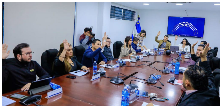
La comisión legislativa de Tecnología, Turismo e Inversión de la Asamblea Legislativa, emitió dictamen favorable a la Ley General de Minería Metálica para el país.

Desde los estudios de reconocimiento superficial y prospección (información de la