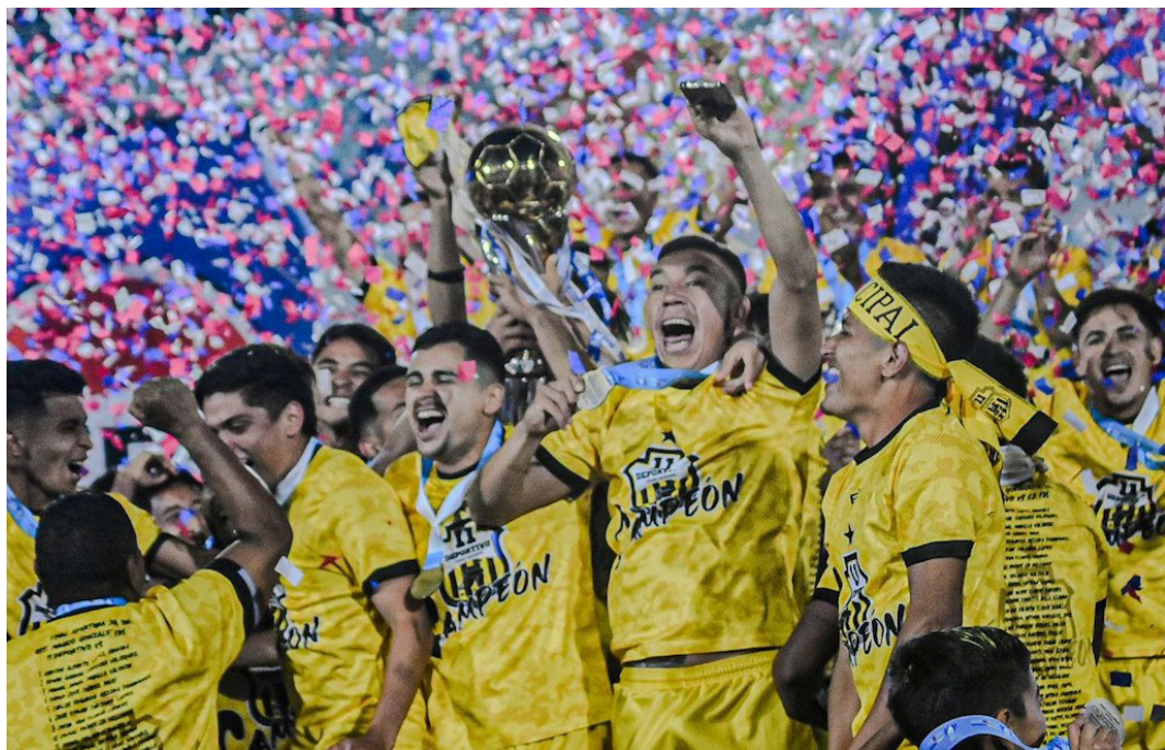
El Once Deportivo levanta la copa del torneo Apertura 2024, tras vencer a FAS en el estadio Jorge “El Mágico” González.

Villar la tuvo. En lo último FAS tuvo la del empate pero Emiliano Villar la dejó escapar, y FAS solamente presenció la celebración del nuevo campeón del redondo nacional.