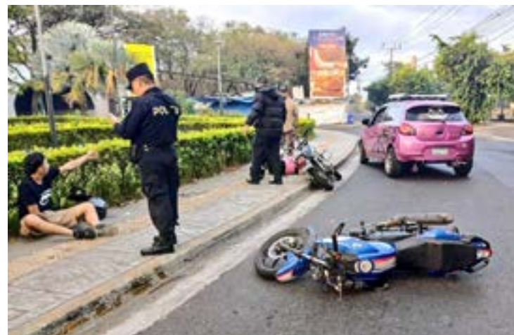
La temporada de Navidad y fin de año dejó un total de 90 fallecidos por accidentes de tránsito, según Protección Civil.

Con respecto a los incendios, el director del Cuerpo de Bomberos, Baltazar Solano, detalló que hubo una reducción de 38% con respecto al año pasado. Del 12 de diciembre 2024 al 01 de enero 2025, se registraron 112 incen-