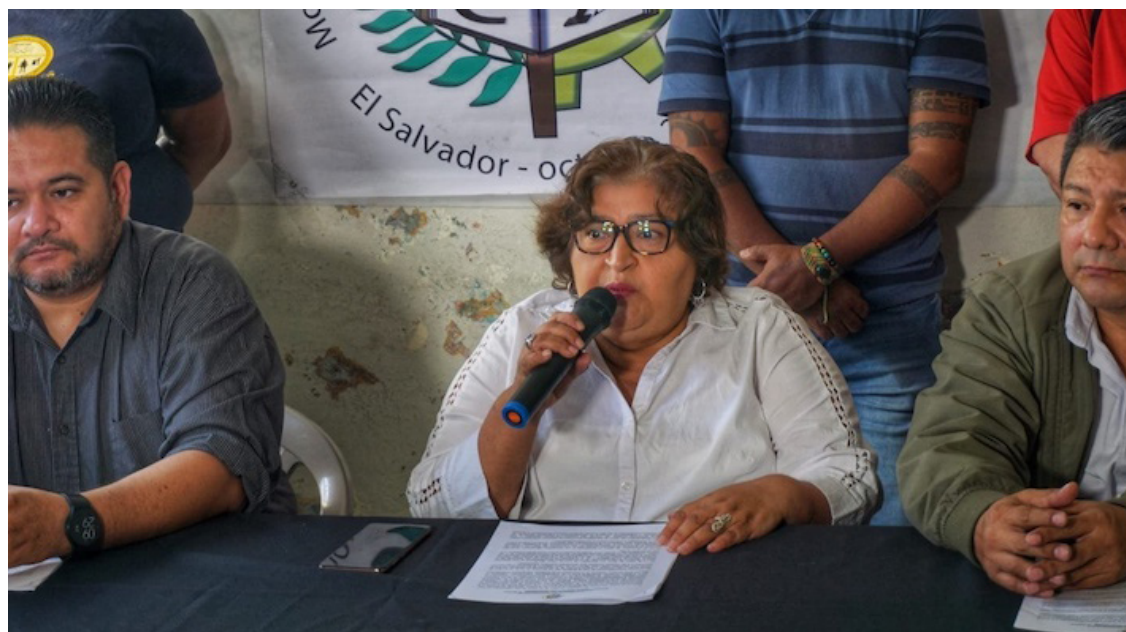
Los despidos en la CSJ, en la PDDH, en la PGR dejan en indefensión a las personas que son víctimas de violaciones a sus derechos humanos alertan organizaciones sociales.

“El régimen de Bukele ha cooptado el sistema de justicia, desde el 1 de mayo de 2021 que inició con la destitución de los magistrados de la CSJ, en esa misma fecha obligó a más de 260 magistrados y jueces al retiro forzoso, este año al menos 1,100 empleadas y empleados de la CSJ