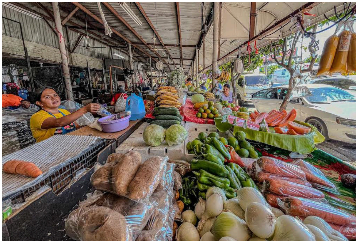
Vendedores de la Placita Zacamil se encuentran en la incertidumbre por un posible desalojo por parte de la comuna sin darle alternativas viables.

El comerciante dijo que se les ha informado que los proyectos que presuntamente llegarían a la zona “es una mentira”. “Lo que quiere la comuna, es la plaza”.