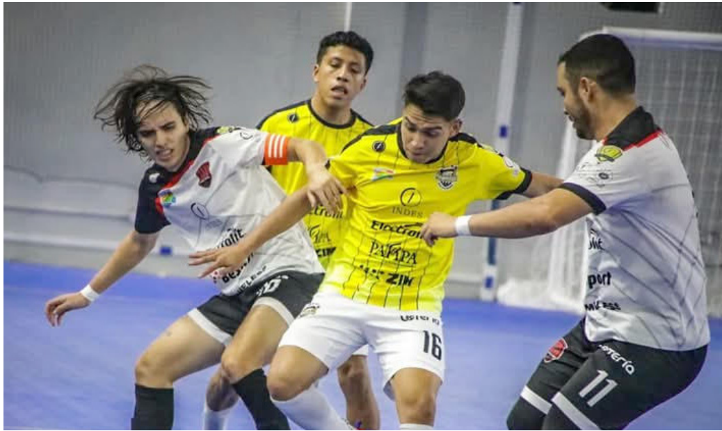
AD San Jacinto Futsal mantiene el liderato de la Liga Mayor de Futsal a pesar de caer contra Be Sports.