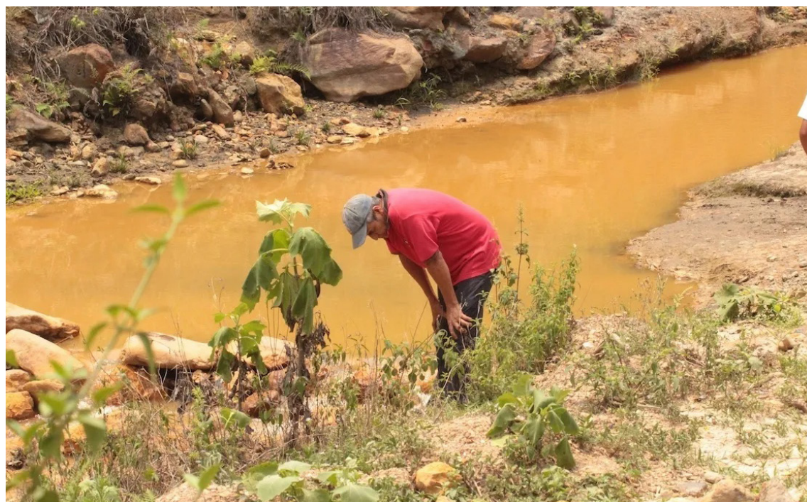
La primera implicación con esta nueva realidad, que enfrentará la población salvadoreña es la de enfrentar a una industria altamente contaminante y extractiva de recursos naturales.

do como la minería genera altos niveles de corrupción para genera represión y generar casos y juicios, como lo que viven