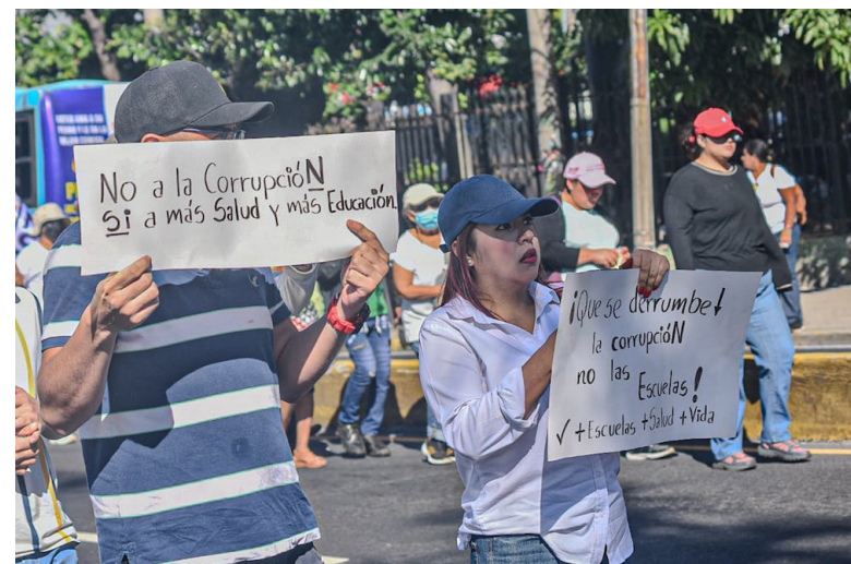
El Frente Magisterial Salvadoreño (FMS) señala que el 3 de enero de 2025, empleados administrativos, departamentales y nivel central del Ministerio de Educación, fueron recibidos con cartas de supresión de plazas.

“El gobierno de Bukele está quitando al personal capacitado, con experiencia de años, para implantar a su clientelismo político partidario”