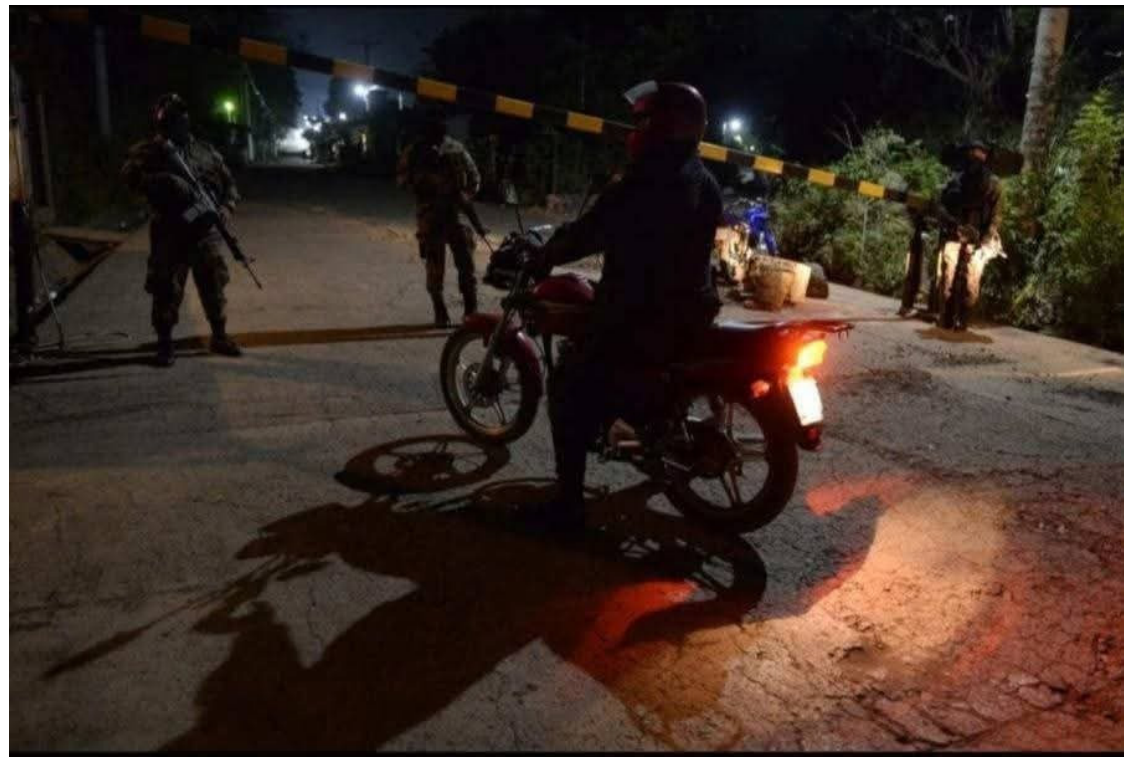
Un motín se habría registrado en el Penal de Izalco la noche del miércoles. Según información extraoficial son al menos 10 los privados de libertad los lesionados que fueron trasladados a un centro asistencial.

Francisco Omar Parada, del Bloque y Resistencia y Rebeldía Popular (BRP), dijo que dicho motín es el resultado del hacinamiento que viven las personas