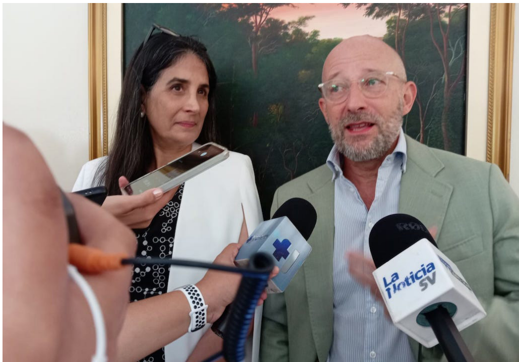
“CIHUATL Mujeres” es un proyecto financiado por la Unión Europea, que implementará ONU Mujeres, junto al gobierno salvadoreño a través del ISDEMU, un proceso que pretende garantizar la protección de los derechos de las mujeres.

“Estaba leyendo un libro esta mañana sobre el pensamiento transformador y es lo que espero de este proyecto que pueda cambiar la forma de pensar, porque son años y años en donde el hombre piensa que la mujer tiene un rol secundario; que la mujer tiene responsabilidades exclusivas y el desarrollo de la