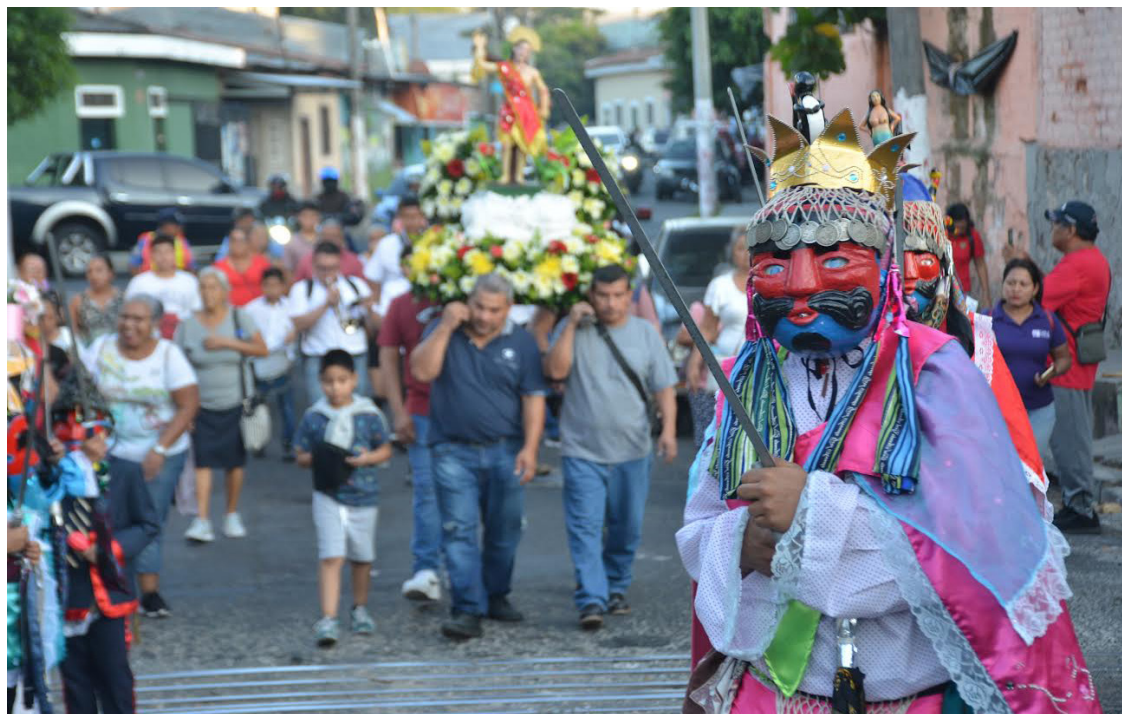
Las fiestas patronales de Ciudad Delgado, dedicadas a San Sebastián Mártir, aún representan para algunas familias una tradición que hay que preservar.

Este joven asegura que la danza es un distintivo de Ciudad Delgado, y en este caso de San Sebastián, por lo cual invita a las nuevas generaciones a interesarse más en ella, así como a sus pobladores, “para evitar que se pierda”. Además, recuerda que el origen del distrito es de la unión de tres pueblos, y por