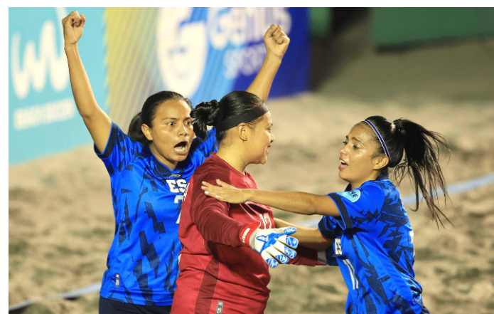
El Salvador Beach Soccer Cup se disputará en el Complejo Flor Blanca desde el 14 al 16 de febrero.

Joan Cuscó, presidente de Beach Soccer Worldwide, afirmó que “es un gran placer para BSWW organizar otro evento más con el INDES, mientras nos acercamos a nuestro séptimo año de asociación con ellos, del cual estamos extremadamente orgullosos y agradecidos. Esperamos continuar la gran relación entre BSWW e INDES, y estamos entusiasmados con nues-