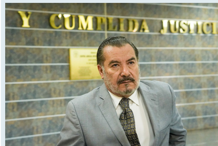
Ex diputado es procesado por supuesto enriquecimiento ilícito.

Para exdirigentes del FMLN, este tipo de acciones contra exfuncionarios del FMLN es parte de la persecución política que mantiene el gobierno contra ese partido, sobre todo contra las figuras históricas.