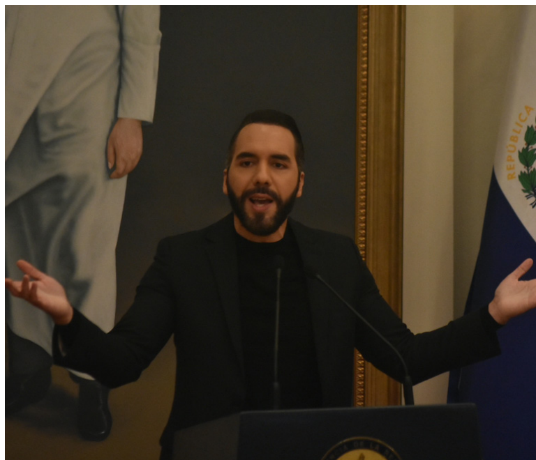
Nayib Bukele tardó más de 2 horas para brindar la conferencia de prensa programada para las 4 de la tarde. Además, no se le permitió preguntas a medios investigativos.

El presidente de El Salvador, Nayib Bukele, dijo en conferencia de prensa que toda la contaminación que sale en los reportajes y notas periodísticas “no está generada por la minería, si no por cualquier otra actividad, porque en este país hasta el día de hoy, no hay minería”. El mandatario desacreditó que la explotación minera contaminaría el medio ambiente tal y como las organizaciones sociales han expresado, ya que se puede realizar una “minería responsable”.