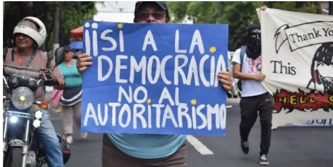
El Examen Periódico Universal (EPU) es un mecanismo de Naciones Unidas (ONU), para que otros Estados, evalúen a otros gobierno sobre el cumplimiento de las obligaciones a proteger los derechos humanos de la población y los avances como sociedad democrática.

En cuanto al mecanismo del EPU, el representante de la Oficina del Alto Comisionado de las Naciones Unidas (OACDH) agregó que esta evaluación se le llama también “ciclo”, porque consiste en la presentación de información de tres fuentes que se