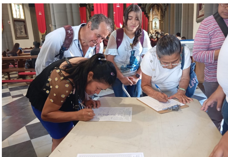
Feligreses estampan su firma en los documentos que la iglesia católica ha diseñado para la recolección de un millón de firmas contra la minería.

las firmas dentro de un formato de nombre y firma, por lo que los sacerdotes solicitarían a la feligresía su participación. También utilizarán las redes sociales para que los fieles puedan unirse a la campaña para presentar a la brevedad posible este documento ante la Asamblea Legislativa.