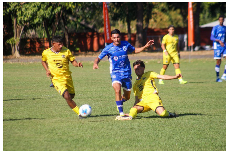
El Fuerte San Francisco vence 2-1 en la primera fecha al monarca del fútbol salvadoreño, Once Deportivo.

Seguido en la casilla 6; Águila, sin romper el empate, Isidro Metapán a pesar de que no debutó en esta jornada se quedó con la casilla 7, luego 11 Deportivo en la 8, Platense en la 9, Dragón en la 10 y Municipal Limeño en la 11.