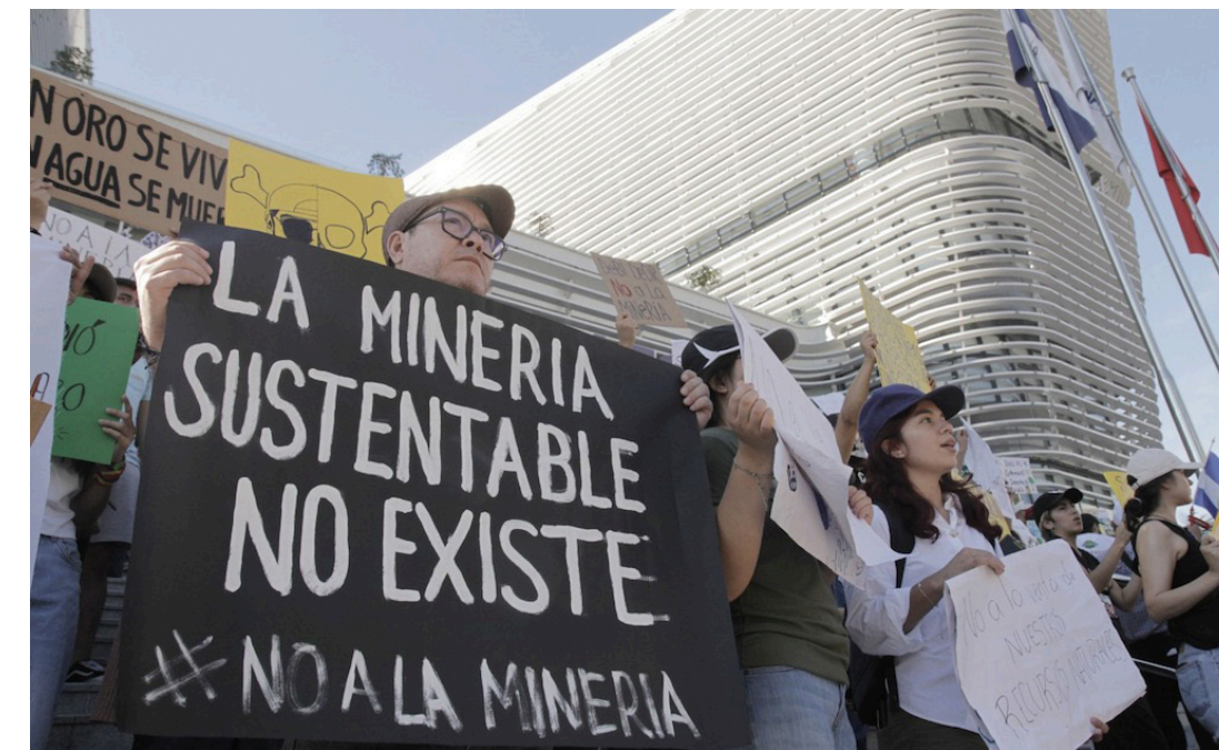
Activistas afirman que en El Salvador muchos de los ríos están conectados y que sólo un proyecto minero podría resultar en una catástrofe de grandes dimensiones en el país que conlleva desplazamientos forzados.

“Nos hemos dado cita a este plantón de forma personal, no como organización, y estamos aquí en esta convocatoria desde la sociedad civil y juventudes específicamente, y