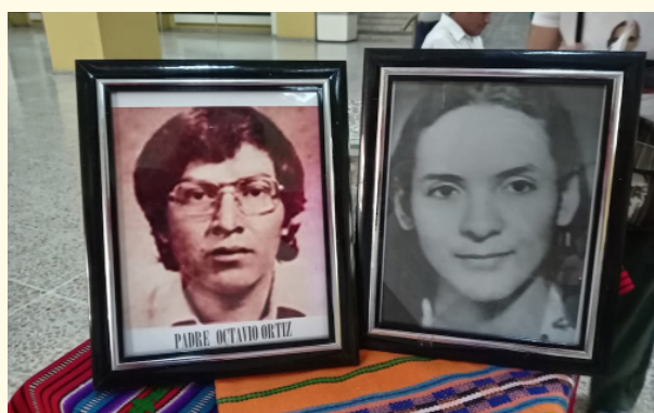
La santa misa conmemoró el martirio del padre Octavio Ortiz, el 20 de enero de 1980, que fue asesinado en “El Despertar” en San Antonio Abad, junto a 4 estudiantes y catequistas y el martirio de la hermana Silvia Arriola el 17 de enero de 1981.