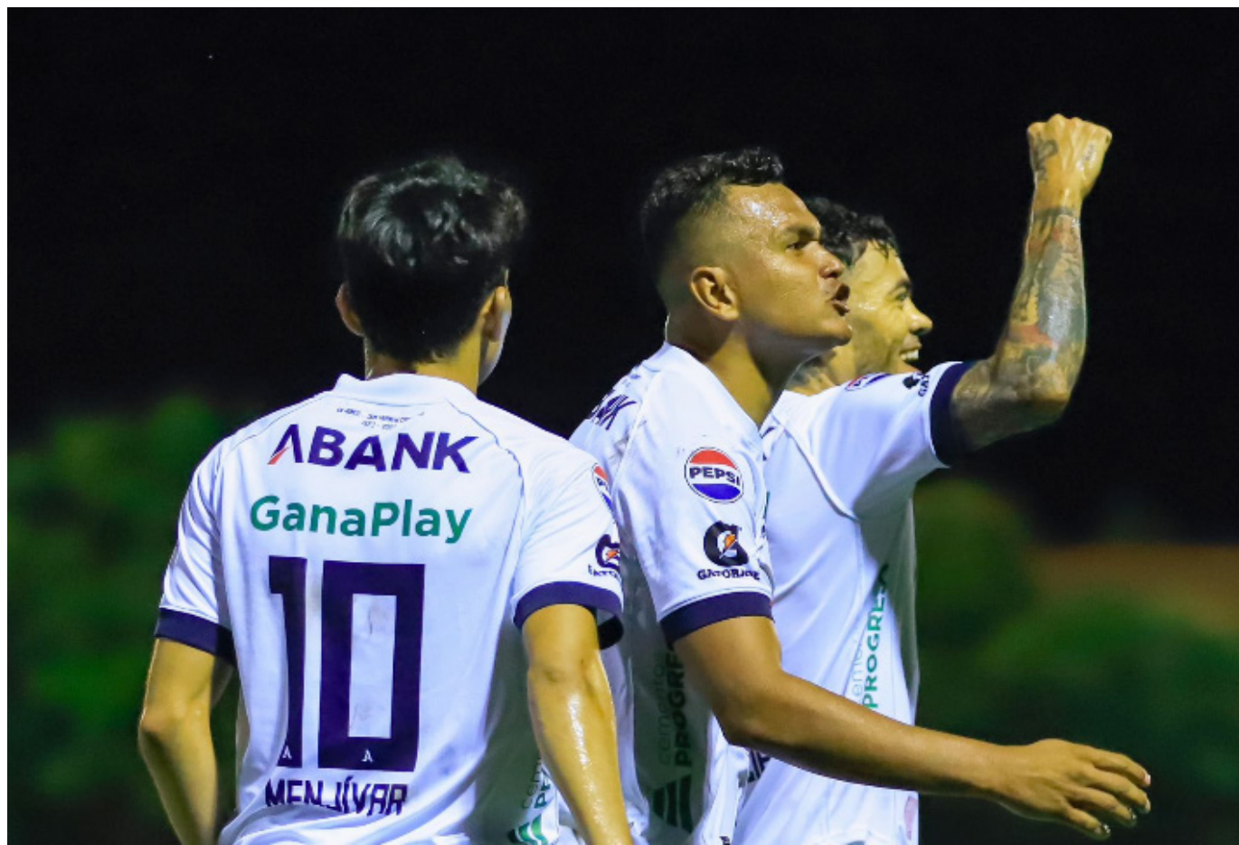
Alianza inicia el Clausura 2025 goleando 4-1 a Municipal Limeño en Santa Rosa de Lima.