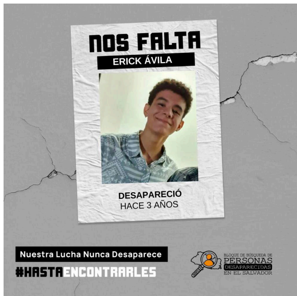
El Bloque de Búsqueda de Personas Desaparecidas en El Salvador, demanda justicia a las autoridades en los casos de sus seres queridos.

“Es junto con otras tres madres que decidimos fundar una asociación para acompañarnos en la búsqueda y exigir respuestas. Y con el tiempo mi compromiso me llevó a formar parte del Bloque de Búsqueda de Personas Desaparecidas en El Salvador, en donde encontré una red más amplia de familia-