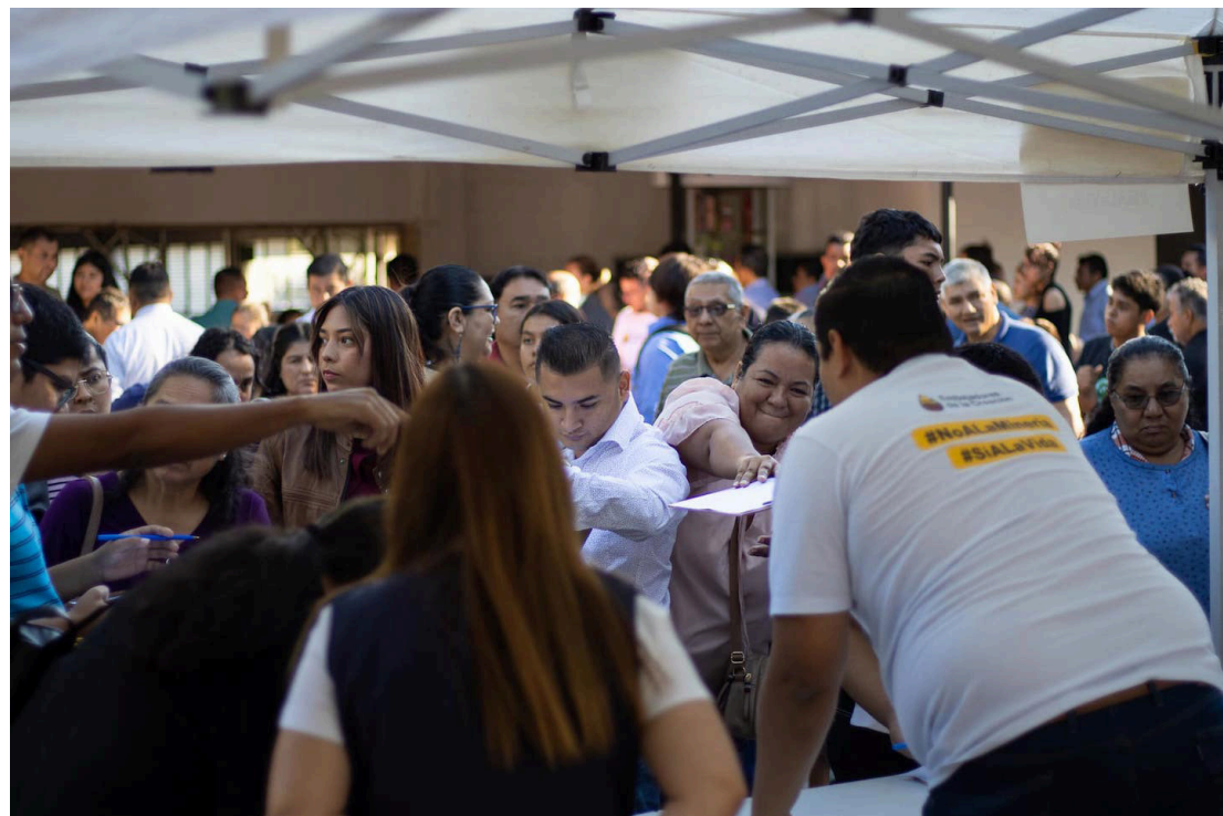
Esta iniciativa de recolección de firmas contra la minería, se suma a la realizada por la iglesia católica, que inició hace dos domingos.

Por lo anterior se hace necesario que los cristianos, como mensajeros de reconciliación, sean convocados por la ética