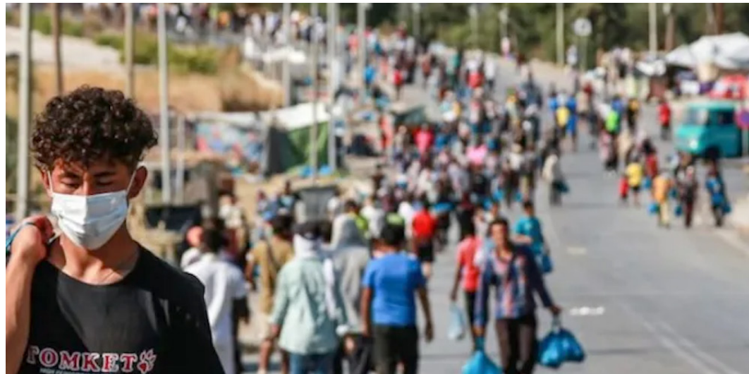
El Salvador se podría convertir en un país donde se deportan a migrantes de otras nacionalidades para pedir asilo en EEUU.

Recientemente se conoció que Trump y Bukele sostuvieron una llamada telefónica para hablar precisamente de frenar la migración irre-