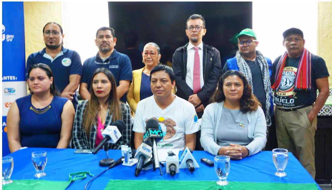
Organizaciones sociales exigen al Estado crear las acciones necesarias para el cumplimiento del derecho a la vivienda adecuada, derechos laborales y sindicales, derecho a la alimentación, derechos del campesinado y derechos culturales, derecho a un medio ambiente sano, derecho a la educación, derecho a la salud, así como los derechos sexuales y reproductivos de las mujeres.

del MTD, afirmó que el sector sindical sufre de persecución y criminalización. “Tenemos todavía compañeros capturados por el simple hecho de exigir que se cumplan sus derechos, que se proporcionen sus insumos para el trabajo”, aclaró.