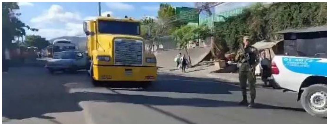
El conductor de un camión perdió el control y murió al chocar contra los separadores sobre el kilómetro 45½ de la carretera Litoral, hacia Zacatecoluca, La Paz.