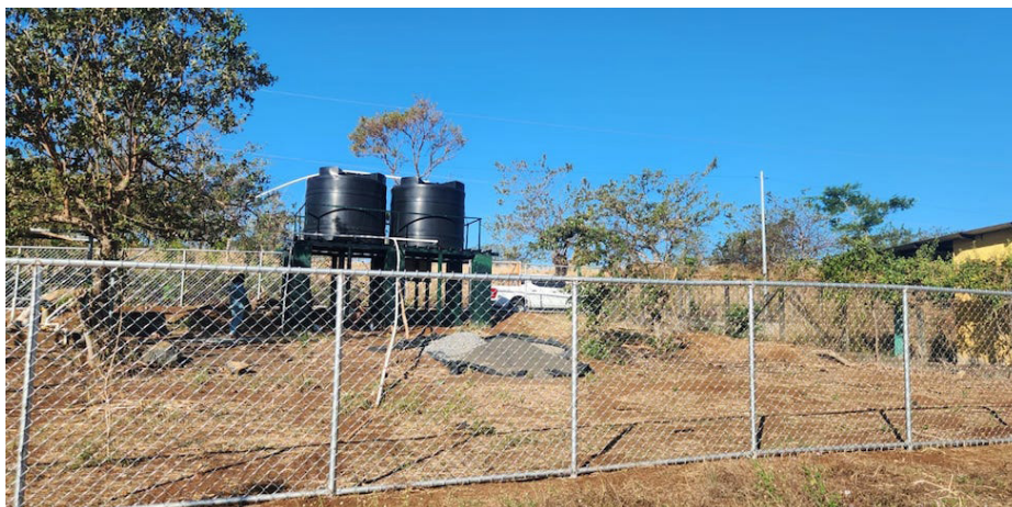
El proyecto en la comunidad La Barranca y Las Promesas, se beneficia de un sistema de agua con tanques elevados para el bombeo de agua con el aprovechamiento del principio de gravedad, que tienen la capacidad de 5 mil litros que abastecen a diario con agua domiciliar”, Foto DiarioCoLatino/Gloria Orellana.