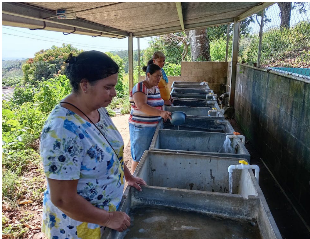
El Comité de Mujeres, en el asentamiento Nueva Suiza 1, en el cantón El Matazano, en Santa Catarina Masahuat, Sonsonate trabajan organizadamente para plantear sus demandas con la ayuda de PROVIDA, a fin de formular proyectos de beneficios locales.

“En verano se raciona un poco el agua de las cisternas, las válvulas se abren por un tiempo medido, más que todo en los lavaderos, con el objetivo de racionar el agua para cubrir los meses de febrero, marzo y abril, ya en mayo caen las primeras lluvias y las cisternas automáticamente se llenan por medio del sistema de captación. Hasta se hay rebales y no hay racionamientos en el uso del agua en los sistemas”, concluyó Cartagena.