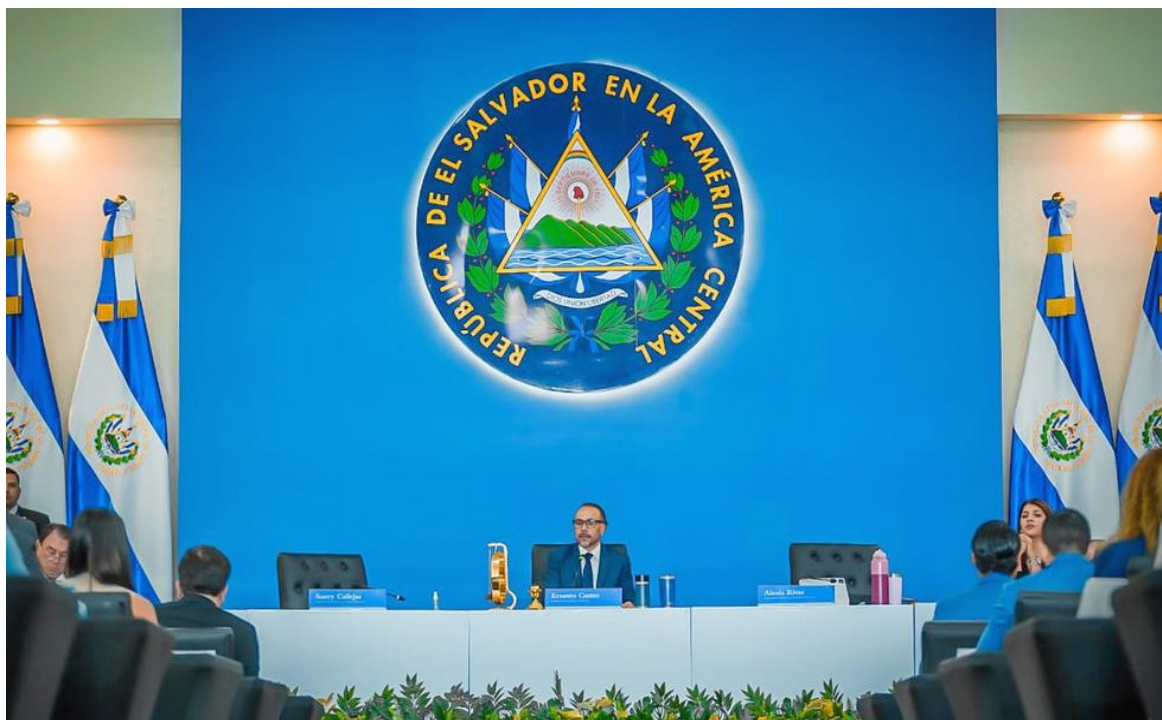
En Cancillería, la Asamblea Legislativa ratifica la reforma a la Cn.

G olpe a la máxima ley de El Salvador. Los 57 diputados oficialistas y aliados ratificaron la reforma al Artículo 248 de la Constitución de la República, para que una sola legislatura pueda efectuar reformas constitucionales. De acuerdo a la Carta Magna, el artículo reformado es de los considerados péticos, es decir, solo puede ser modificado mediante una Constituyente.