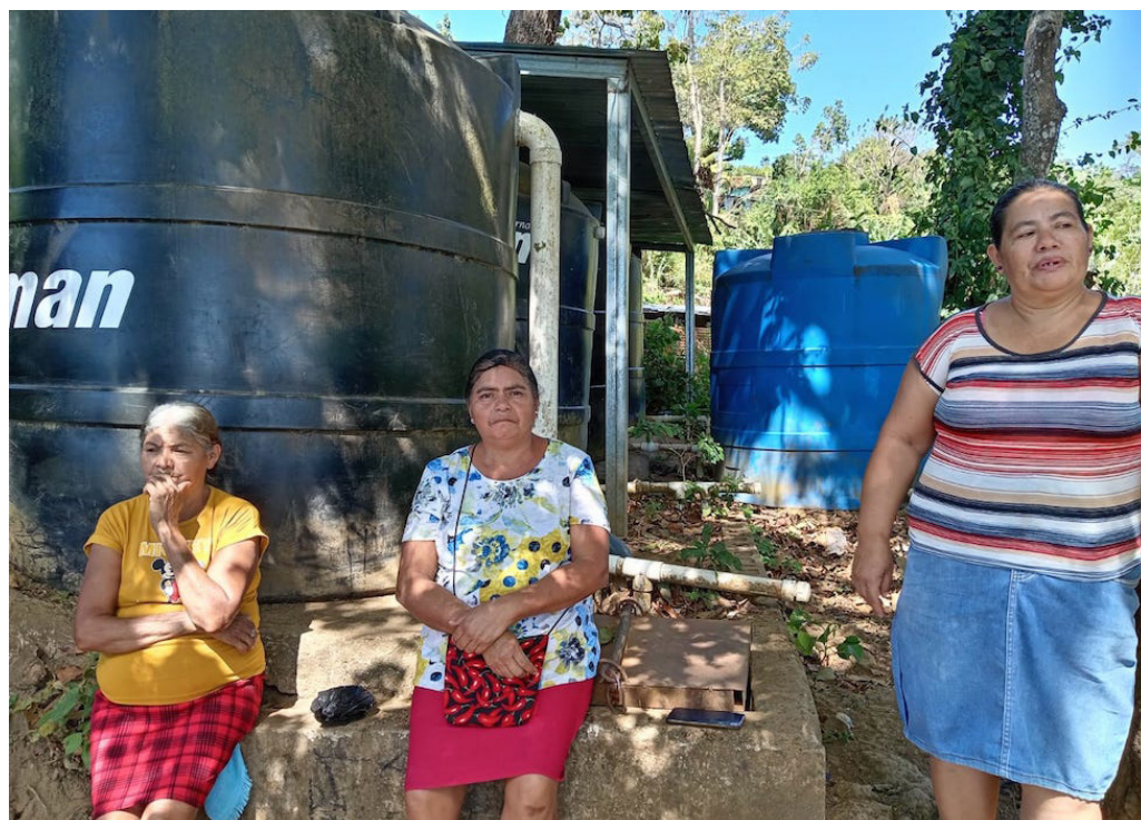
Ante la falta de agua superficiales en la comunidad de El Matazano, PROVIDA junto al Colectivo El Salvador Elkartasuna, y ayuntamientos de Navarra, Villava-Atarrabia, Burlada y Tudela, han implementado un modelo de captación de aguas lluvias para agua de consumo humano con zonas recreativas, que permite a las amas de hogar estar con sus hijos e hijas en un lugar seguro mientras lavan ropa o se bañan.