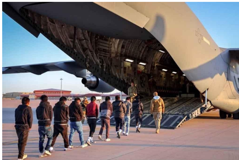
Las actuaciones bilaterales «solo debilitan» a los países y aseguró que los países se verán obligados a recibir migrantes de otros países por el convenio del «tercer país seguro».

En declaraciones al diario El Mundo, Medrano acentuó que las políticas migratorias tomadas por Washington requieren «una urgente coordinación para dar respuestas comunes», y señaló que «lamentablemente» los gobiernos centroamericanos no parecen tener «madurez ni vo-