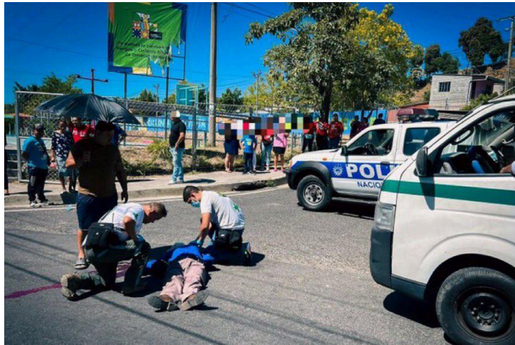
Una persona falleció luego de caer de un microbús del transporte colectivo en Soyapango, San Salvador.

Un múltiple accidente de tránsito deja 20 personas lesionadas, cuando un autobús de la ruta 101D impactó contra 10 vehículos que estaban detenidos en el semáforo en la intercepción de la 79 avenida sur y el Paseo General Escalón, San Salvador.