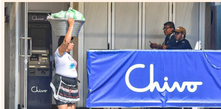
Las personas no utilizan el bitcoin como forma de pago.

Lo cierto, es que la población salvadoreña olvidó este tema, siendo un fracaso del Gobierno. Ahora, lo admite al reformar la ley a petición del FMI.