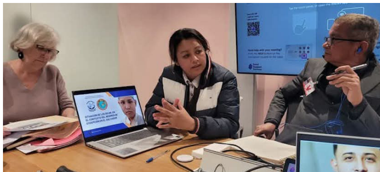
Socorro Jurídico Humanitario presenta ante la ONU un informe de personas inocentes capturadas completamente sanas, pero luego resultan con graves enfermedades.

“Murió bajo tutela del Estado, la comunidad internacional debe