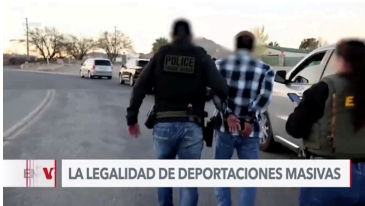
Captura de pantalla de la VOA.

Señaló que parte del diálogo con las autoridades estadounidenses es que “bajo ningún contexto, un hondu-