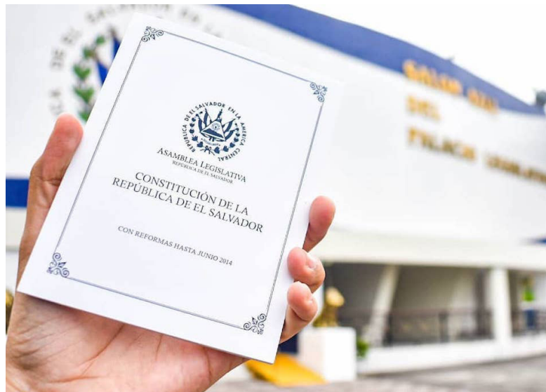
FESPAD señala que la reforma del artículo 248 de la Constitución representa, menos control popular en las actuaciones del Estado.

“FESPAD rechaza la reforma constitucional porque altera el mecanismo de reforma establecido actualmente y, por