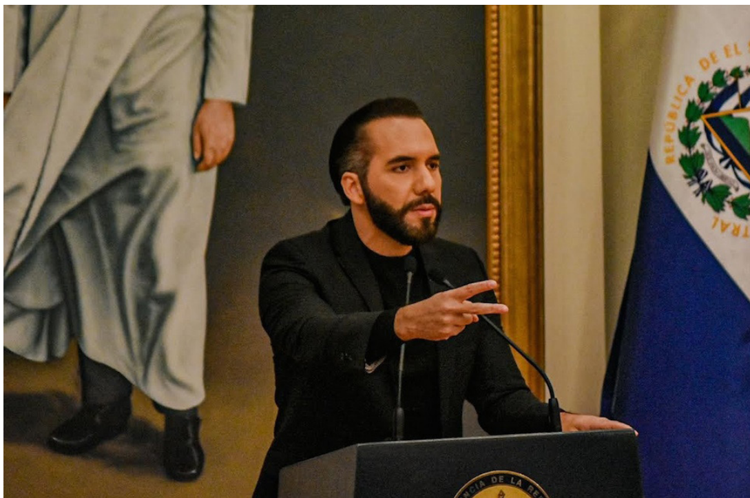
Nayib Bukele envía a la Asamblea Legislativa una propuesta de Ley Anticorrupción.