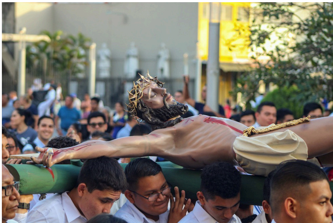
Con una procesión de la imagen de Jesús crucificado desde la iglesia El Rosario, hasta Catedral Metropolitana, la iglesia católica inauguró el Año Jubilar en El Salvador.