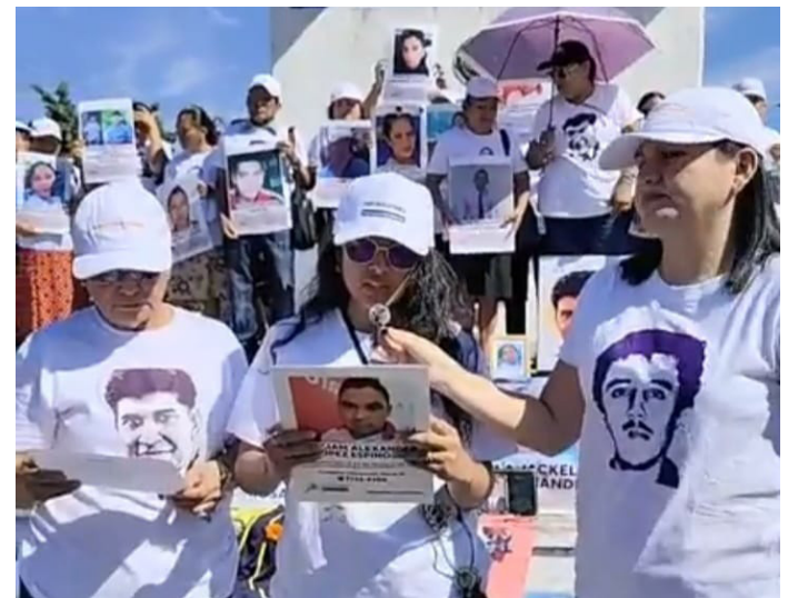
El Bloque de Búsqueda de Personas Desaparecidas pide la creación y aprobación de una “Ley de Búsqueda”.

El Bloque representa 46 casos de personas desaparecidas en el contexto de violencia actual, cuyas familias siguen esperando respuestas por parte