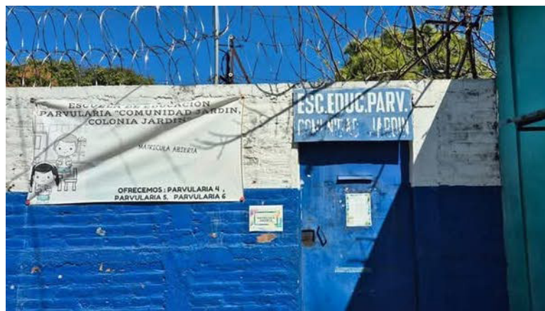
Ministerio de Educación ha cerrado cerca de 25 centros escolares, entre ellos la Escuela de Educación Parvularia, Comunidad Jardín, en Mejicanos, San Salvador.

aumento en los índices de deserción escolar a nivel nacional, incremento del analfabetismo en un futuro, hacinamiento de estudiantes en las aulas y precarización de la educación pública salvadoreña”, enfatizó.