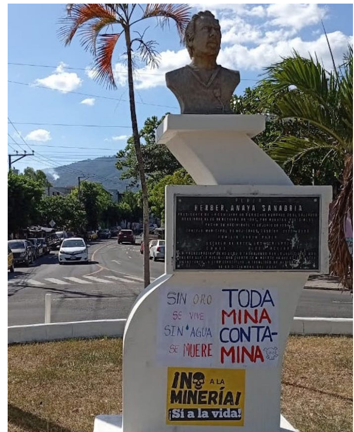
Las protestas de la población demuestran una preocupación por la activación de la minería, debido a los impactos negativos.

“Donald Trump va a adecuar algunas cuestiones en favor del imperio, lo que ellos protegen es precisamente su grupo de la oligarquía del imperio, la soberanía de otros países hermanos en Latinoamérica se ve amenazada, Estados Unidos está sobre los recursos de otros países y esa política con este presidente no va a cambiar”, afirmó.