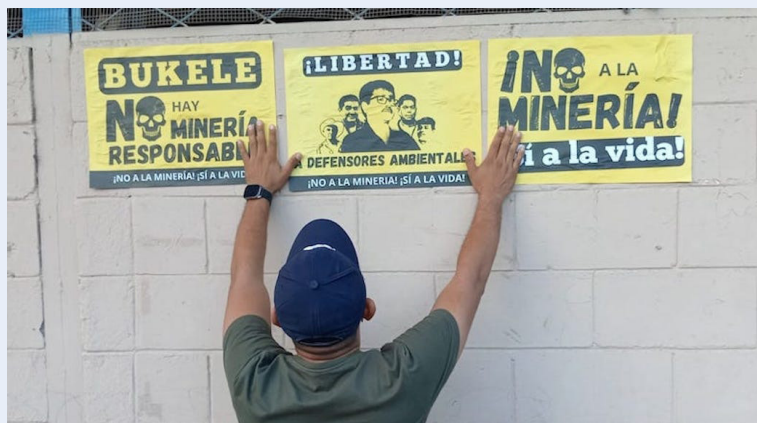
REVERDES junto a otras organizaciones lleva a cabo la pega de afiches y carteles, en rechazo a la minería metálica.

Algunas organizaciones y movimientos sociales pe-