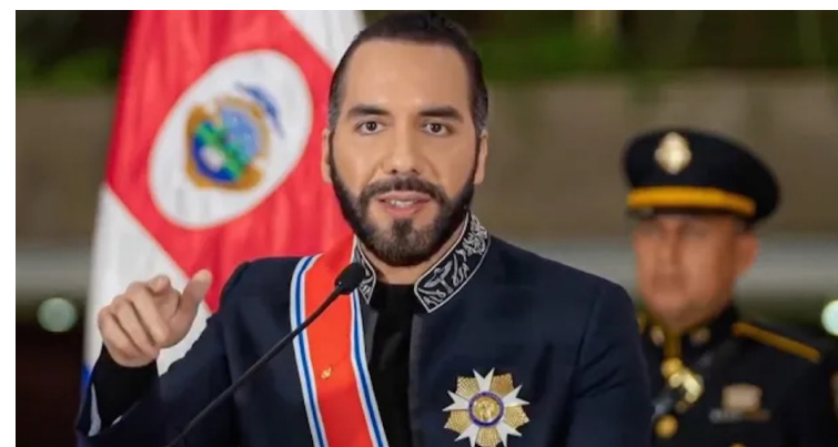
El presidente Nayib Bukele reacciona sobre el tema, de la suspensión de ayuda, señalando que es beneficioso para Estados Unidos.

Y fue el secretario de Estado, Marco Rubio, que hoy anda de gira por varios países centroamericanos, quien envió un memo a las embajadas y ofici-