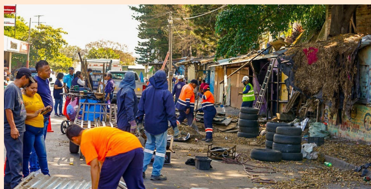
La alcaldía de San Salvador desaloja cerca de 16 puestos que comercializaban llantas y accesorios para carros, frente al cementerio Los Ilustres.

La comuna afirmó que los comerciantes fueron reubicados “voluntariamente”, pues forma parte del plan de revitalización del centro de San Salvador, sin embargo, estás personas quienes llevan hasta 25 años trabajando en la zona, manifestaron que la al-