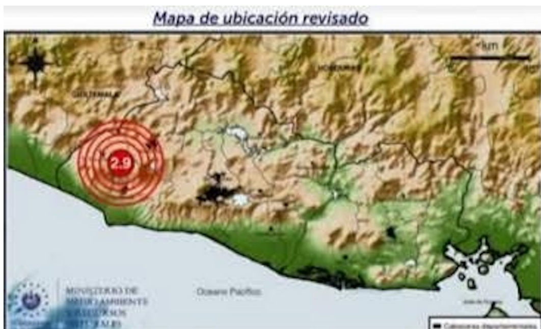
Las autoridades recomiendan a la población mantener la calma ante un sismo, el asustarse solo puede paralizarse o hacer cometer errores.

coles el cielo estará poco nublado durante todo el día, con un ligero aumento de nubosidad en la tarde únicamente en la cordillera volcánica, no se pronostican lluvias.