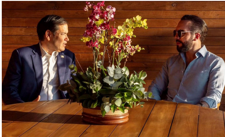
Marco Rubio, Secretario de Estado de Estados Unidos, y Nayib Bukele, presidente de El Salvador.

El Salvador aceptará a migrantes indocumentados de cualquier nacionalidad que hayan cometido crímenes graves en suelo estadounidense, así lo acordaron el presidente de El Salvador, Nayib Bukele y el Gobierno de Estados Unidos a través de su secretario de Estado, Marco Rubio, el lunes pasado.