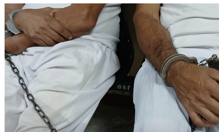
Sujetos acusados de extorsión son enviados a instrucción.

Según las declaraciones de las víctimas, desde el año 2020, miembros de la Mara Salvatrucha que operaban en Ciudad Futura, Vista Hermosa, Villa Ma-