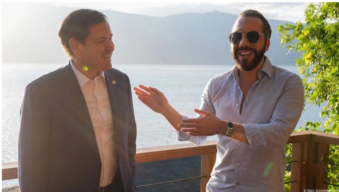
FUDECEN expresó su preocupación ante la visita del secretario de Estado de los Estados Unidos, Marco Rubio, debido a la omisión de temas trascendentales para el pueblo salvadoreño.

Según datos de FUDECEN, más de dos millones de salvadoreños residen en Estados Unidos y en 2023 aportaron más de $8,000 millones a la economía de