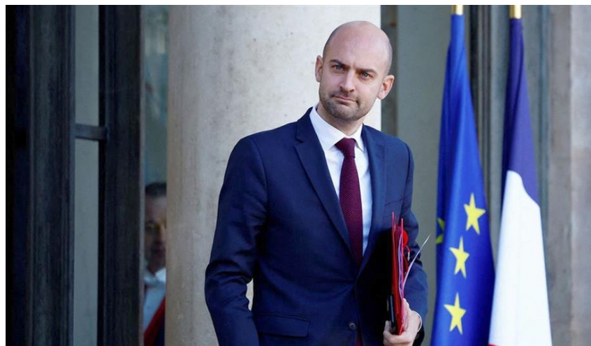
Jean-Noel Barrot, ministro de Relaciones Exteriores de Francia.

El domingo, Trump anunció planes de imponer nuevos aranceles de 25 por ciento a todas las importaciones de acero y aluminio a Estados Unidos, y para este lunes se espera un anuncio oficial.