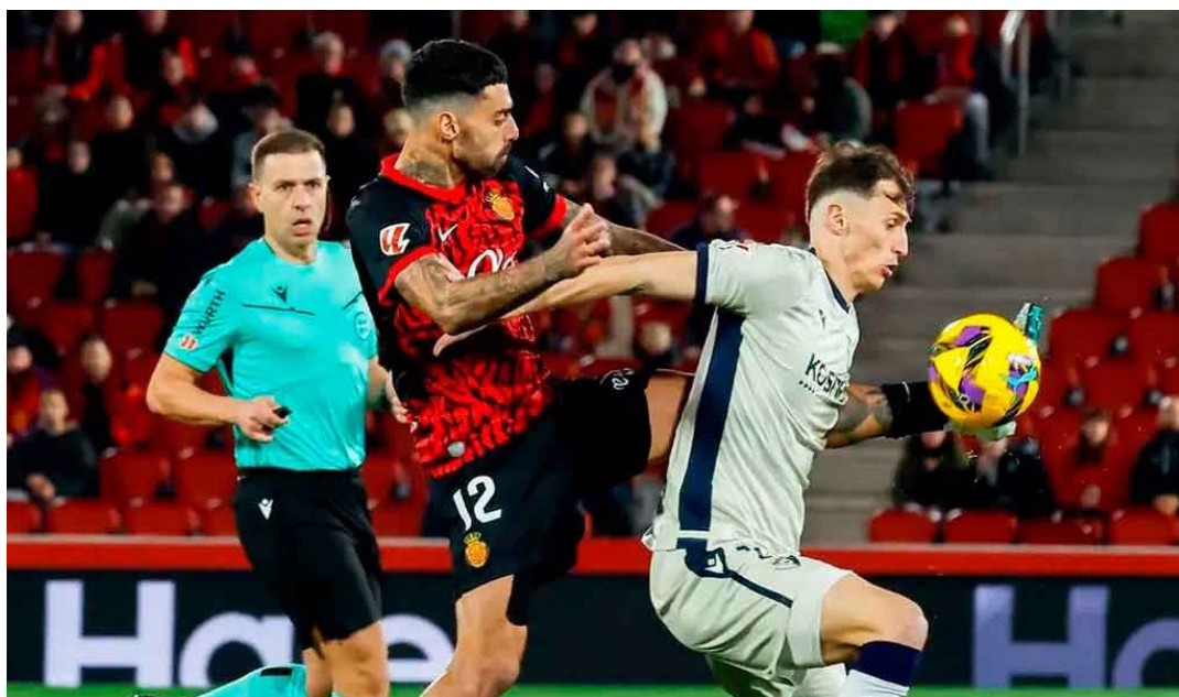
Palma de Mallorca, España

El Mallorca y el Osasuna empataron este lunes a un gol en el Estadio Son Moix, en el cierre de la jornada 23 de la Liga Española de fútbol.