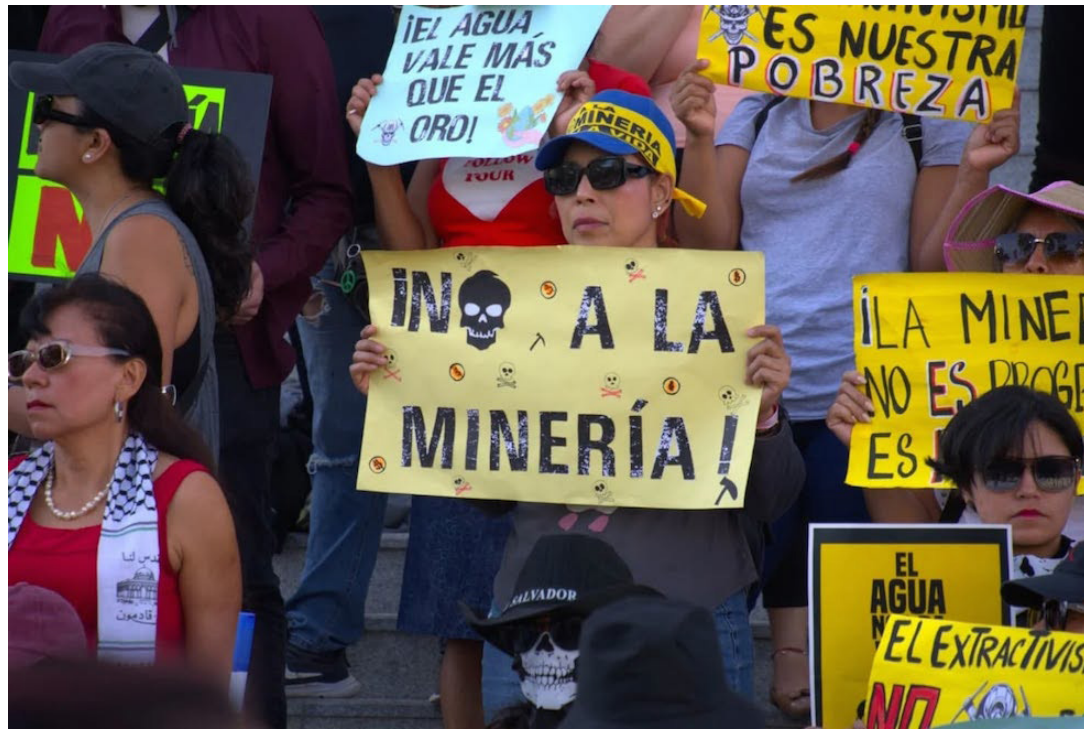
Para extraer los metales preciosos, se emplean sustancias químicas como el plomo, cianuro y otros, que son altamente tóxicos para el ser humano.

“Este país tiene una epidemia de Enfermedad Renal Crónica (ERC), y el sistema es incapaz de atender a toda la población que sufre de esta enfermedad. Y con la minería esto se va a incrementar a mediano y largo plazo, y el sistema de salud no podrá ser capaz de atender a esta población”, puntualizó Solano.