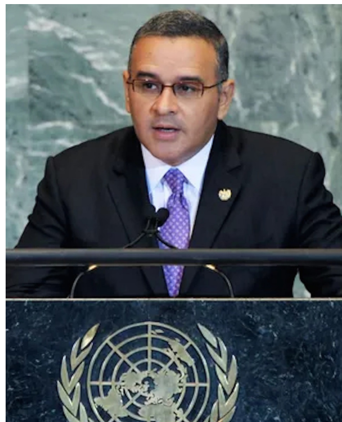
Los más favorecidos fueron niños, mujeres, adultos mayores y campesinos, «que antes no tuvieron esos beneficios», destaca la diáspora de El Salvador en Estados Unidos al celebrar el legado social del expresidente Mauricio Funes.

De acuerdo con los informes que circularon, Funes murió en Managua, donde residía, por complicaciones de una dolencia crónica.