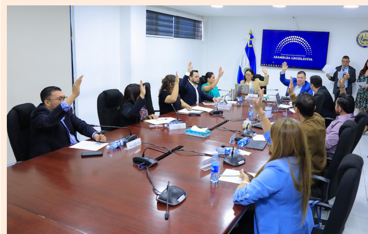
Estos dictámenes pasarán por el pleno legislativo esta semana. Serán $190 millones los que BANDESAL prestará al BID.

BANDESAL, según la representante de Hacienda, juega un papel relevante en el apoyo al sector MIPYME, por lo que provee de recursos con instrumentos de créditos focalizados para estas y así poder atender sus necesidades, entre ellas la transformación tecnológica digital para reducir dicha brecha.