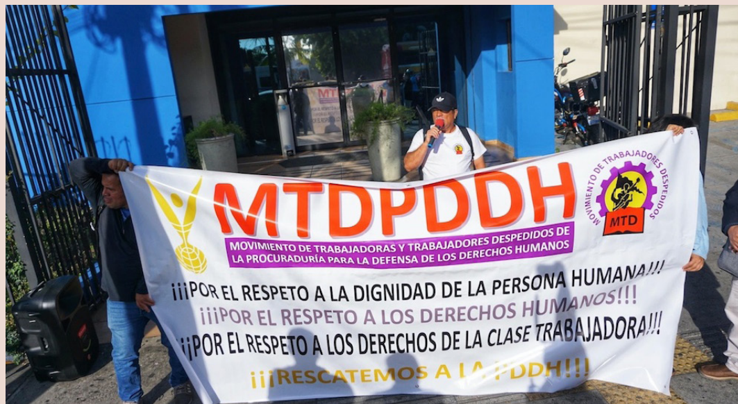
Empleados de la PDDH denuncian que los despidos empezaron desde diciembre de 2024.

“Nos vamos a ir por la vía de lo contencioso administrativo, que es lo que procede una vez se ha agotado esta instancia”, concluyó García.