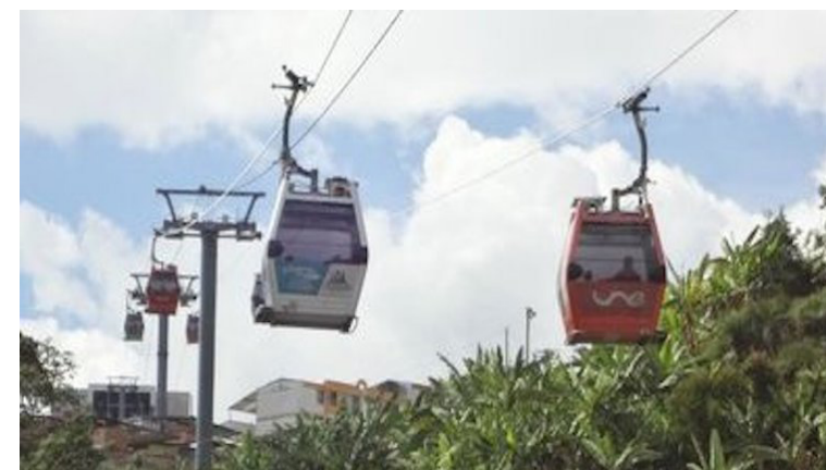
La comunidad organizada de la UES denuncia que el gobierno pretende construir en el campus las estaciones del proyecto de transporte aereocable.

MOP, no han sido renovados ni modernizados a pesar de las promesas oficiales, lo cual compromete la calidad académica y la formación integral de los 7,000 estudiantes que se inscribirán en el primer ciclo de 2025.