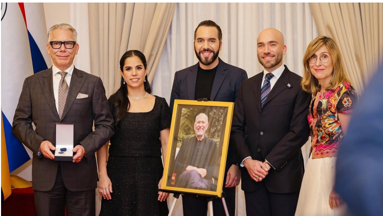
El presidente de El Salvador Nayib Bukele, se reúne en la Casa Presidencial con una delegación de 50 empresarios de Consejo Empresarial Alianza por Iberoamérica (CEAPI), en la reunión también hubo un homenaje póstumo a Piero Coen Montealegre.