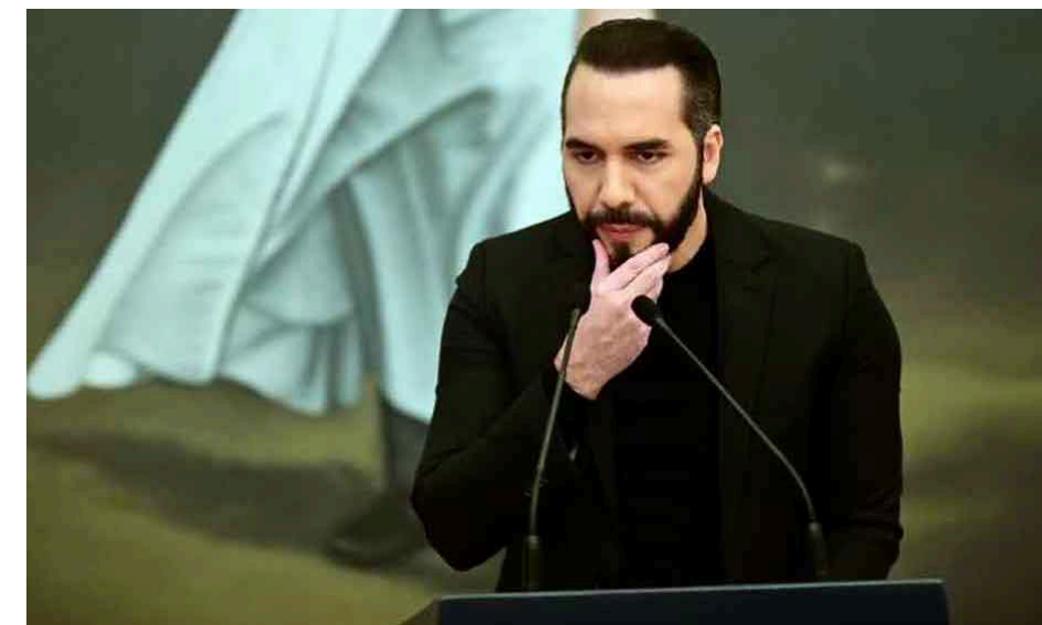
San Salvador/Prensa Latina

La eliminación de la deuda política que financia a los partidos y la prohibición de la minería metálica convierten a El Salvador hoy en escenario de confrontación y a la vez polarizan la sociedad.