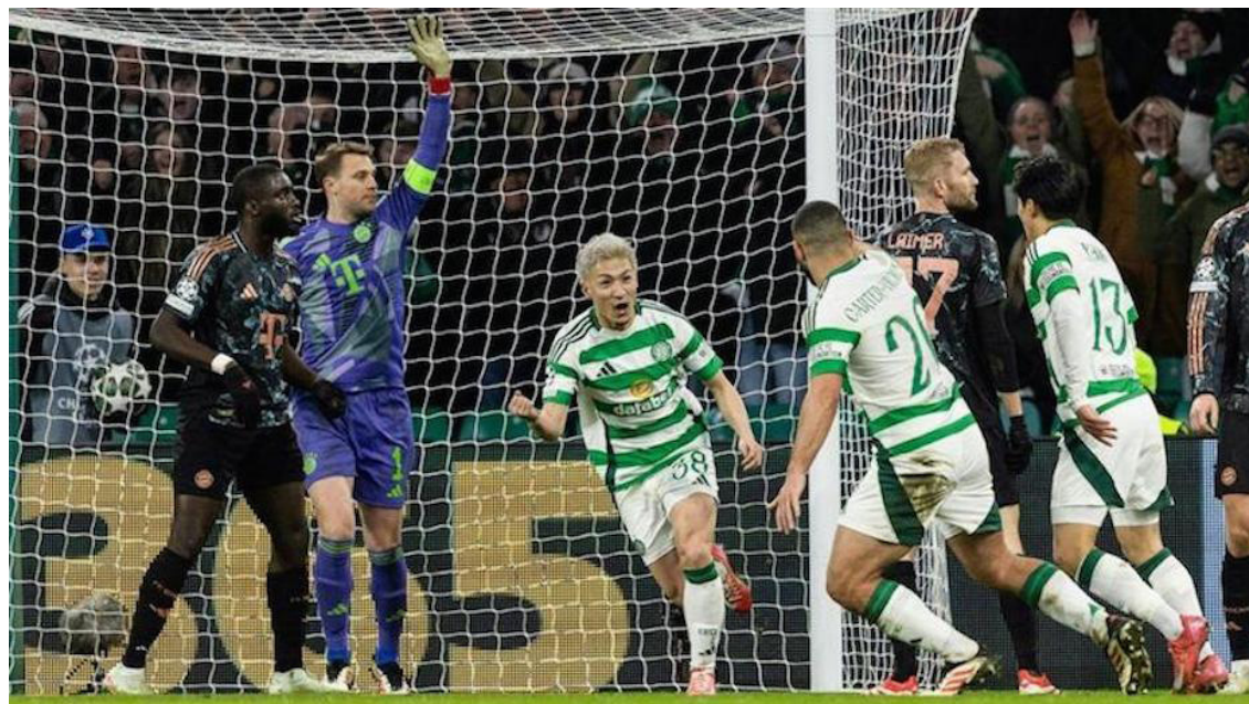
Glasgow, Reino Unido/Prensa Latina

El Bayern de Múnich doblegó este miércoles 2-1 al Celtic en el partido de ida de la Liga de Campeones de fútbol y puso un pie en los octavos de final del torneo.