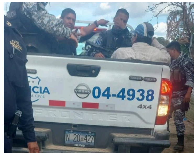
El pasado 9 de febrero de 2025 agentes policiales sin orden judicial detuvieron a líderes de la Comunidad La Floresta, San Juan Opico, La Libertad.

Además, enfatizaron que la comunidad fue víctima de un acoso arbitrario por agentes de la Policía Nacional Civil (PNC),