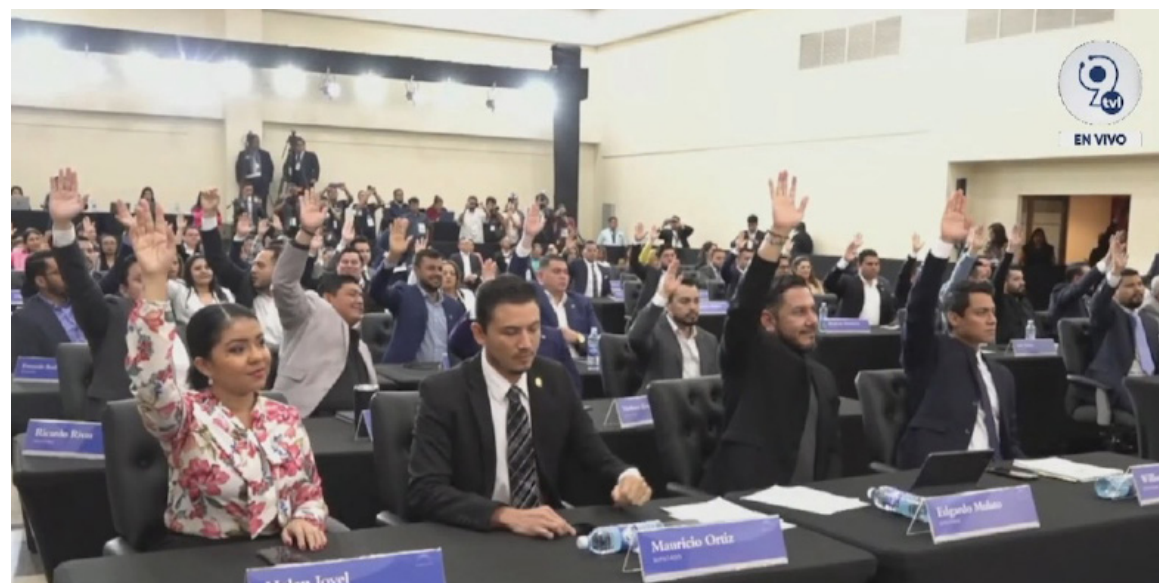
Diputados de Nuevas Ideas votan a favor de eliminar la deuda política.