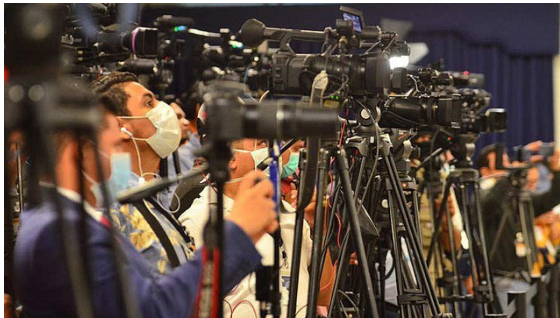
El presidente Nayib Bukele afirma que el “periodismo independiente no es más que un eufemismo para decir nuestros jefes están en la oscuridad.

“El periodismo no depende del dinero de USAID para seguir preguntando”, afirma el comunicado de prensa de la Asociación de Periodistas de El Salvador (APES), ante las declaraciones, a través de la red X, del mandatario Nayib Bukele, sobre el retiro de fondos de la USAID para proyectos de organizaciones sociales en el país, que incluye medios informativos.