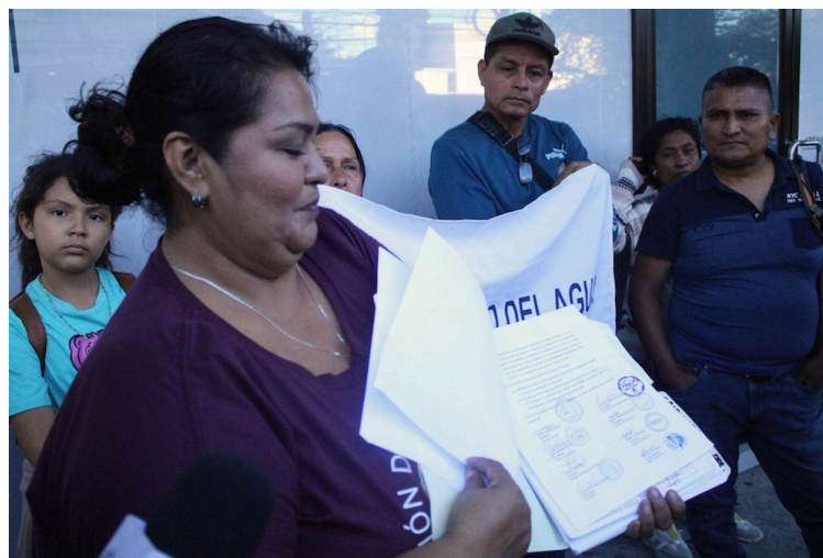
Habitantes de la comunidad Pueblo Viejo, San Bartolomé Perulapía, Cuscatlán, presentan una carta con 5,000 firmas, para negar el permiso de explotación de un pozo.

Habitantes de la comunidad Pueblo Viejo, de San Bartolomé Perulapía, departamento de Cuscatlán, pidieron a la Autoridad Salvadoreña del Agua detener la perforación de un pozo, porque amenaza en agudizar la crisis hídrica de aproximadamente 12,000 familias del lugar.