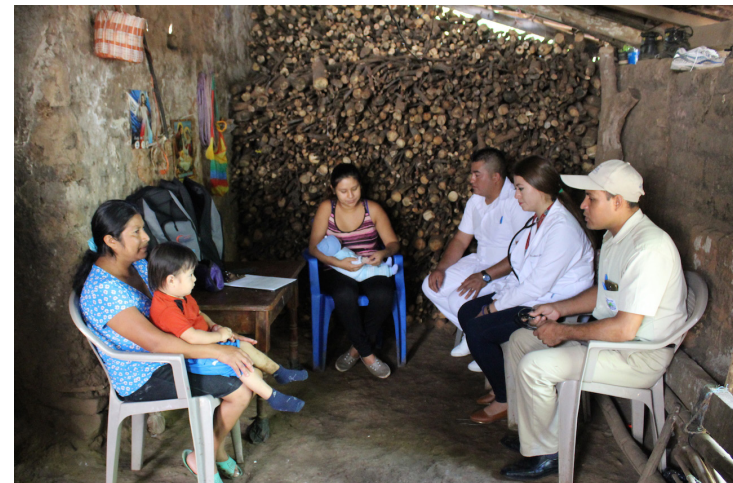
Con el cierre de los ECOS Familiares serán afectados pacientes crónicos, adultos mayores, embarazadas y los niños, quienes ya no recibirán la atención en sus comunidades.

En febrero de 2022 el Foro Nacional de la Salud (FNS) denunció el cierre de 20 ECOS y 21 Ho-