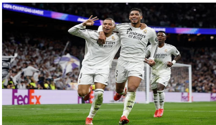
El Real Madrid elimina al City en playoffs de la Champions League y clasifica a los octavos.

Y la serie que se hizo sufrir y esperar por la afición fue el PSV-Juventus, donde este primero consiguió su boleto a los octavos de final tras borrar de la competencia al equipo italiano que necesitaba únicamente un