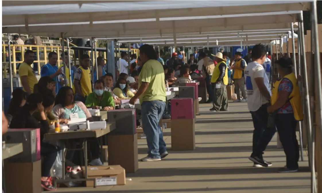
FESPAD sostiene que con la eliminación de la deuda política la afectada es la ciudadanía y el pluralismo político.

Según FESPAD el financiamiento público a los partidos políticos ha sido históricamente una herramienta para propiciar la equidad en las contiendas electorales, permitiendo que diversas fuerzas políticas, independientemente de su capacidad económica, puedan participar en igualdad de condiciones.