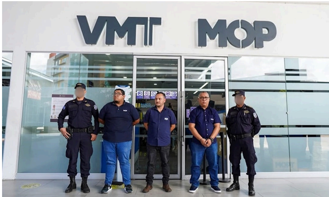
Empleados del VMT son capturados y presentados ante los medios acusados de cometer actos fraudulentos, en la emisión de licencias.