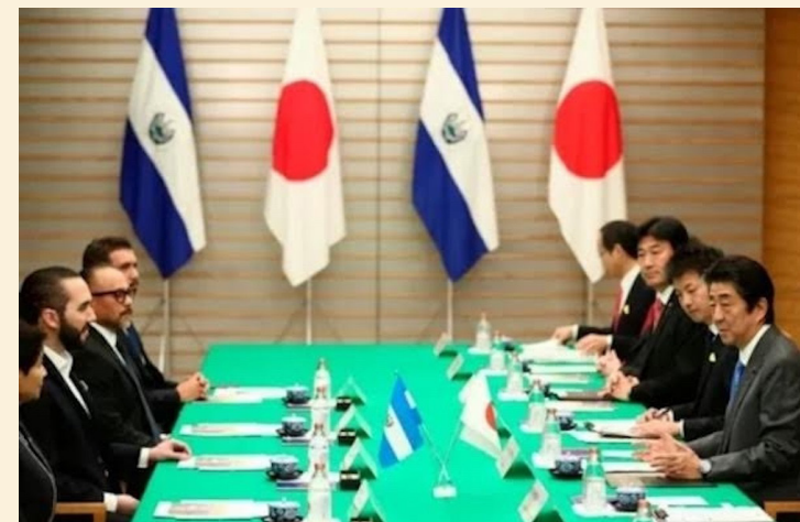
Japón se destaca como el tercer mayor cooperante en El Salvador a 90 años de tener relaciones diplomáticas con el llamado Pulgarcito de las Américas.

Entre los proyectos destacó la participación en la construcción del bypass de San Miguel y el puerto de La Unión, este último un proyecto potencial que según expertos servirá para unir mediante un canal seco los océanos Pacífico y Atlántico, lo que tendría un alto impacto en el comercio mundial.