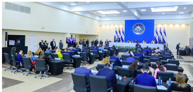
Asamblea se alista para ratificar reforma constitucional a fin de eliminar la deuda política.

Es de recordar que el 12 de enero los oficialistas aprobaron la derogatoria del artículo 210 a fin de eliminar el reconocimiento del Estado a la deuda política como mecanismo de financiamiento público de los partidos políticos en El Salvador. Para hacerlo efectivo, se debía ratificar por la siguiente legislatura con dos tercios o por la misma con las tres cuartas partes de los diputados electos, esto tras la reforma al artículo 248 de la Cn. para que una sola legislatura pueda modificar la Carta Magna.