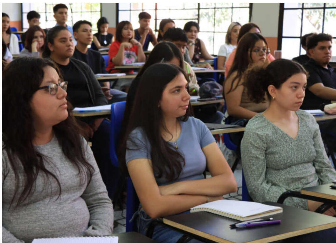
En el marco del Plan de Desarrollo de la Gestión 2023-2027, el componente sobre Innovación Académica, comprende la elaboración del Modelo Educativo de la UES, mediante un proceso amplio de consulta y una metodología de trabajo integrador.

Desde su fundación, la universidad ha aportado al desarrollo académico, científico, económico, social, político, deportivo y cultural del país, a través de sus