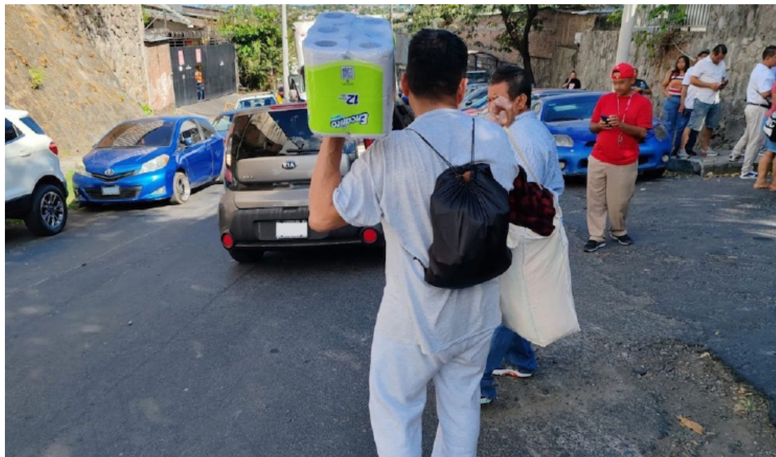
El proceso de deportación implica largas horas, malos tratos en el centro de detención donde permanecen más de cuatro meses entre otros.

Durante todo estos años vivió en Houston, Texas. Se dedicó a trabajar principalmente en la construcción de casas. Aunque acla-