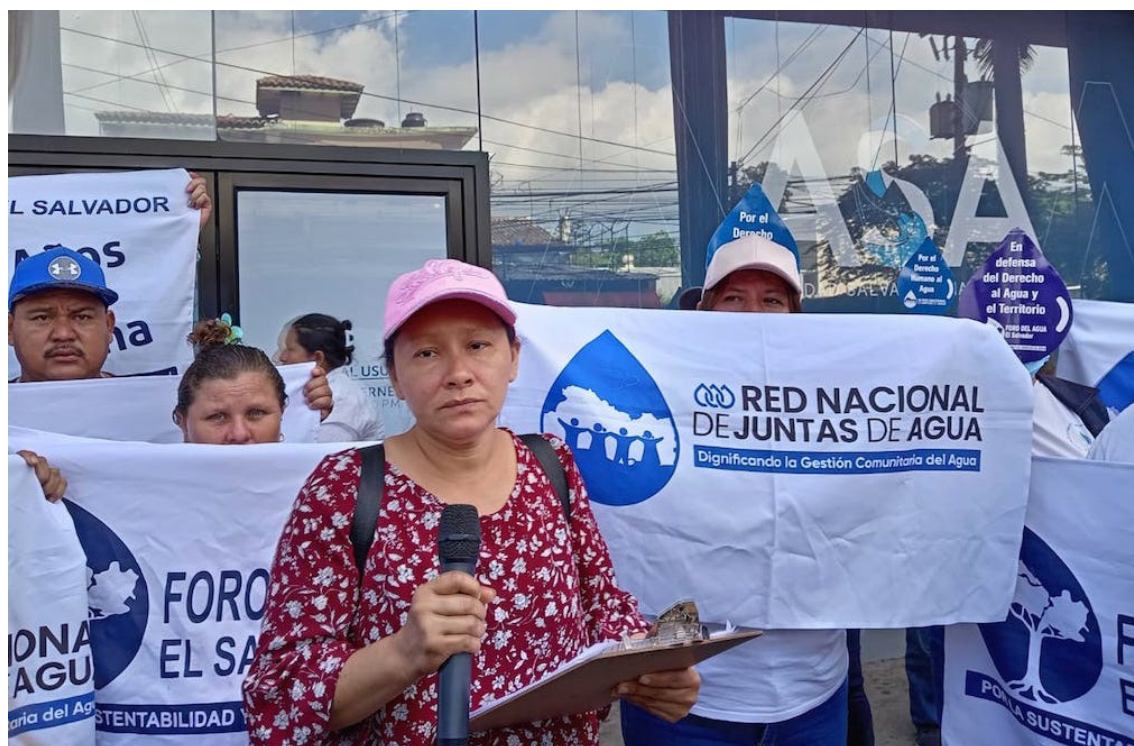
El Foro del Agua, junto a las comunidades María Auxiliadora y Los Alpes, de La Libertad Costa Este, demandan de la Autoridad Salvadoreña del Agua (ASA) una solución sobre el acceso al agua para el consumo humano frente a un nuevo pozo con fines comerciales.

“Ahora, el servicio lo tenemos 1 o 2 días por semana, prácticamente son 2 horas para cada comunidad y tenemos otro grupo que espera comprar su derecho y con-