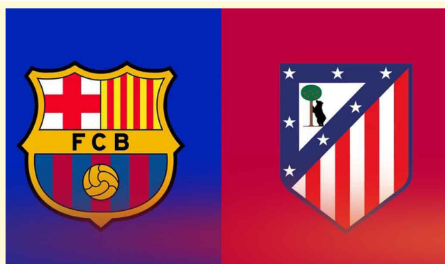
Madrid/Prensa Latina Por Fausto Triana

En El Güiri Güiri, por ejemplo, uno de los panelistas estuvo en contra del despido de Dóniga, ya que, según él, no es por donde se va a enmendar el estructural retraso del combinado nacional