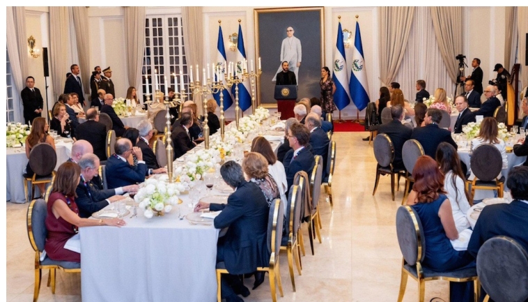
Bukele y líderes empresariales de América Latina se reúnen en Casa Presidencial.

“Queremos ser un país full libertad empresarial, capitalista, proempresa, un gobierno lo más fuerte, pero pequeño posible, que no tenga grasa solo músculo; pero que ese músculo vaya a enseñar a pes-