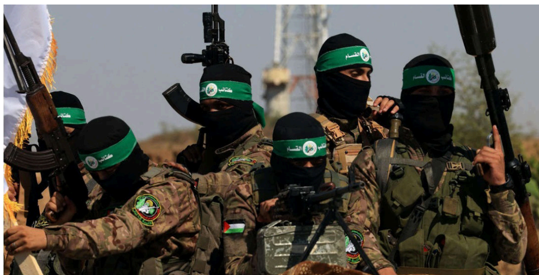
Israel se niega a liberar a más de 600 prisioneros palestinos, denuncia el Movimiento Hamas.

zamiento de la liberación de más de 600 prisioneros palestinos programada para el 22 de febrero has-