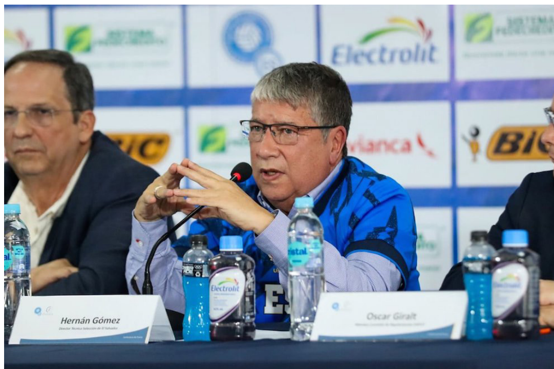
Hernán Darío “Bolillo” Gómez con la camiseta de El Salvador, asegura que trabajarán para ir al Mundial 2026.

tar ese nuevo reto, y entre ellas dijo: “vengo porque me gusta el país, porque me gusta el presidente, porque me gusta la sociedad, me gustan los salvadoreños (...), porque podemos enseñarles mucho a los muchachos, porque podemos transmitir muchas cosas humanas distinto al fútbol”.