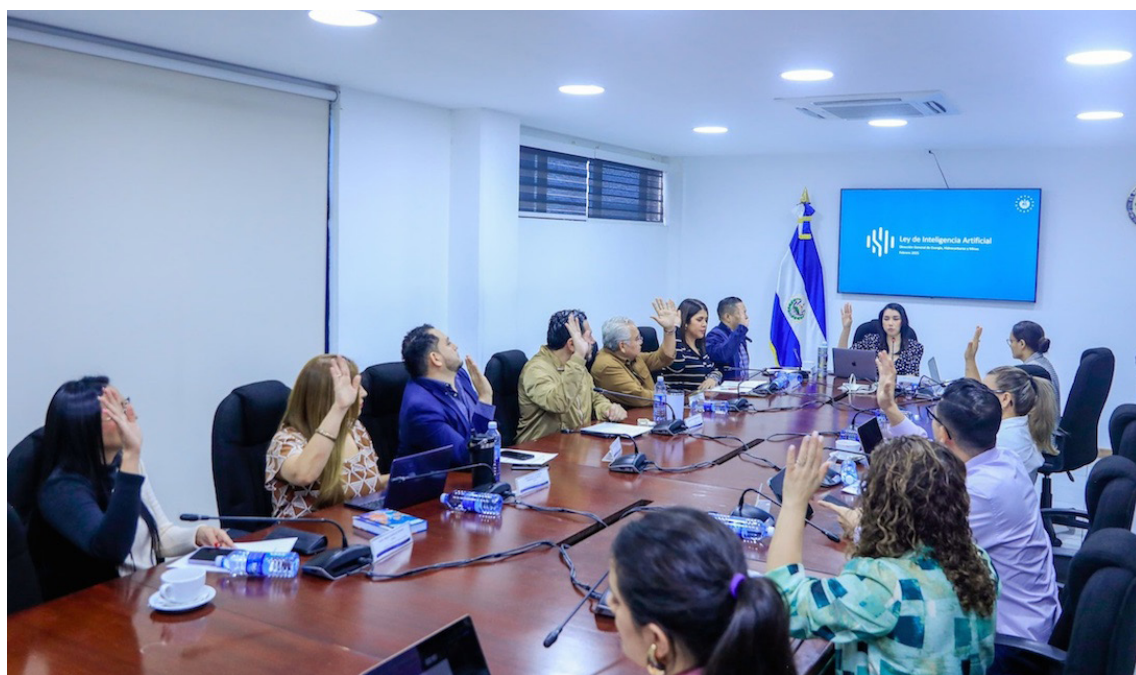
Comisión de Tecnología emite dictamen para crear Ley de Fomento Artificial.