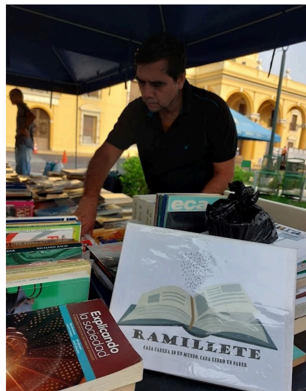
La Biblioteca Municipal apoya a escritores, emprendimientos culturales, editoriales y colectivos literarios con las “ferias de libros”.

Para el día, domingo 2 de marzo, cuando finalice la feria, se realizará el conversatorio: “Hablando de la historia de mi ciudad”, basado en el libro “Estampas del viejo San Sal-