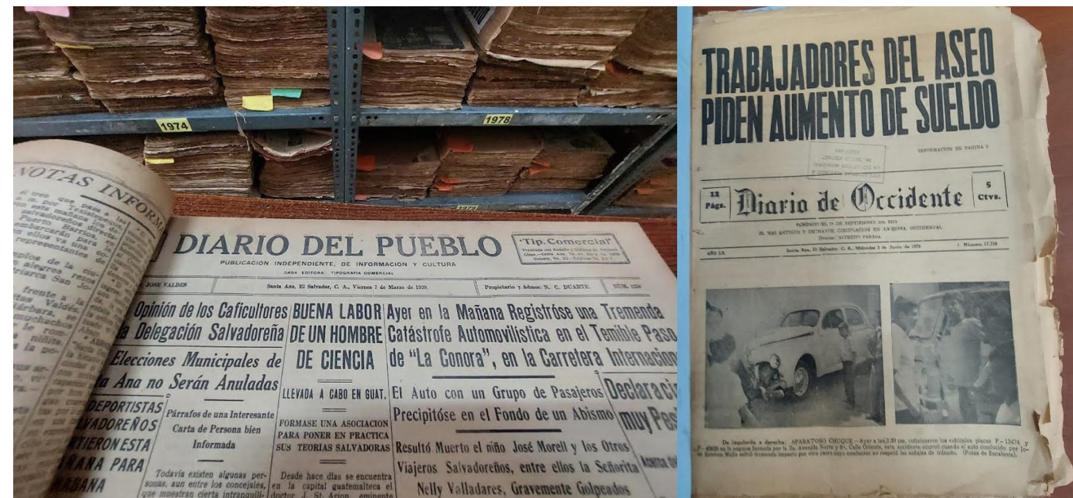
La Biblioteca Municipal de Santa Ana se fundó un 25 de diciembre de 1896, es decir, hace 128 años y cuenta con una hemeroteca, con periódicos antiguos que hablan sobre la guerra en El Salvador desde 1970 a 1992 y de historia de la ciudad.

Las Ferias de Libros son oportunidades para adentrarse al mundo de las letras y encontrarse con la cultura