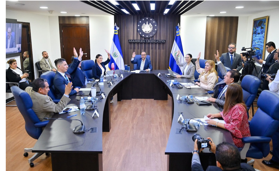
La Comisión Política dictamina a favor de ratificar la derogatoria del artículo 210 de la Constitución de la República, a fin de eliminar la deuda política.