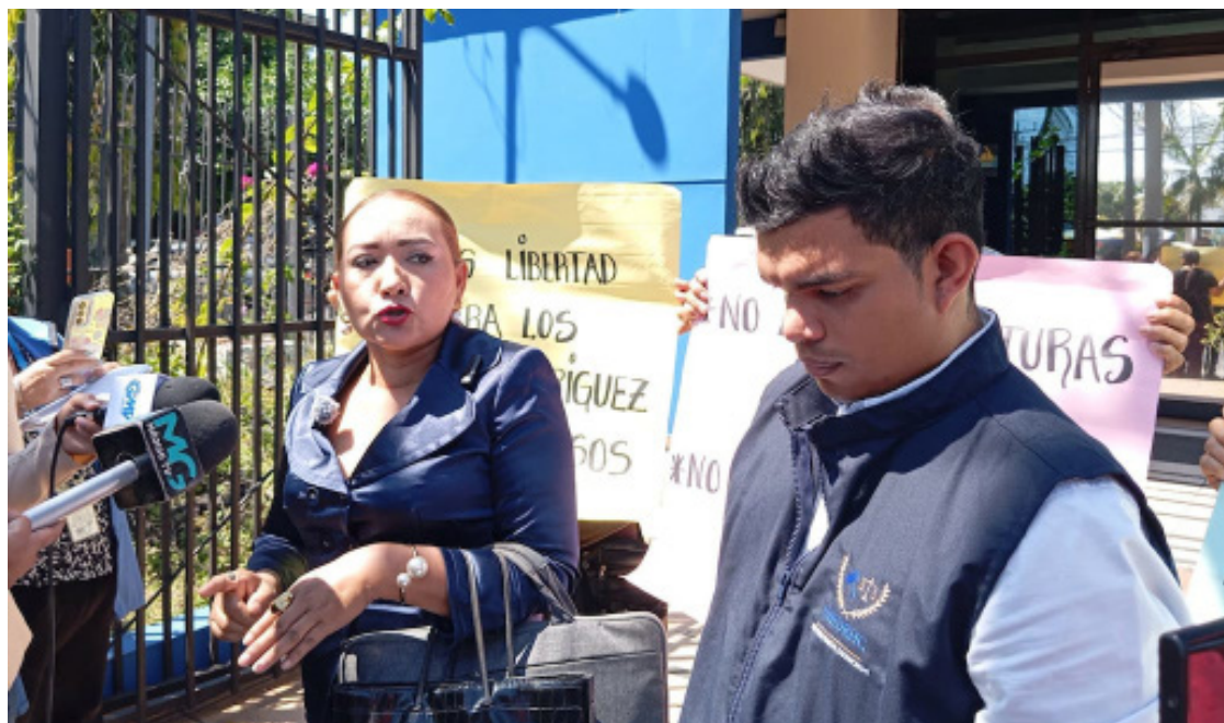
UNIDEHC y el BRP presentan a la PDDH una denuncia por las capturas arbitrarias de los líderes comunitarios Hacienda La Floresta, San Juan Opico, La Libertad. Foto Diario Co Latino/Alma Vilches.

La FGR pidió al Juzgado de Paz de San Juan Opico, que ambas personas se mantengan en detención provisional y el caso pase a la eta-