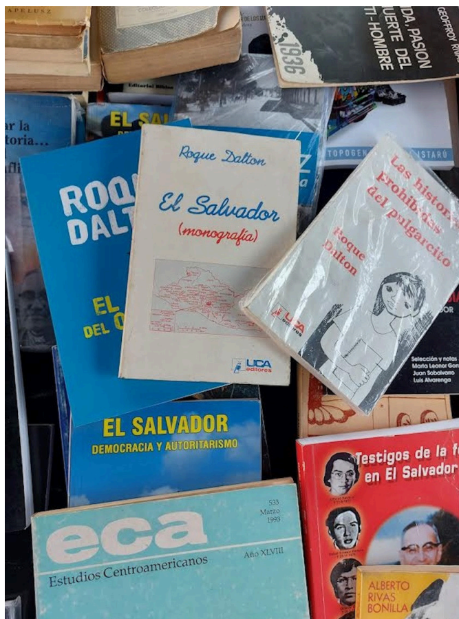
El pasado mes de enero se llevó a cabo la primera feria de este año, con motivo del regreso a clases, en la que se puede obtener libros de diferentes autores.

La Biblioteca Municipal de Santa Ana se fundó un 25 de