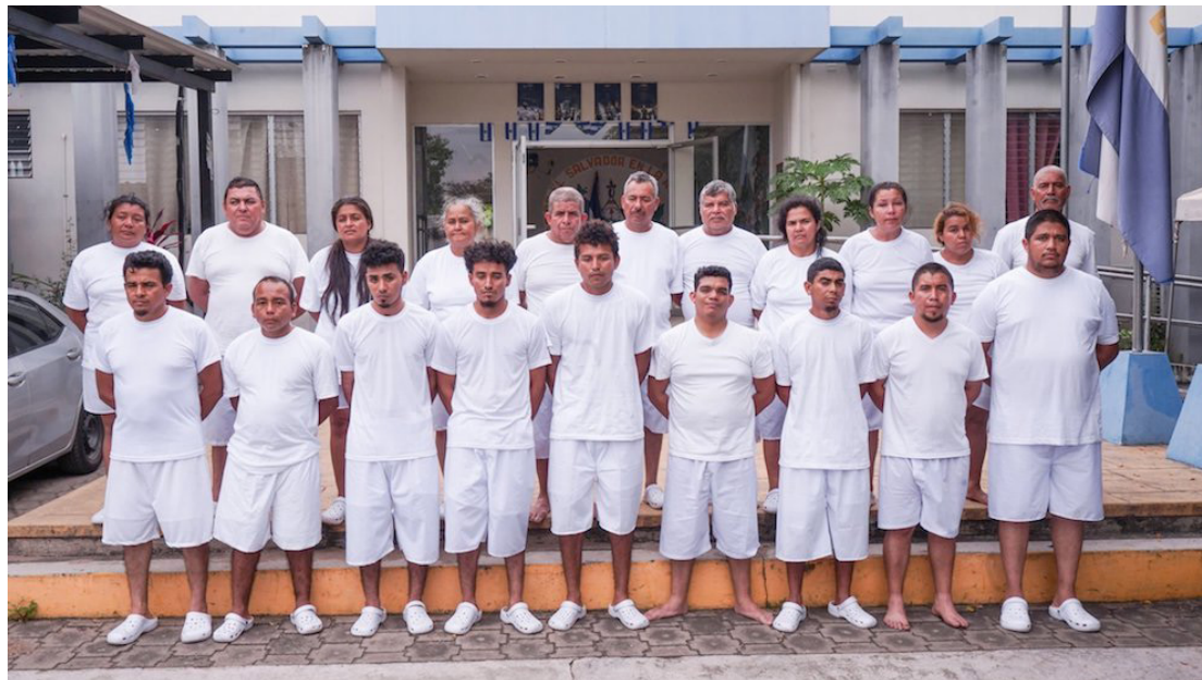
La FGR detuvo a 28 residentes de la Comunidad Hacienda La Floresta, incluida una mujer embarazada.

“Se condena estos abusos que hacen a los habitantes de la comunidad, por intereses empresariales aliados al gobierno de Bukele, como la persecución política que las autoridades están ejecutando, han capturado apro-