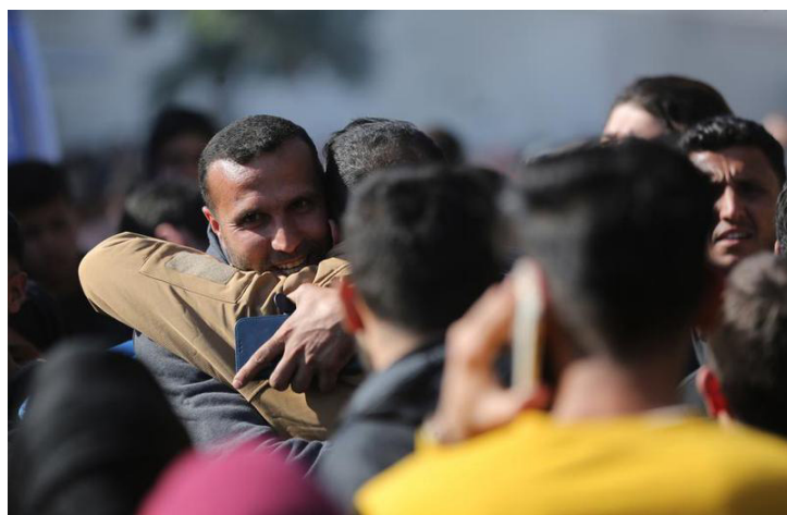
Imagen del 15 de febrero de 2025 de prisioneros palestinos liberados recibidos a su llegada, en la ciudad de Khan Younis, en el sur de la Franja de Gaza.

“El movimiento no ha recibido ninguna propuesta respecto a la segunda etapa del acuerdo de tregua, a pe-