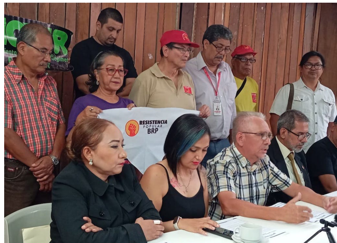
El BRP considera que las capturas y allanamientos son acciones del gobierno, para tratar de incrementar la persecución política e intimidación.

celes. El gobierno está fabricando un caso, tratando de manipular lo que ocurre en La Floresta, para dañar a referentes de la comunidad, sino además dirigentes de UNIDEC”, enfatizó Ramírez.