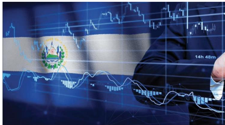
Un acuerdo alcanzado este miércoles por El Salvador con el Fondo Monetario Internacional (FMI) ampliará la deuda pública del país, estiman expertos al reaccionar al resultado alcanzado luego de varios años de negociación.

Un acuerdo alcanzado este miércoles por El Salvador con el Fondo Monetario Internacional (FMI) ampliará la deuda pública del país, estiman expertos al reaccionar al resultado alcanzado luego de varios años de negociación.