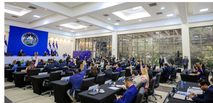
Momento en que la Asamblea Legislativa ratifica la derogatoria del Art. 210 de la Constitución para eliminar la deuda política.

Luego que el acuerdo de reforma constitucional entre en vigor, la promoción política para seleccionar a los funcionarios deberá ser autofinancia-