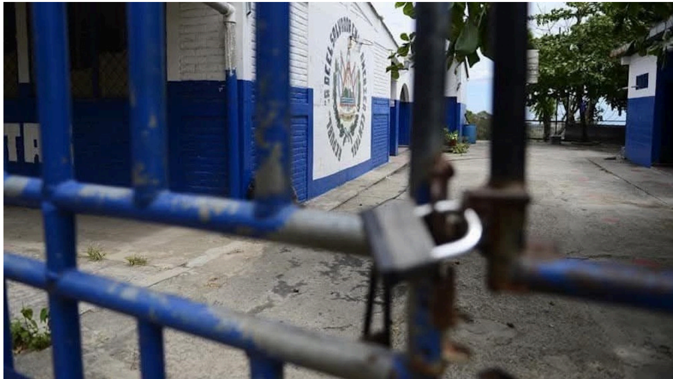
Una importante cantidad de alumnos y alumnas de distintas zonas del país, enfrentan infinidad de obstáculos como escuelas deterioradas, pocos maestros, paquetes escolares incompletos o tardanza de entrega de los nuevos uniformes y, últimamente el cierre de centros escolares.