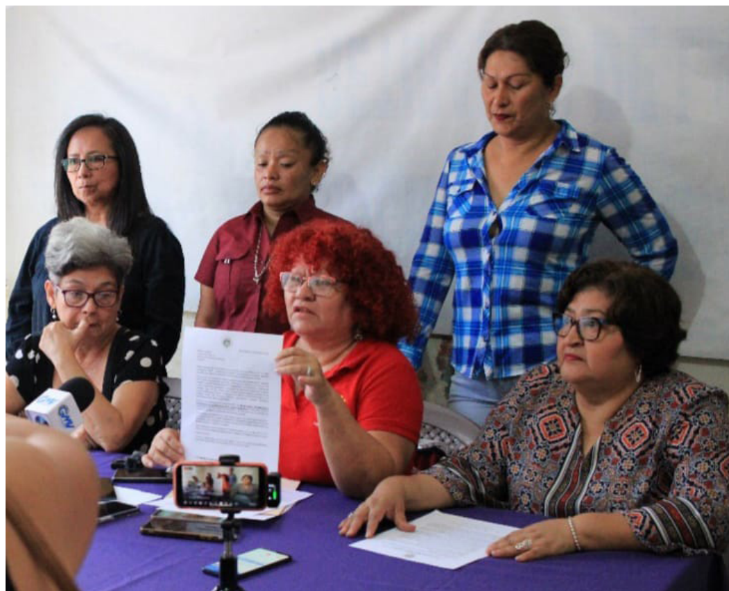
El Movimiento por la Defensa de la Clase Trabajadora indica que existe una vulneración sistémica de derechos laborales, contra las mujeres en todas las instituciones públicas.

Asimismo, consideró que el país frente a un escenario de vulneración sistémica de derechos laborales contra las mujeres en todas las ins-