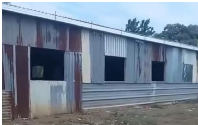
Varias familias de comunidad Hacienda La Floresta, de San Juan Opico, La Libertad, huyeron de sus viviendas debido a la presión de los cuerpos de seguridad.

Asimismo, fue detenido ilegalmente el vocero de UNIDE-