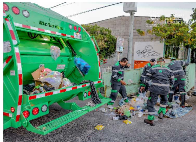
ANDRES opera únicamente en San Salvador Este: Soyapango, Ilopango, San Martín y Tonacatepeque.