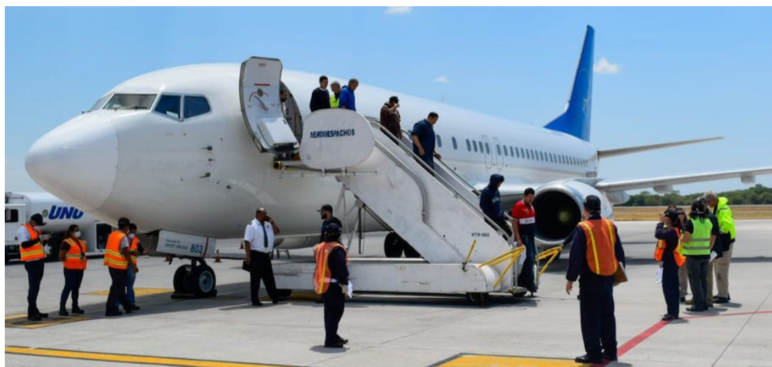
La mayoría de deportados salvadoreños provienen de los departamentos de San Miguel, San Salvador, Santa Ana y Ahuachapán. De los cuales, 15 mil migrantes son 2 mil 529 eran menores de 18 años, 700 sin ningún tipo de estudio o escolaridad y 331 solo parvularia.

En cuanto a la Dirección General de Migración y Extranjería (DGME), de El