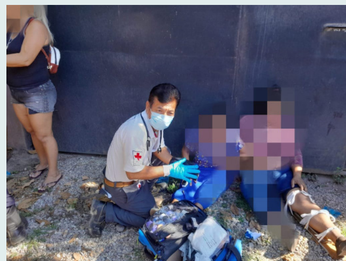
Socorristas brindan asistencia prehospitalaria en el lugar del accidente de tránsito, entre un pick up y un microbus de la ruta 109.

En el Bulevar Constitución un camión colisionó con una motocicleta que se encontraba detenida en la intersección de la calle anti-