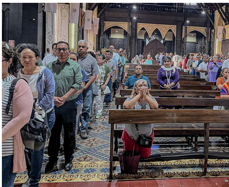
Con el Miércoles de Ceniza inicia el tiempo litúrgico de la Cuaresma, un período de preparación espiritual para la Semana Santa.

ción a la conversión, renunciar a los deseos mundanos para vivir en Cristo, es un acto público de fe donde los feligreses muestran su compromiso de cambio, representa el dolor y la tristeza por las faltas cometidas, y un llamado a regresar hacia Dios. Las palabras “Polvo eres y en polvo te convertirás”, pronunciadas por el sacerdote al momento de colocar la ceniza, es un recordatorio de la fragilidad humana y necesidad de depender de Dios. Desde el Antiguo Testamento, la ceniza se usaba como signo de penitencia y conversión.