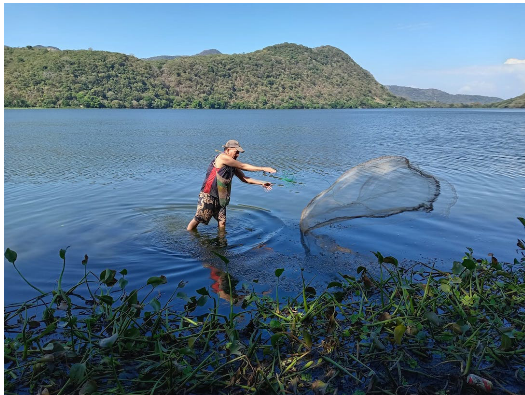
Los pobladores de Los Pajaritos, viven en su mayoría de la pesca y la agricultura que utilizan su producción para el consumo familiar.

“Para Los Pajaritos sería más de 80 metros de profundidad, para tener agua potable para abastecer alrededor de 150 familias, y, claro, también necesitamos que la alcaldía venga a llenar los tanques de captación que están vacíos y nos preocupa que se arruinen por recibir mucho sol sin tener agua y que tanta falta nos hace”, puntualizó Ávila.