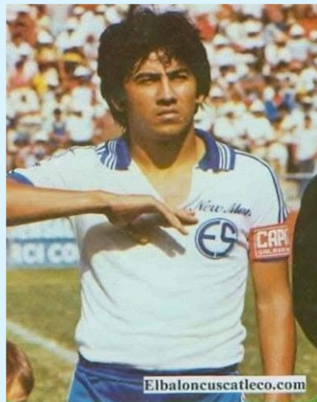
Confirman la muerte de Norberto "Pajarito Huevo", quien sufrió un derrame cerebral hace unos días y su estado de salud se complicó.

Huevo también participó presenador deportivo en los programas "Fanáticos+", del canal 21, y La Polémica del canal 4, por lo que no solo la familia futbolística, sino también de los medios están de luto.