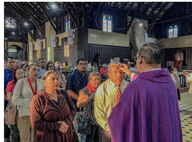
Los feligreses católicos acuden a recibir la cruz de ceniza como signo de humildad, le recuerda al cristiano su origen y fin.