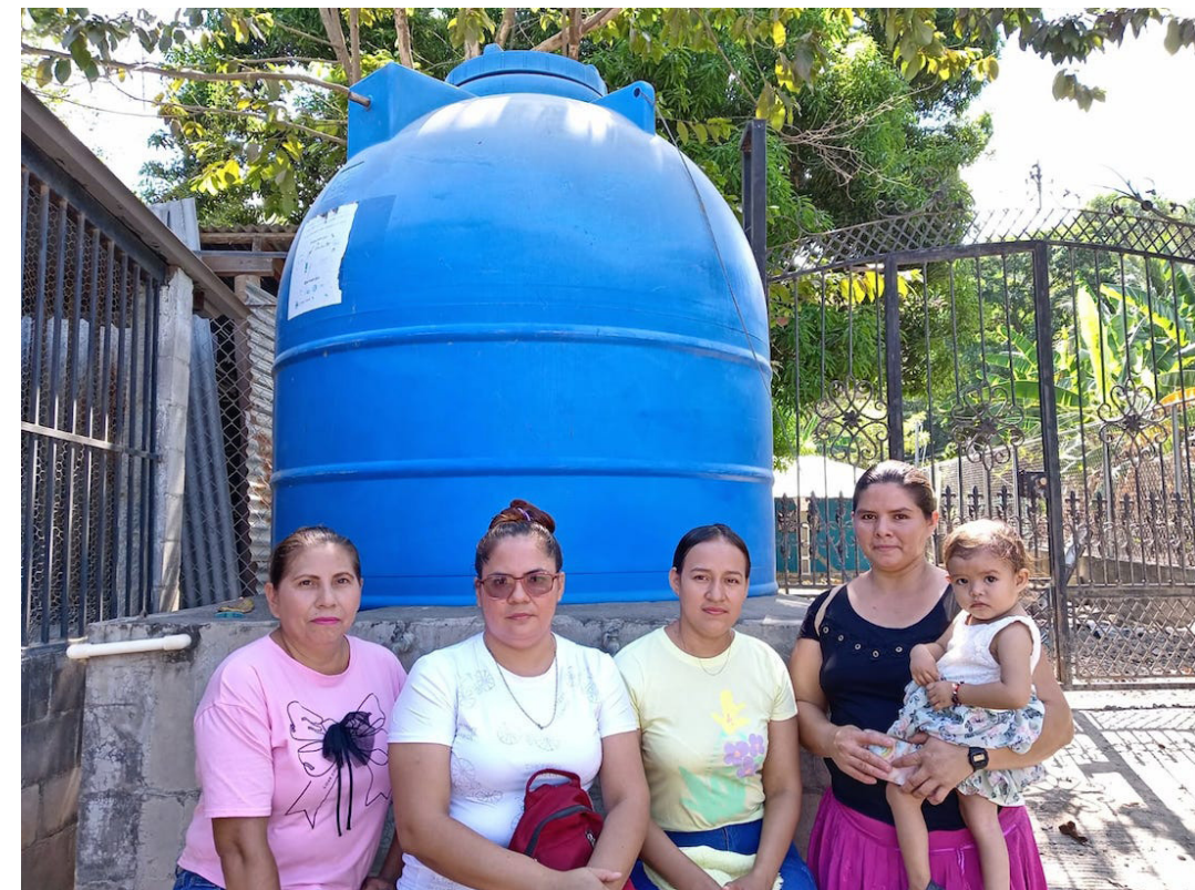
PROVIDA, trabaja con la comunidad Los Pajaritos, cuenta con tanques de almacenamiento de agua. No obstante, falta que la alcaldía desde el distrito de Chirilagua, las esté constantemente llenando.