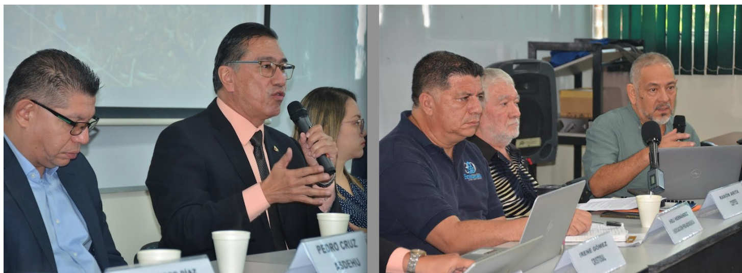
Organizaciones de derechos humanos que integran a la Mesa Contra la Impunidad en El Salvador (MECIES) presentan casos emblemáticos del pasado conflicto armado que tienen como denominador común la impunidad institucionalizada.