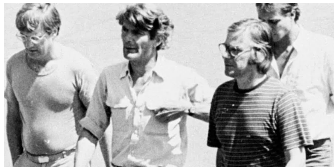
El crimen contra los periodistas holandeses se habría efectuado el 17 de marzo de 1982 en Chalatenango.