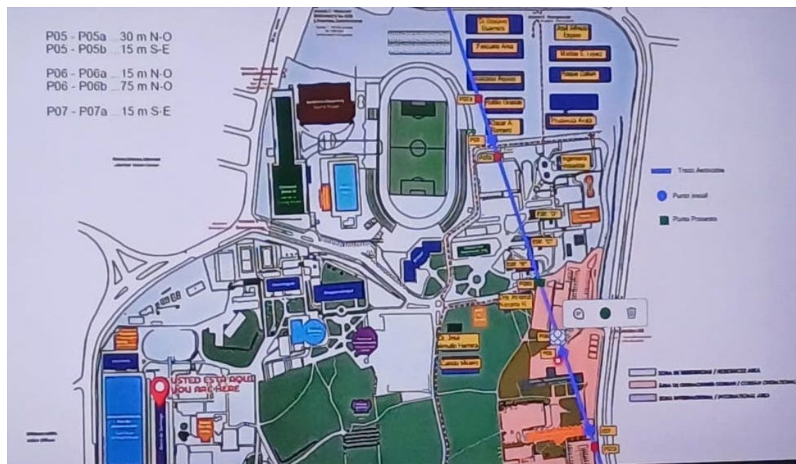
El Consejo Superior Universitario de la UES denegó por segunda vez al MOP, la construcción de al menos tres torres que afectan la infraestructura.

“La votación fue unánime 29 votos de los que estábamos en sesión, ningún voto en abstención y ningún voto en contra, la posición del organismo es que todos los argumentos que fundamentaron el acuerdo anterior se mantienen, la posición es seguir denegando la solicitud, rechazándola por