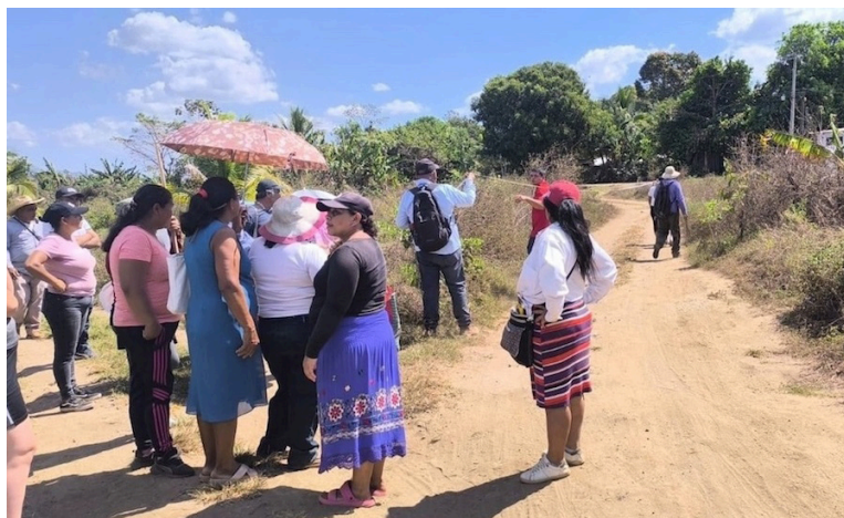
UNIDEHC considera que las capturas arbitrarias y la persecución de la FGR en el caso La Floresta, es un ejemplo que al gobierno le molesta la defensa de los derechos de la población.

Según la organización, hoy más que nunca en diferentes reuniones y gestiones a escala internacional continuarán las acciones de protección a los defensores de derechos humanos en El