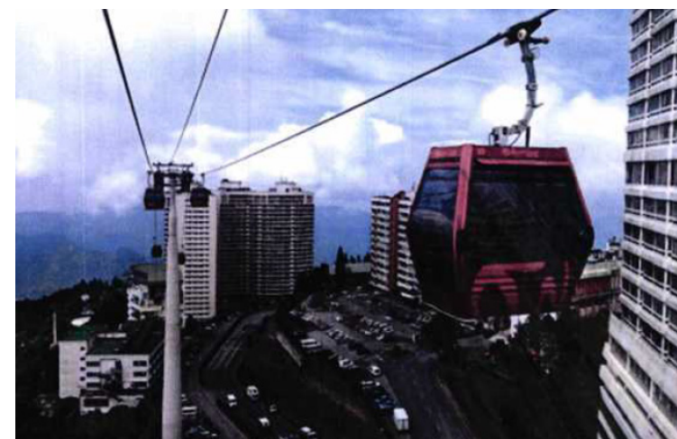
El metrocable tendría un impacto en los estudiantes porque las góndolas pasarían sobre los edificios de las facultades de Ingeniería y Ciencias Agronómicas.

La alternativa dada por el CSU es que construyan esa ruta o línea de paso del metrocable en la calle Diagonal Universitaria, y bordee el campus del Alma Mater.