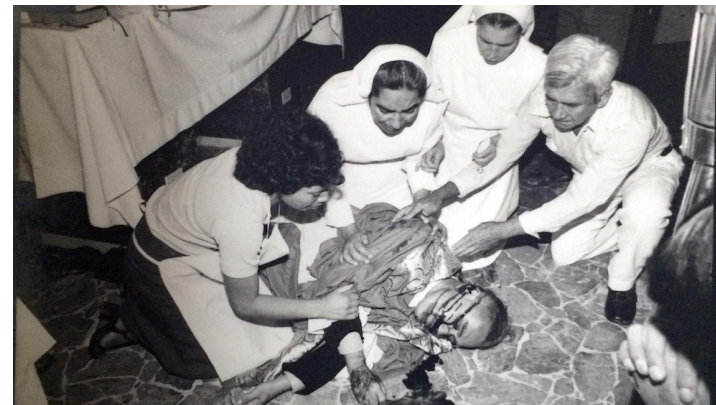
Tutela Legal “Dra. María Julia Hernández”, señala que en el Caso de Monseñor Oscar Arnulfo Romero, han existido obstáculos en el proceso judicial, sin llegar a la justicia.