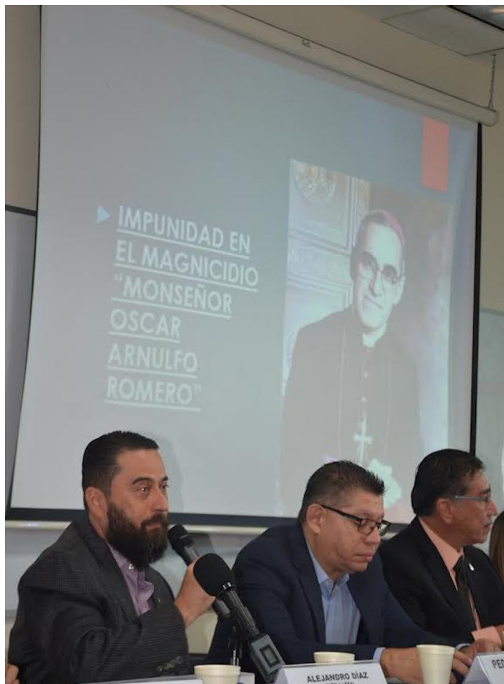
La Corte Suprema de Justicia obstaculiza el proceso de extradición de Álvaro Saravia, uno de los testigos clave, en el caso de la muerte de Monseñor Romero, hoy San Romero, ya que con la Amnistía (1993) el caso fue archivado.

“El caso sigue estancado, y aunque se ordenó la captura de Álvaro Saravia en 2018 lamentablemente este caso fue dividido por el juez de la causa que sigue en el Juzgado 4to de Instrucción, pero se pide a la Fiscalía ampliar esta investigación”