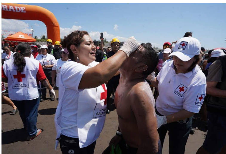
Socorristas brindan atención prehospitalaria a nadadores que deciden aceptar el desafío de 21 kilómetros.

Asimismo, filiales como Comité de Damas Voluntarias y Cruz Roja de la Juventud fueron elementos clave para llevar a cabo el evento. La 59ª edición del Paso del Hombre coincide con el 140º aniversario de la fundación de Cruz Roja Salvadoreña.