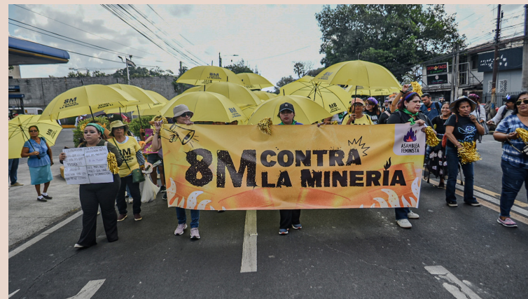
FESPAD plantea que aún existen grandes desafíos como la violencia de género, la desaparición de mujeres, la discriminación, la falta de acceso a recursos y oportunidades, “siguen siendo realidades que deben ser transformadas”.

También, instó especialmente a la Policía Nacional y Fiscalía General de la República, a que atiendan los casos de mujeres desaparecidas libres de estigmatización y revictimización. “Como FESPAD reconocemos el invaluable papel de las mujeres en El Salvador, así como la labor de las organizaciones de mujeres, por lo que invitamos a toda la población a reflexionar sobre el papel esencial que desempeñan las mujeres en nuestras vidas y a actuar con respeto, apoyo y compromiso en la construcción de un futuro en el que todas las mujeres puedan vivir libres de violencia y discriminación”, finalizó FESPAD.