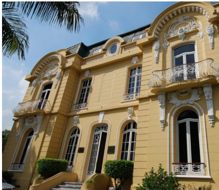
La Casa Dueñas será intervenida para realizarle mejoras, según las autoridades.

Suecy Callejas, diputada de Nuevas Ideas, explicó que dicha casa "no cuenta con las condiciones necesarias" para trabajar y que, al contrario, genera un peligro latente para sus usuarios. Informó que la inversión para arreglar se es-