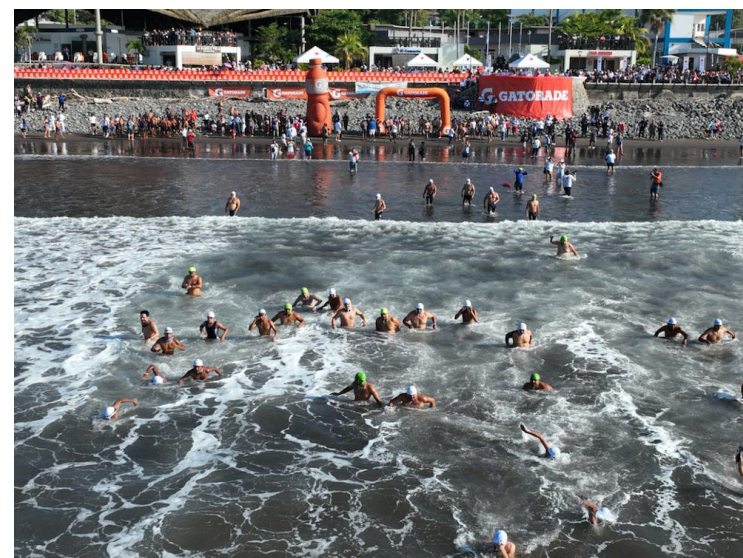
Rescatistas de Cruz Roja Salvadoreña, con el apoyo de la Fuerza Área y Marina Nacional, participan en “el Paso del Hombre 2025” desarrollado en las playas de La Libertad.

Cruz Roja Salvadoreña destacó la tradicional participación de representantes de Cruz Roja Hondureña, lo que “refuerza la hermandad entre naciones en esta competencia de gran tradición”, afirmaron representantes de CRS. Además, el evento es único en la