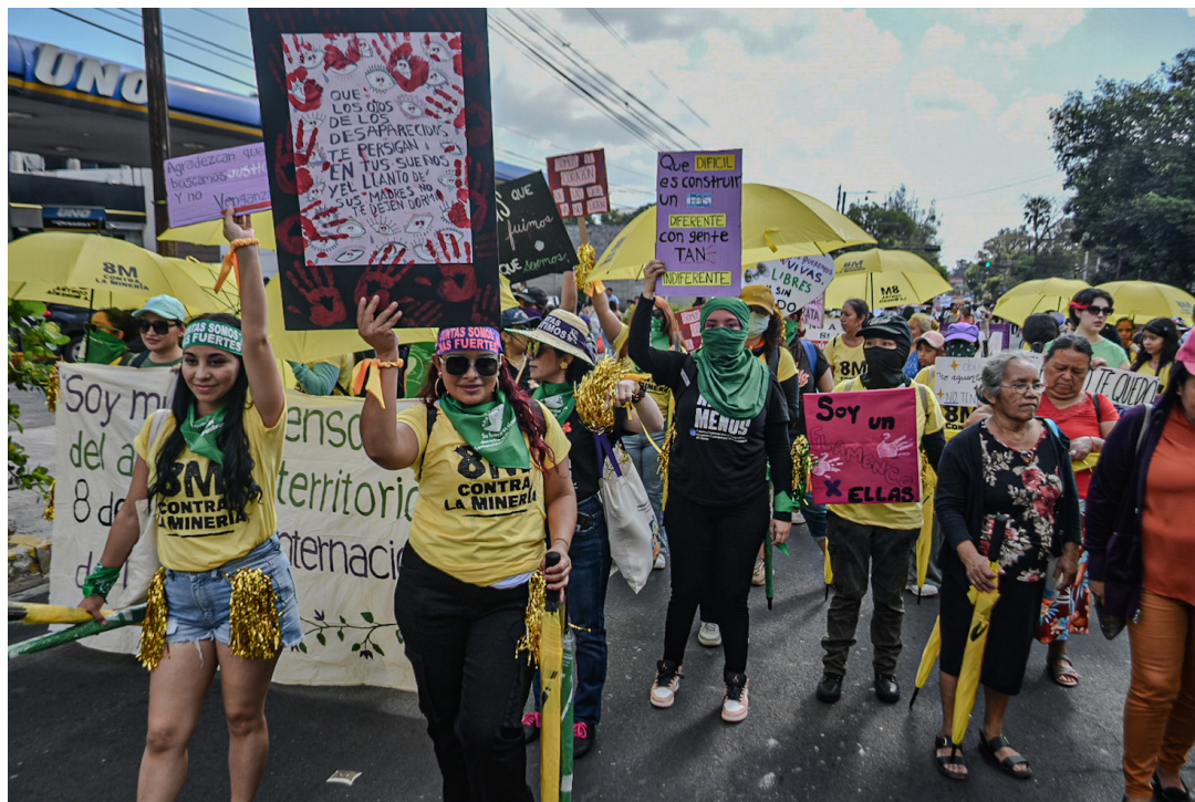
Miles de mujeres salen a marchar en este 8 de Marzo, Día Internacional del Mujer, para exigir al estado el respeto de derechos y el no retroceso de estos.