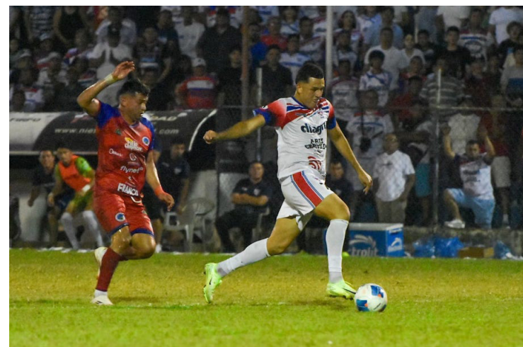
Firpo empata 1-1 con Cacahuatique en el cierre de la primera vuelta del Clausura 2025.

La tabla finalizó de la siguiente manera: Firpo (23), Alianza (19), Metapán (19),