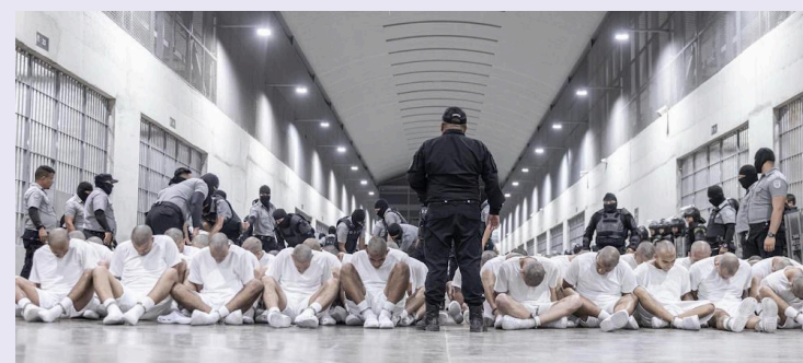
El BRP denuncia que de los 238 supuestos miembros del Tren de Aragua, muchos han sido privados de libertad sin pruebas contundentes que demuestren su participación en el grupo delictivo.

“Expresamos nuestra solidaridad con las familias venezolanas y de otros países cuyos seres queridos han sido arrestados de manera arbitraria acusados de delitos que no han cometido, tal como se demuestra en procesos judiciales pendien-