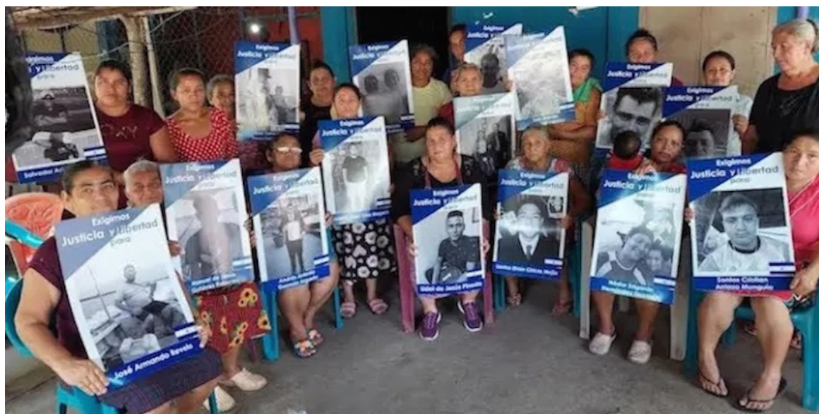
Familiares de los lancheros de la Isla Espiritu Santo demandan de la Jueza número 3 del Tribunal Primero Contra el Crimen Organizado en San Miguel, escuchar las declaraciones de descargo de sus seres queridos.