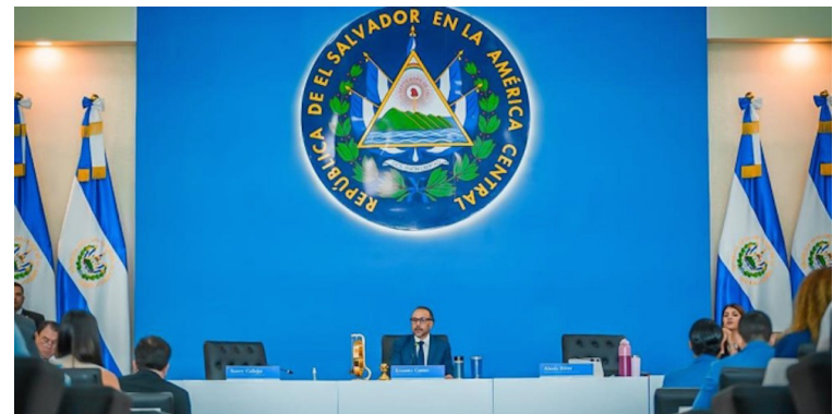
Asamblea Legislativa reforma presupuesto 2025 para incorporar recursos al MAG, MOP y Gobernación.