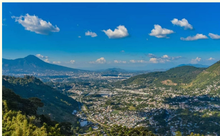
La DOT es la entidad competente para otorgar autorizaciones y permisos de construcción, referidos a lotificaciones nuevas, obras, actividades y proyectos de urbanización.