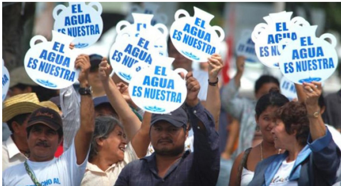
En El Salvador las organizaciones han salido a las calles demandando que el agua sea un bien y se resuelvan las diferentes problemáticas que se enfrentan entre éstas la carestía del vital líquido.

López opinó que las “Juntas de Agua Comunitarias” son las más grandes afectadas en la implementación de la Ley General de Recursos Hídricos (LGRH), y la falta de mecanismos de la Autoridad Salvadoreña del Agua, para inscribirse por el uso del agua que hacen para abastecer a poblaciones rurales o vulnerables que no cuentan con un servicio de agua domiciliar y alcantarillado. “La ASA no ha podido habilitar un proceso a las Juntas de Agua, para poder regu-