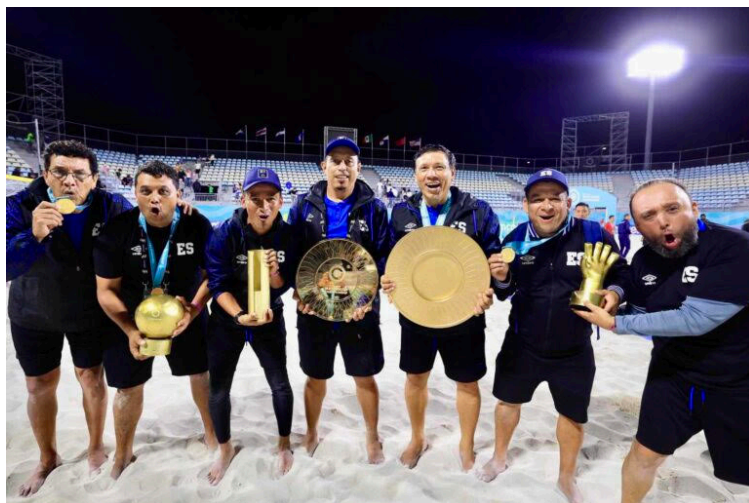
Cuerpo técnico de la selección de fútbol playa tras ganar el Premundial de CONCACAF.

La Selecta Playera clasificó por sexta ocasión a una Copa