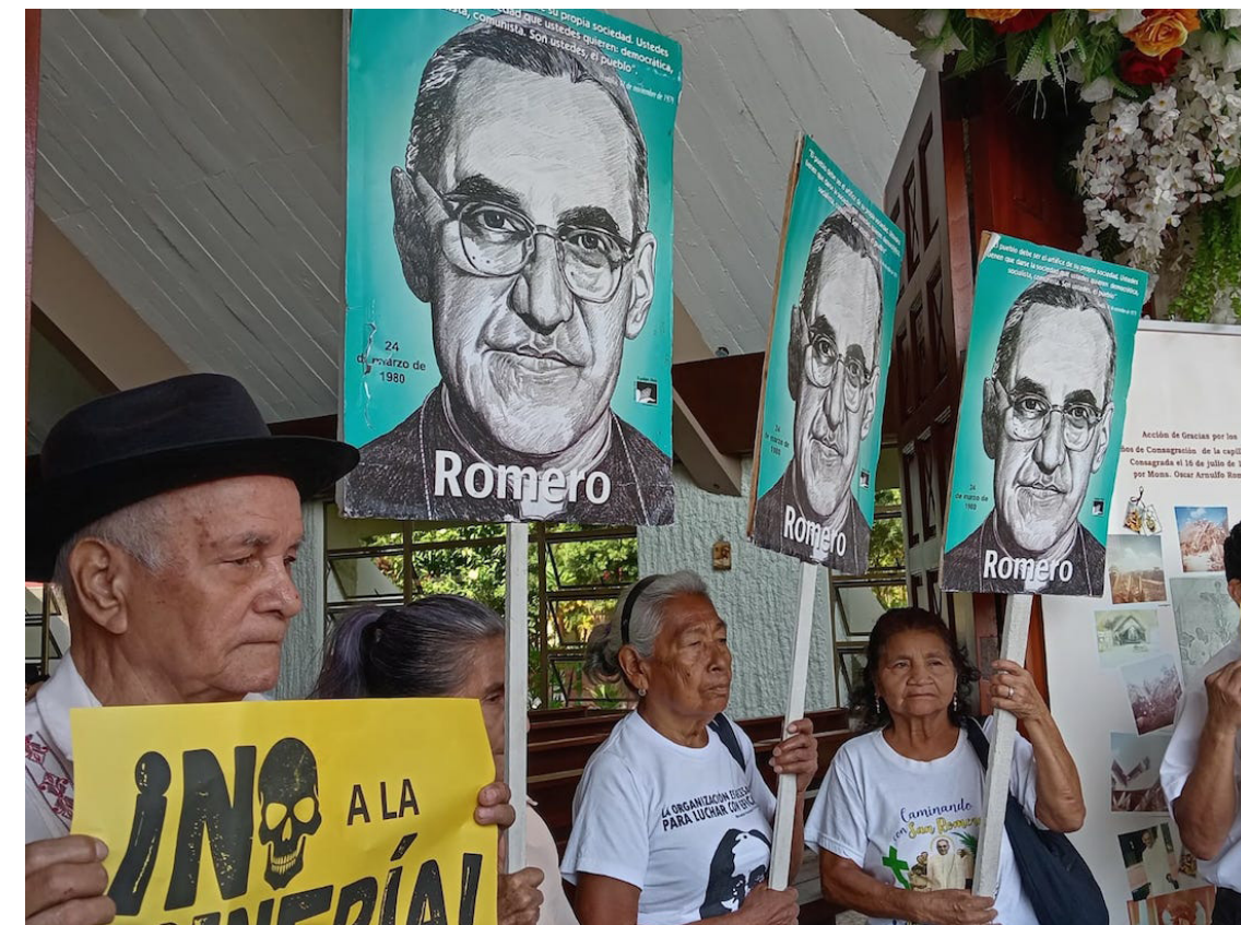
El Comité Nacional Monseñor Romero anuncia las actividades en torno a la conmemoración del 45 Aniversario Martirial de san Oscar Arnulfo Romero, el próximo 24 de marzo.

El Comité Nacional Monseñor Romero reconoció a la Conferencia Episcopal por haber presentado “150 mil firmas” recogidas en las 500 iglesias a escala nacional, con el fin de solicitar a la Asam-