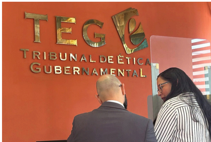
Cristosal presenta al Tribunal de Ética Gubernamental (TEG) una denuncia, por presuntas irregularidades en la compra de insumos durante la pandemia del COVID-19.

nuncia, a sumar una más, porque no es la primera, el 13 de noviembre presentamos sin el acompañamiento de la prensa una denuncia contra el ministro Francisco Alabi, por haber favorecido a sus familiares, aportamos pruebas y además les dijimos al Tribunal de Ética los mecanismos para obtener y cuáles podrían ser las diligencias para obtener