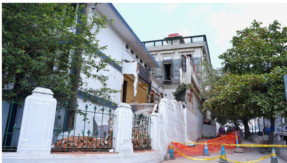
El ministro de salud defendió el desmantelamiento de la infraestructura del antiguo hospital ya que estaba "deteriorada y representaban un peligro para las personas".