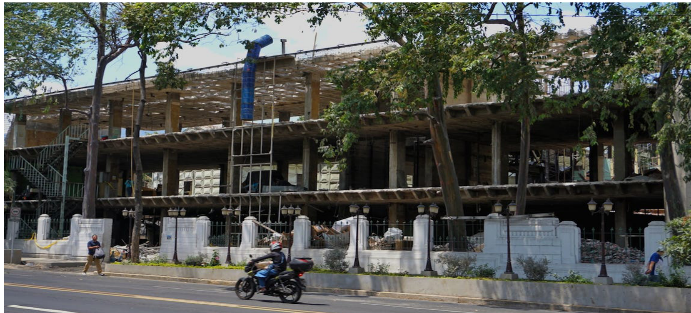
El Hospital Rosales es parte del conjunto histórico de la Colonia Flor Blanca, además del estadio Jorge "Mágico" González y el parque Cuscatlán.

Hasta la fecha, no se han presentado estudios técnicos que respalden la intervención en la estructura histórica. Dinarte advirtió que el área donde actualmente se encuentra la capilla del hospital será transformada en un parqueo, lo que ha generado más inquietudes sobre la preservación del legado arquitectónico del Hospital Rosales.