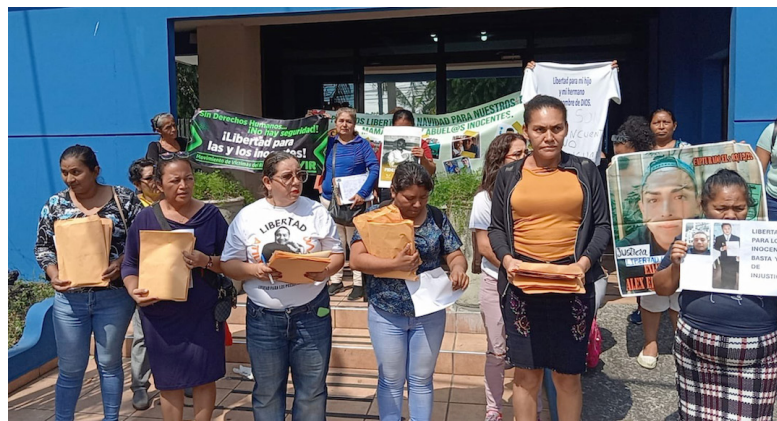
Movimiento de víctimas del régimen de excepción piden a la PDDH que intervenga para que sus cartas puedan ser entregadas a sus seres queridos.

En su implementación se han efectuado capturas arbitrarias, de