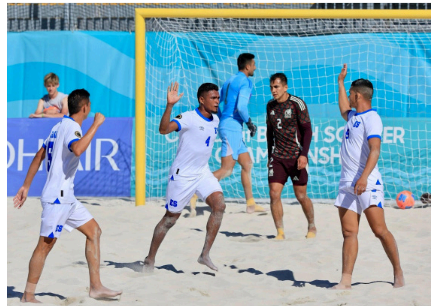
Selecta de playa elimina a México del Premundial de CONCACAF tras el 7-6 en Bahamas.

En su camino a conseguir el boleto a las semifinales, la azul y blanco arrancó con el 6-1 ante Costa Rica en el debut, el 7-0 contra Guatemala y ahora el 7-6