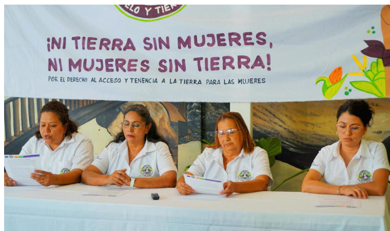
El acceso a la vivienda digna y a la tierra se ha vuelto más difícil para las mujeres, especialmente en áreas rurales, indica la MMST.

Durante 2024, la Fiscalía General de la República (FGR) reportó un aumento significativo en denuncias de violencia física, sexual, psicológica y feminicida. Tan solo en 2022 se reportaron 71 asesinatos de mujeres.