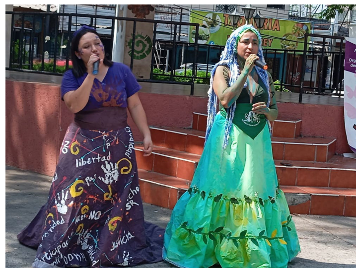
A través de su música, el dueto Obsidiana Raíz expresa la violencia que viven las mujeres.