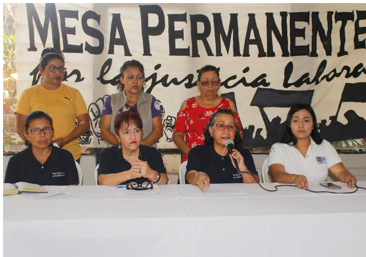
La Mesa Permanente por la Justicia Laboral denuncia el despido, hostigamiento, acoso, así como otras vulneraciones que siguen viviendo las mujeres trabajadoras.

La Mesa Permanente por la Justicia Laboral, conformada por diversas organizaciones sindicales, en el marco del Día Internacional de la Mujer sostuvo que la fecha no solo es para recordar las luchas históricas por la igualdad de derechos de las mujeres, sino, también, reafirma “el compromiso con la construcción de un mundo laboral más justo y equitativo”. A juicio de la Mesa, “es un momento para reconocer la lucha de las mujeres en todo el mundo por sus derechos, especialmente en el ámbito laboral”.