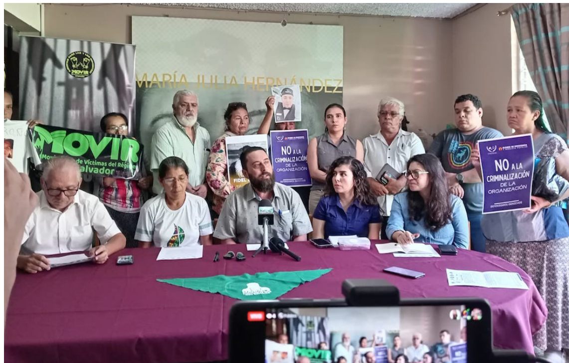
Diversas organizaciones defensoras de derechos humanos como Tutela Legal “Dra. María Julia Hernández”, MOVIR, Mesa por el Derecho a Defender Derechos, Asociación Febe Elizabeth, CDHES, Pro Memoria Histórica de El Salvador, IDHUCA, SSPAS, FESPAD y CRISTOSAL denunciaron la escalada de violencia contra el movimiento social y las comunidades organizadas.