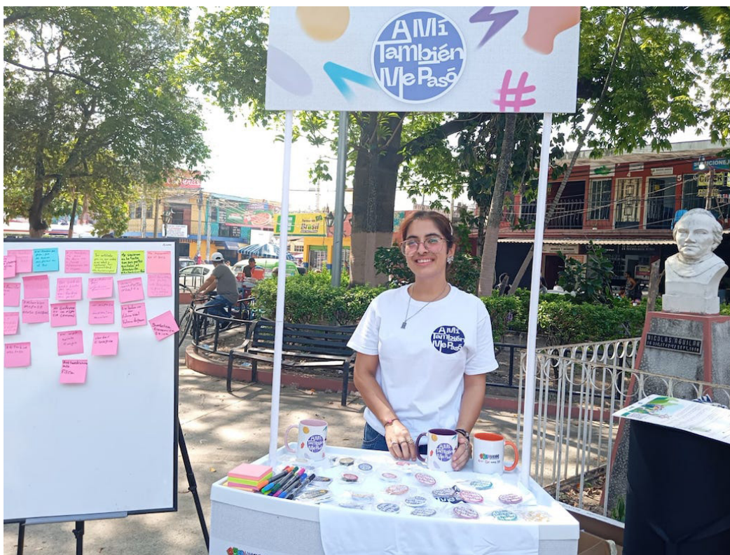
Con la campaña “A mí también me pasó” se busca crear conciencia sobre la violencia hacia mujeres, juventudes y personas sexo género disidentes.