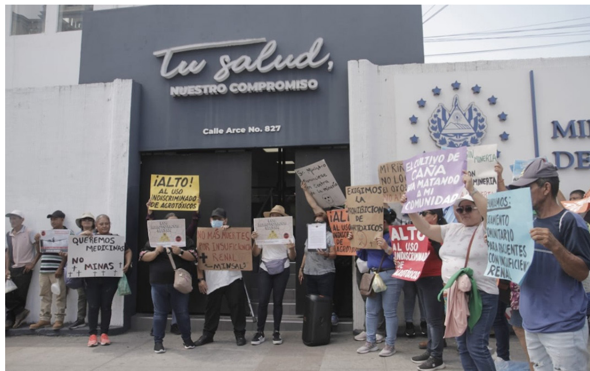
En el marco del “Día Mundial del Riñón”, la Campaña Azúcar Amarga entrega una carta al ministro de Salud, Francis Alabi, para demandar una atención integral de las personas que viven con insuficiencia renal, provocada por los tóxicos del cultivo de la caña de azúcar.

Y esta reiterada práctica de quemas termina dejando el suelo “impermeabilizado”, lo que provoca que esa tierra de cultivo pierda su fertilidad. Luego