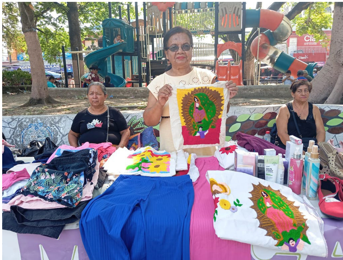
Las mujeres de Aguilares dieron a conocer sus emprendimientos, que les ha permitido independencia económica.

Datos del Centro de Atención Elda Ramos, de la Colectiva Feminista, indican que más del 56% de las personas atendidas han sufrido violencia psicológica, y un porcentaje significativo ha vivido múltiples formas de violencia, incluidas la física y sexual.