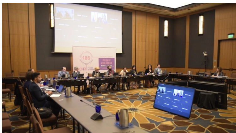
La Comisión Interamericana de Derechos Humanos (CIDH) anuncia en su página oficial que está recibiendo las solicitudes para las “Audiencias Públicas” que corresponden al período 193 de sus sesiones.

La CIDH es el órgano principal y autónomo de la Organización de Estados Americanos (OEA), cuyo mandato proviene de la “Carta de la OEA” y de