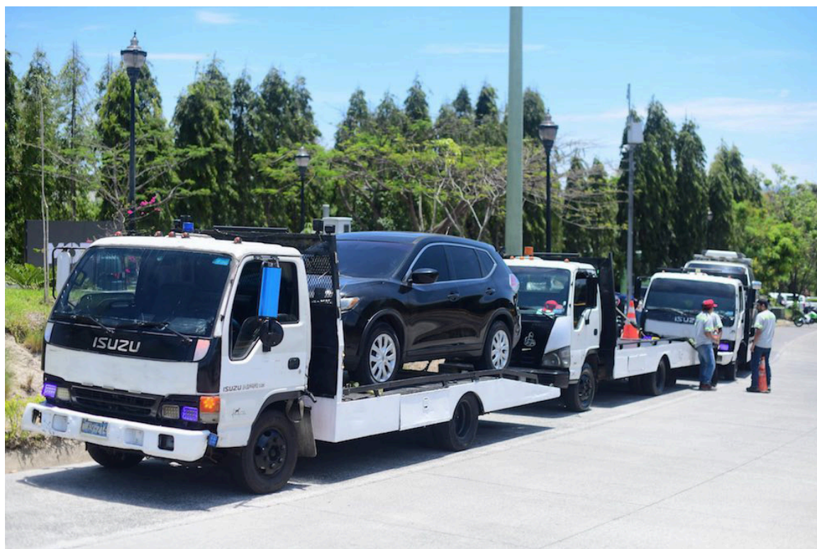
Como parte del plan Seguridad Vial, el VMT y MOP implementarán en las vacaciones de Semana Santa, controles vehiculares, antidopaje, y el servicio de grúas MOP Te Asiste.

“Nos vamos a concentrar en la concientización,