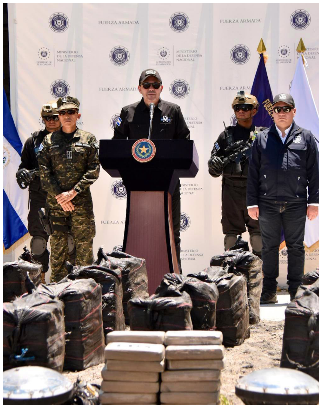
De izquierda a derecha ministro de Defensa, Merino Monroy, ministro de Seguridad, Gustavo Villatoro, y el fiscal general de la República, Rodolfo Delgado

El ministro de seguridad, Gustavo Villatoro, indicó que “todos los capturados serán