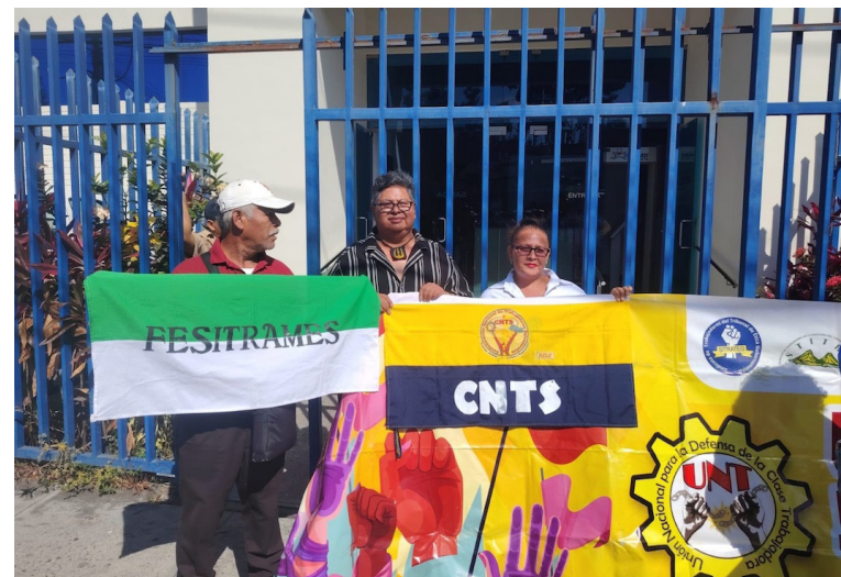
El sindicato de ISDEMU denuncia a las autoridades de la institución por los delitos de discriminación laboral, coacción al ejercicio de la libertad sindical y de asociación.