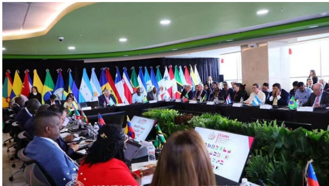
La CELAC llama a concertar intervenciones conjuntas en los foros multilaterales en temas de interés común.

Los temas de movilidad humana, economía, medio ambiente y cambio climático