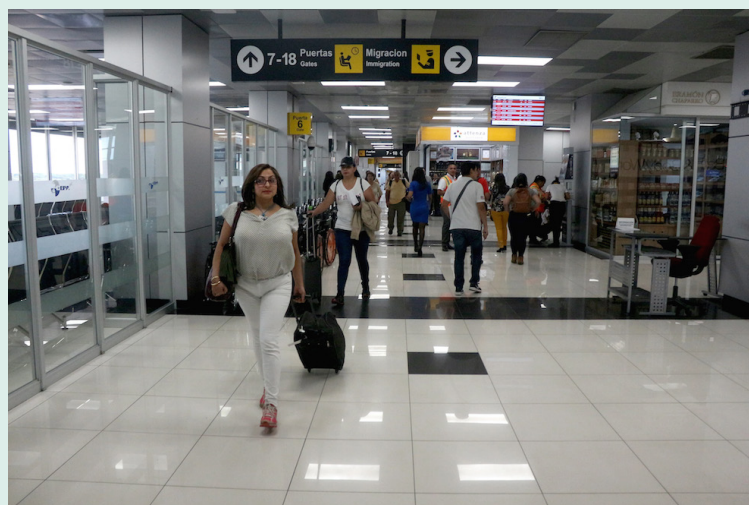
Estados Unidos mejora la altera de viaje para El Salvador dejando el nivel 1.

Bukele, por su parte, reaccionó a la noticia en su cuenta oficial de X; “El Salvador acaba de recibir la estrella dorada de viajes del Departamento de Estado de