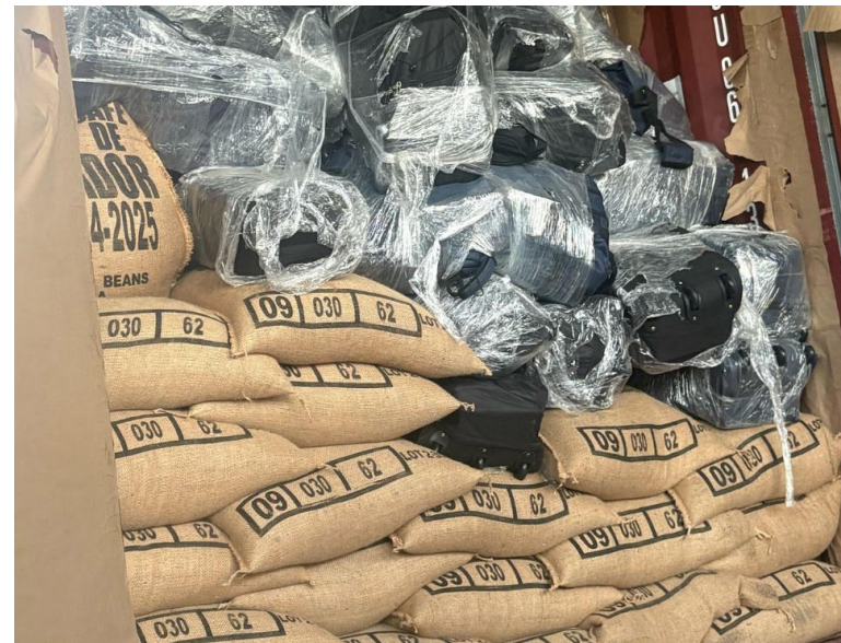
Autoridades de Panamá incautaron un cargamento de droga procedente de El Salvador.

Sobre la droga incautada en Panamá, el presidente de la República, Nayib Bukele no se ha pronunciado, tampoco sus funcionarios; por el contrario, Bukele informó sobre una propuesta que envió al Consejo Nacional de Salario Mínimo, para incrementar el salario mínimo en un 12%; esto fue catalogado por la opinión pública como “corti-