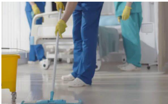
Debido a la reducción del 50% del personal privado para la limpieza en los hospitales del ISSS, los auxiliares de servicio deberán asumir esas áreas de trabajo.

bajo del auxiliar de servicio se encuentra que ellos pueden colaborar en el área de limpieza general, la administración lo ha tomado, pero esto va generar más sobrecarga de trabajo en las áreas auxiliares”, indicó Aguirre.