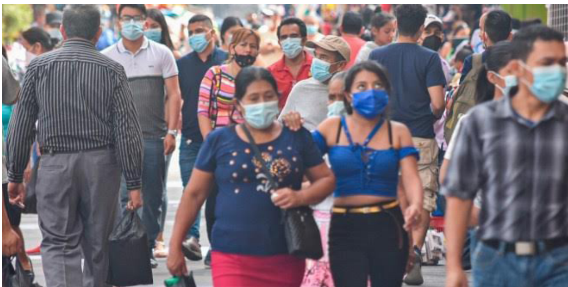
El salario mínimo sería aumentado en un 12%, según lo anunció el presidente de la República, Nayib Bukele.