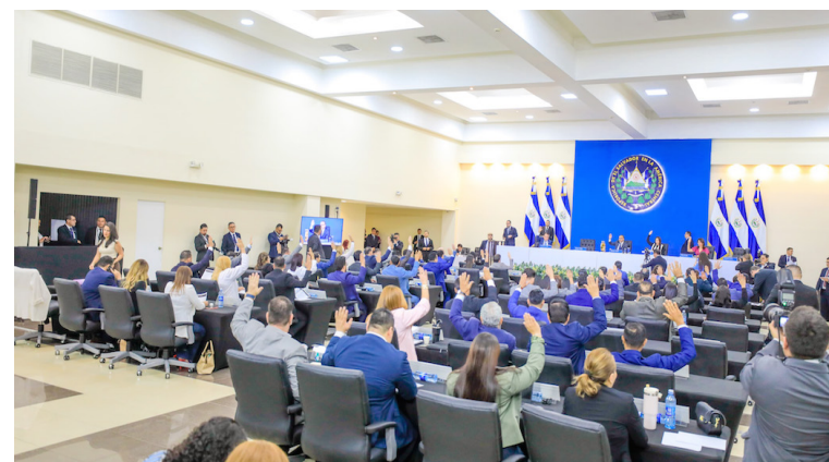
La ley fue aprobada con 60 votos a favor en la plenaria de esta semana.

fitosanitarias dentro del territorio nacional para el ingreso y movilización interna de vegetales, productos y subproductos de origen vegetal, alimentos no procesados de origen vegetal, productos biotecnológicos en su origen vegetal y de otros artículos reglamentados.