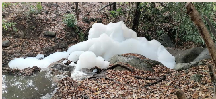
Habitantes aledaños al CECOT, Tecoluca, San Vicente, denunciaron que en los últimos días ha incrementado la espuma en el río Los Obrajes.

El habitante dijo que, de acuerdo a estudios, en el lugar