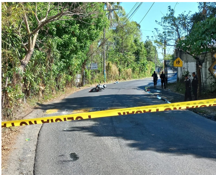
Seis homicidios en el mes de abril se han registrado según cifras oficiales de la PNC.