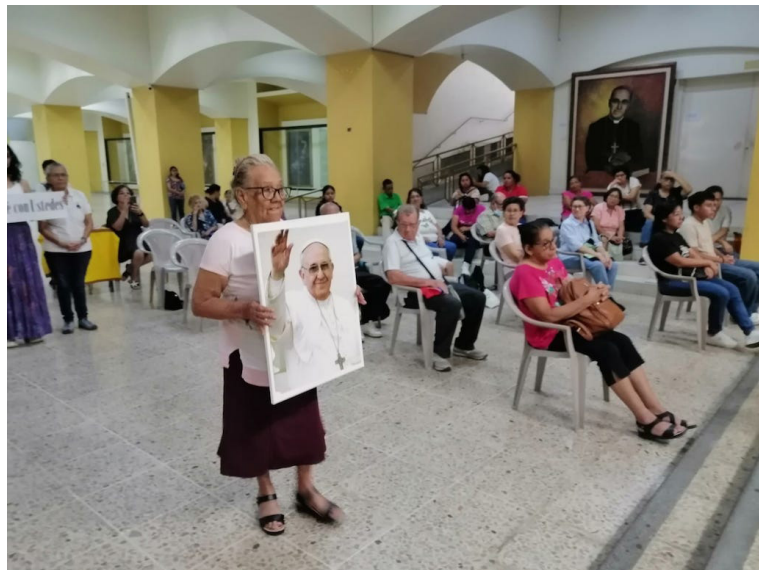
En la Cripta de Catedral Metropolitana de San Salvador se recuerda el legado del papa Francisco porque abogó por los pobres, tal como Monseñor Romero.

La causa de muerte del papa Francisco fue debido a un ictus cerebral, que derivó