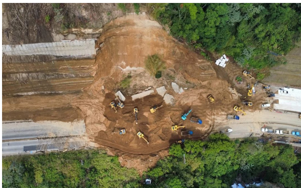
Vista aérea del desprendimiento en la carretera Panamericana a la altura de Los Chorros, que dejó inhabilitadas ambas vías este fin de semana.