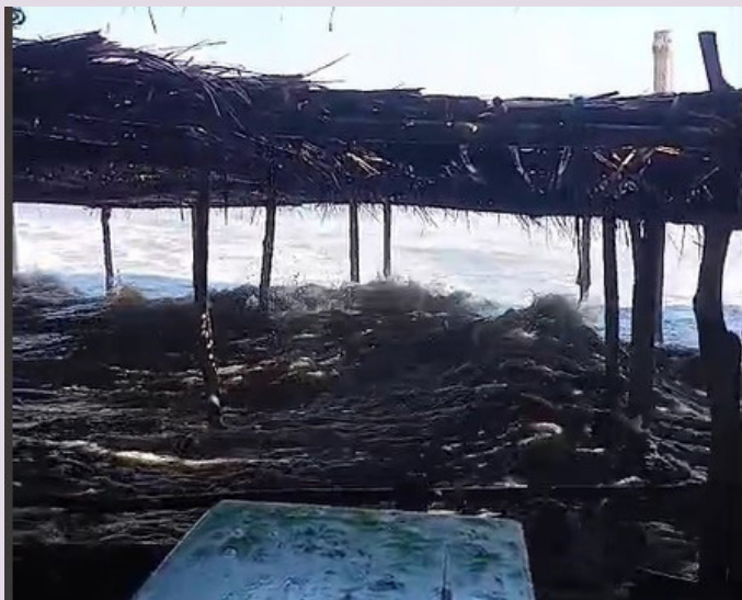
Las mareas vivas estarán presentes hasta el 30 de abril, según el MARN, por lo que las costas salvadoreñas se estarán monitoreando.

La Unidad de Guardavidas de Protección Civil brindó asistencia a turistas que se vieron afectados por el alto oleaje registrado en las últimas horas en la Playa Garita Palmera, distrito de San Francisco Menéndez, Ahuachapán Sur. “Nos mantenemos monitoreando para reaccionar oportunamente ante cualquier emergencia acuática que pueda presentarse”, dijo la institución. El MARN explica que la marea baja puede arrastrar y la alta podría causar algunas inundaciones, por lo que recomiendan a los turistas y habitantes de la zona a tener precaución. Según el Ministerio, el rango de aumento de las olas será de 2.5 metros en Acajutla, 2.6 metros en las costas de La Libertad, 3.2 metros para El Triunfo y 3.2 metros en la zona de La Unión, por encima del rango promedio.