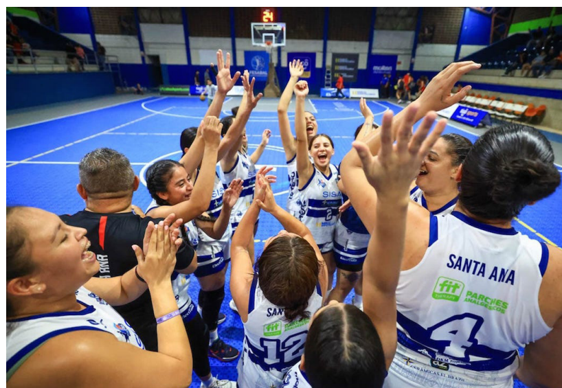
Santa Ana derrota 66-61 a Liga Municipal Monseñor Romero y se convierte en el último clasificado a las semifinales de la Liga de Baloncesto.

En semifinales, Santa Ana se medirá ante San Salvador, mientras que en la otra serie será entre Salvadoreñas vs PSN.