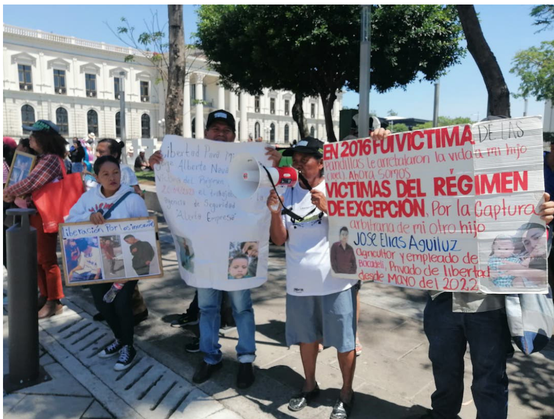
MOVIR y familiares de víctimas del régimen de excepción se manifiestan frente a la BINAES y exigen al Gobierno que libere a los detenidos injustamente. Luego de tenerlos encerrados incluso por más de 3 años.

“Nosotros le decimos al gobierno que nosotros no andamos defendiendo pandilleros, mareros, delincuentes, no andamos defendiendo extorsionistas, nosotros defendemos personas inocentes, gente trabajadora, hijos de personas que no tienen nada que