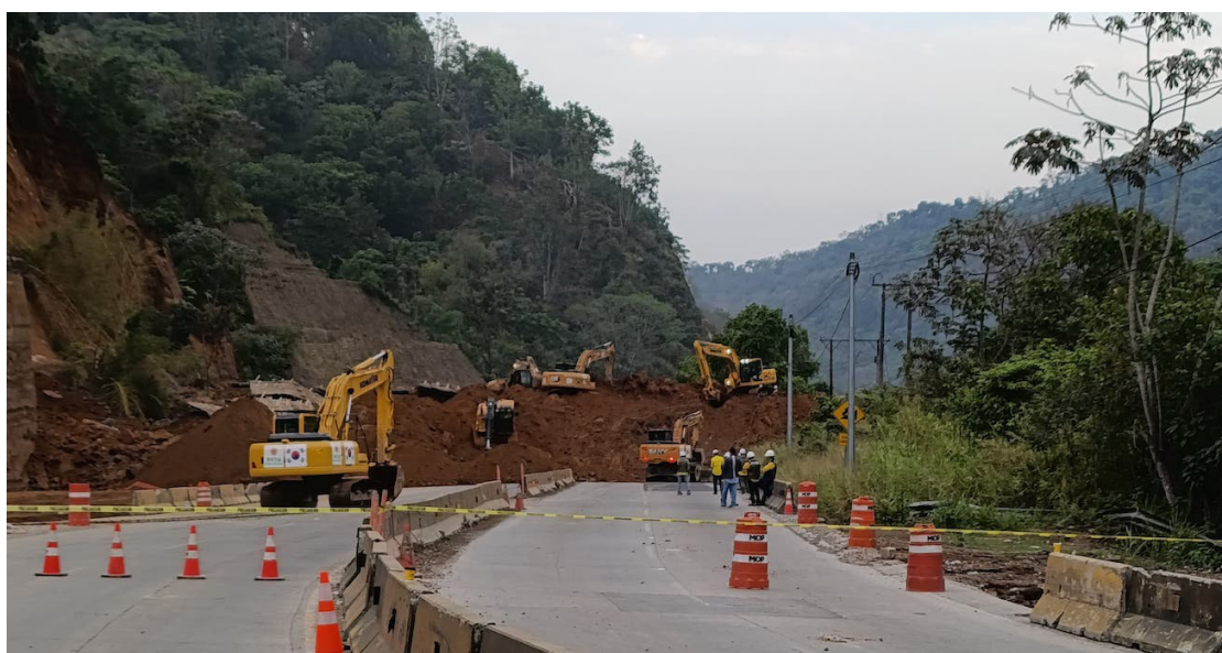
El Ministerio de Obras Públicas (MOP) trabaja en la remoción del deslizamiento ocurrido este fin de semana en carretera Panamericana a la altura de Los Chorros.