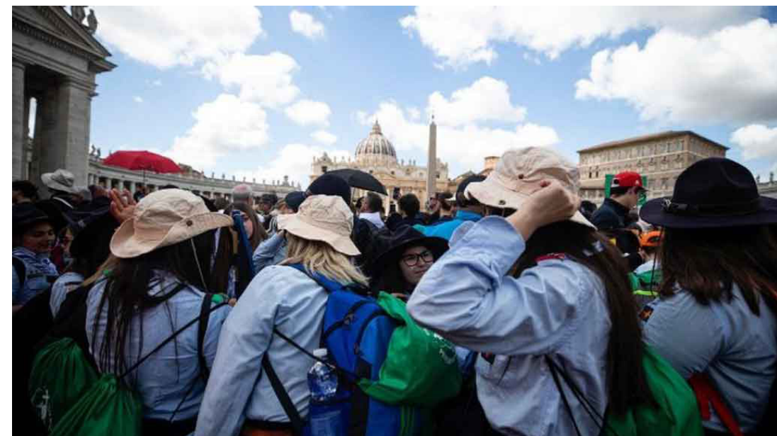
Ciudad del Vaticano/Prensa Latina

Una misa en homenaje al papa Francisco se efectuó la mañana del domingo, como parte del segundo de los Novendiali, nueve días de luto tras su muerte, coincidente con el Jubileo de los adolescentes que culminó el domingo en el Vaticano.