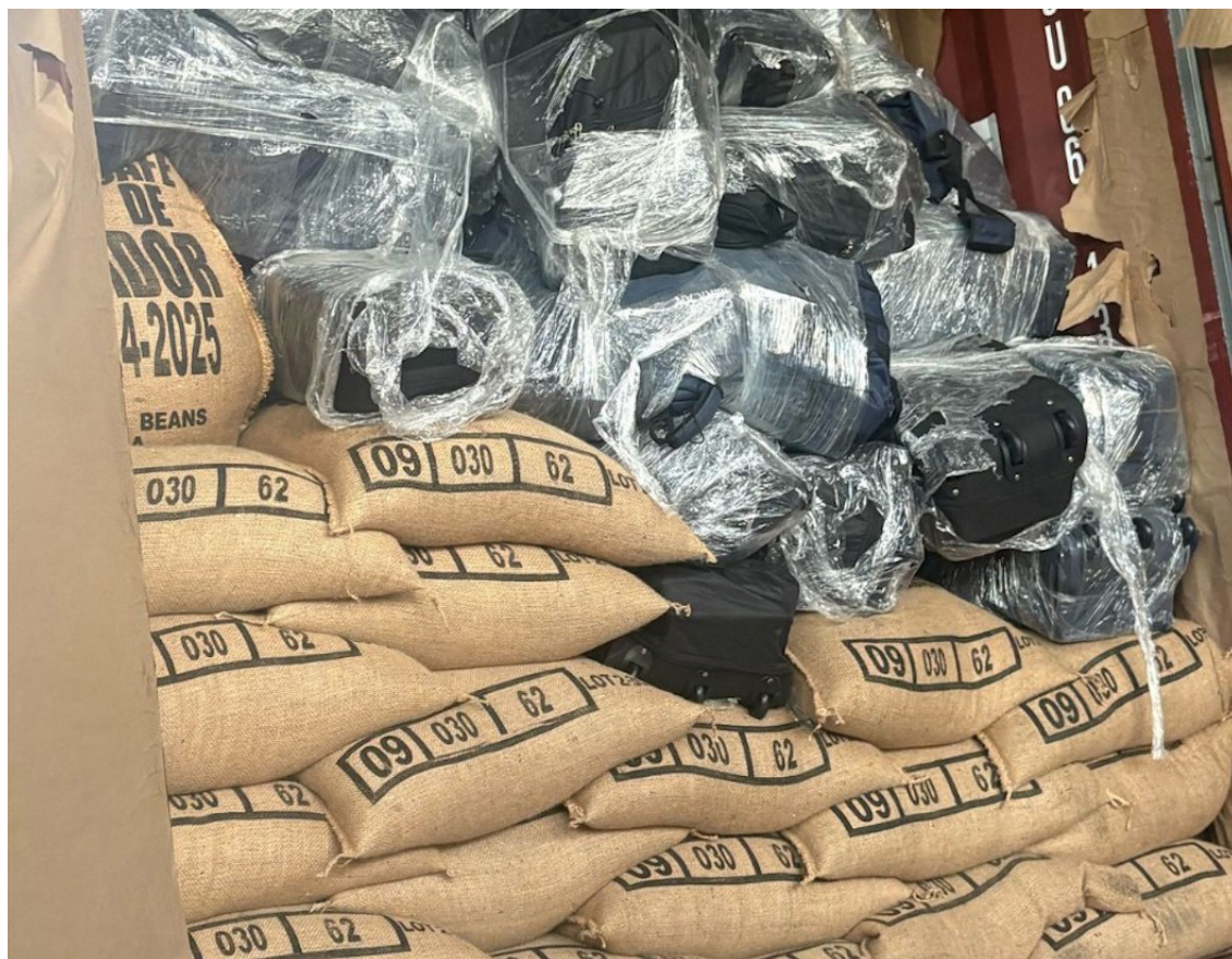
El cargamento de droga se encontró junto a sacos de café de la marca gubernamental “Café de El Salvador”.

Tras asegurar que el contenedor con droga “fue manipulado”, Monroy señaló que el Puerto de Balboa fue el primer punto de desembarque tras su salida de El Salvador, y en ese momento no se reportó ningu-