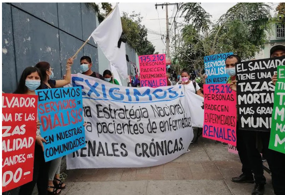
En el marco del “Día Mundial de la Salud” y los casos de Enfermedad Renal Crónica (ERC), la Mesa por la Soberanía Alimentaria (MpSA) denuncia el aumento de esta enfermedad y la falta de centros de salud que den atención a los pacientes.

Blanco señaló que el Atlas Global de Salud Renal (2023) refleja que los años de salud plena que han perdido El Salvador por la Enfermedad