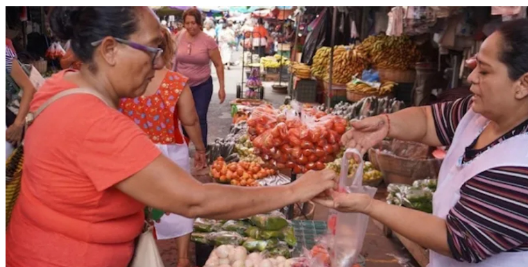
Los mercados municipales serán administrados por el Gobierno Central a través de la Dirección de Mercados Nacionales.

Lo anterior, es contrario al desarrollo económico local. Además, planteó la legisladora, ya han visto esa dinámica con la Autoridad de Planificación del Centro Histórico (APLAN) o en el área de turismo “o en otro