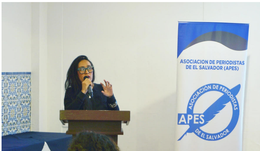
En 2024 siete de cada diez agresiones contra periodistas provinieron de funcionarios o empleados públicos, según el informe de la APES.

Además, la APES informó sobre 29 casos de acoso, 28 de difamación, retención arbitraria con 15 agresiones computadas, amenazas legales con 13 registros, amenazas en 11 ocasiones y agre-