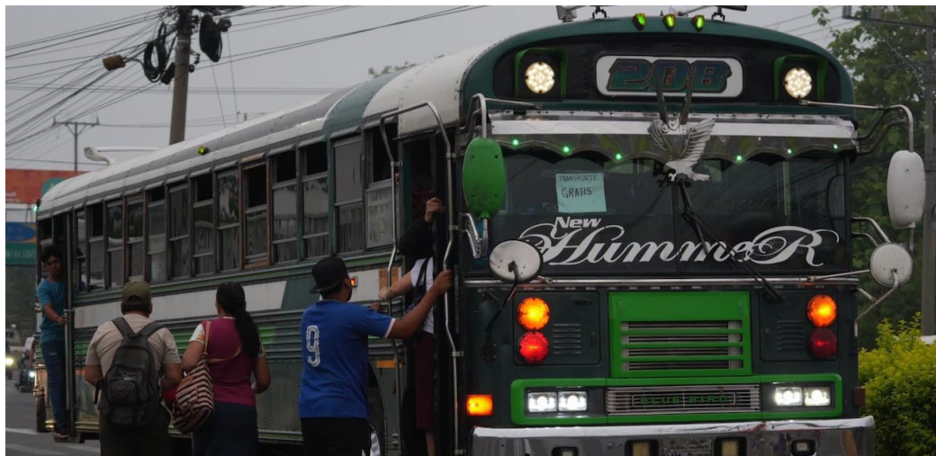
La Mesa Nacional de Transporte reitera que prestarán de forma gratuita el servicio, desde el 5 al 11 de mayo tal como lo pidió el gobierno.