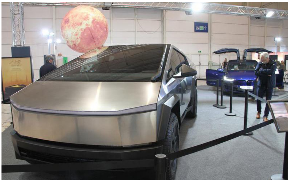
Imagen de archivo de un Tesla Cybertruck exhibido en el área de exhibición de Tesla durante el Ecar Show 2024 en Lisboa, Portugal.

Además, los europeos están comprando cada vez más vehículos eléctricos chinos, incluyendo los del rival de Tesla, BYD, se indicó en un informe de TechCrunch.