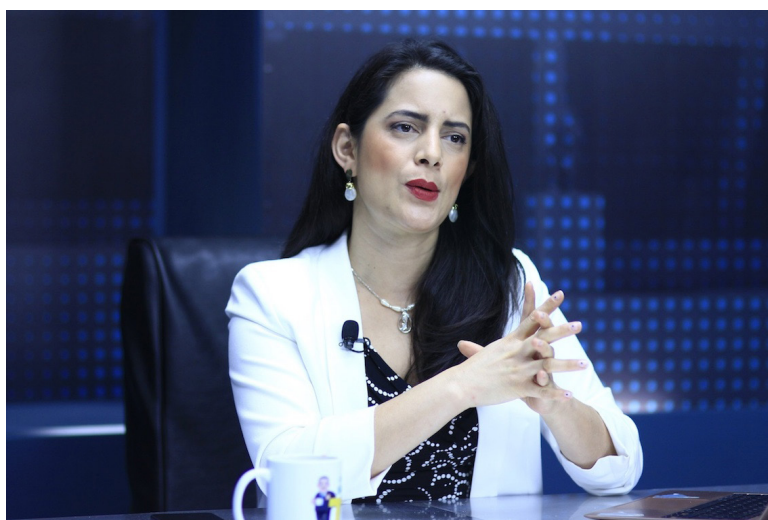
Claudia Ortiz sostiene que el Gobierno ha tomado malas decisiones en el manejo del proyecto de Los Chorros y eso ha afectado la calidad de vida de los salvadoreños.

La diputada de VAMOS, Claudia Ortiz, sostuvo que existe una “cadena de malas decisiones, una falta de buena gestión y adecuada responsabilidad de los funcionarios”, lo que genera “sufrimiento e inconvenientes que está impactando (en) la calidad de vida de los salvadoreños”.