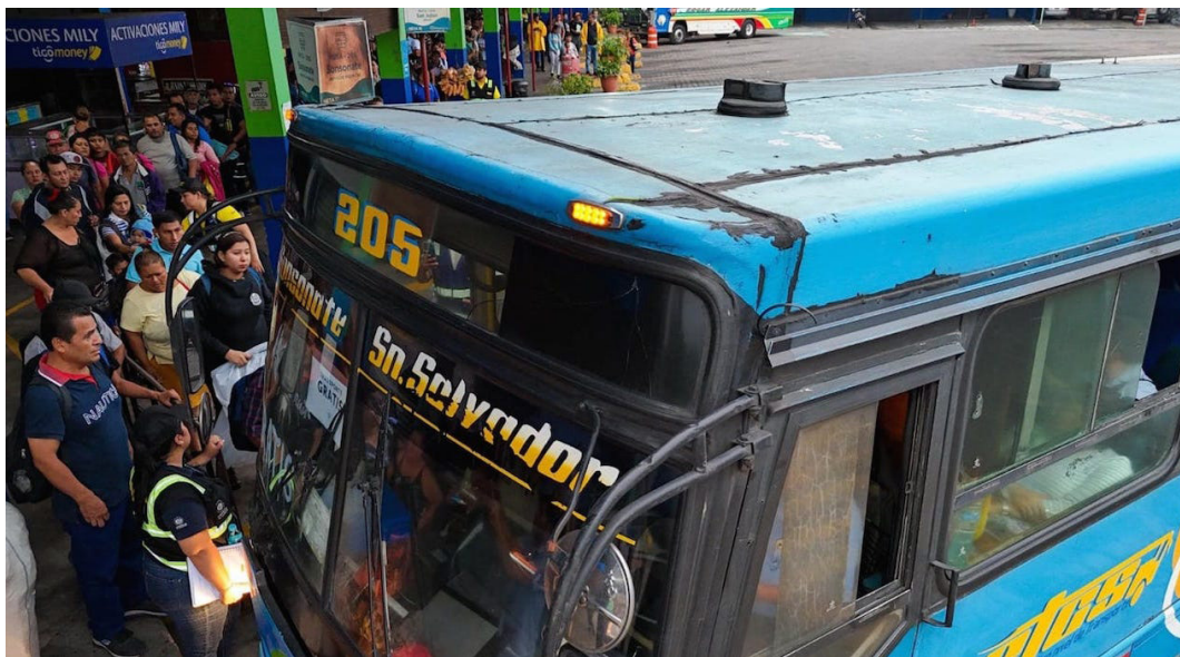
Las paradas de buses y terminales lucen abarrotadas debido a que pocas unidades del transporte trabajaron en las primeras horas del día.

Es de recordar que a Catalino Miranda le han adjudicado nue-