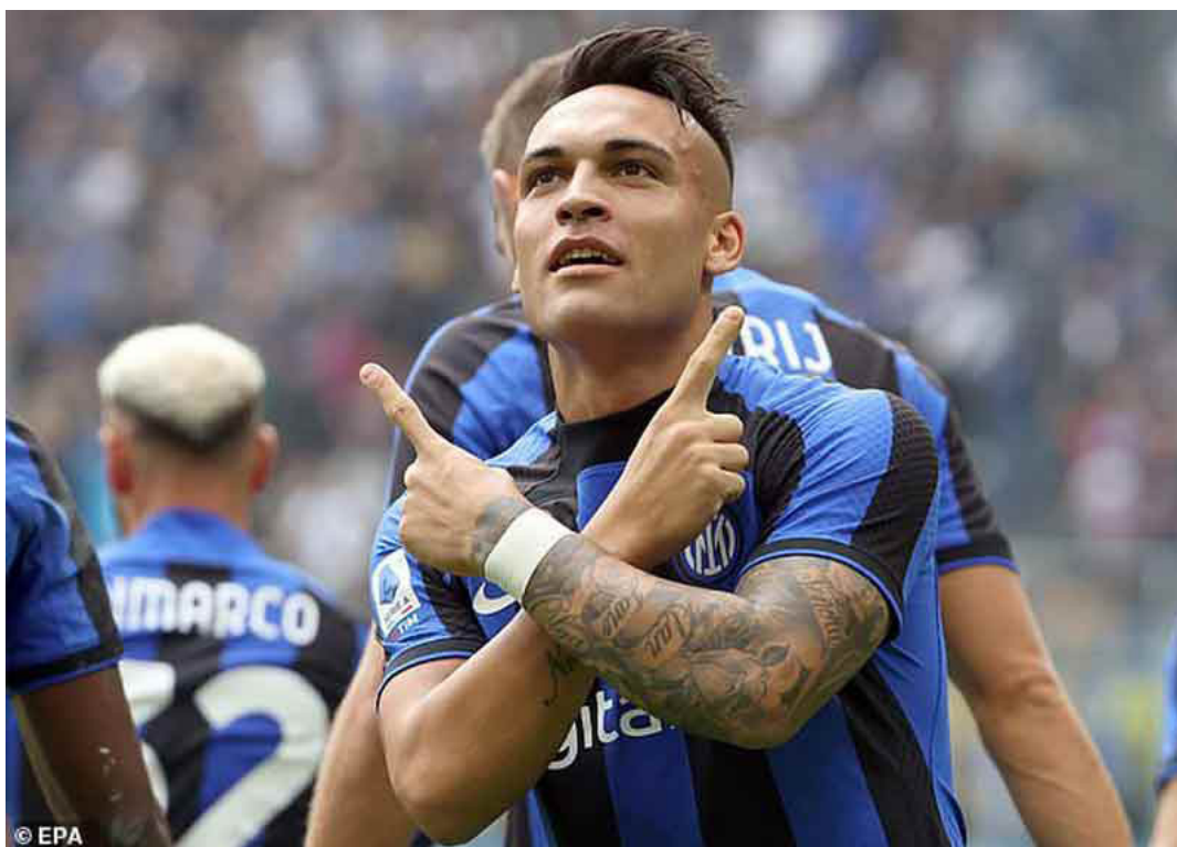
Lautaro Martínez volvió a poner delante a los interistas y enardeció a los fans en las tribunas del Giuseppe Meazza de San Siro al derrotar al Barcelona.

Mañana se jugará la vuelta de la otra semifinal, en la cual el local París Saint Germain francés tiene ventaja tras imponerse en la ida 1-0 al Arsenal inglés.