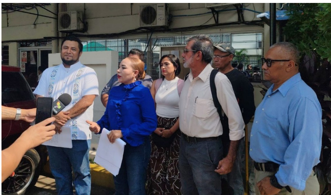
El BRP propone incrementar 25% al salario mínimo, y no el 12% como dijo el gobierno.

A criterio de la dirigente del BRP, 580 mil personas saldrían de la pobreza,