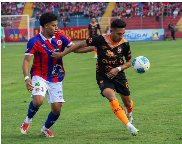
El FAS recibirá a Águila en Santa Ana para buscar ventaja en los cuartos de final del Clausura.

La noche del miércoles culminará con un clásico imperdible. En el Estadio Óscar Alberto Quiteño, de Santa Ana, los rojos de C.D. FAS se medirán ante su archirrival, el C.D. Águila, a las 8:00 pm. La pasión y la intensidad estarán a