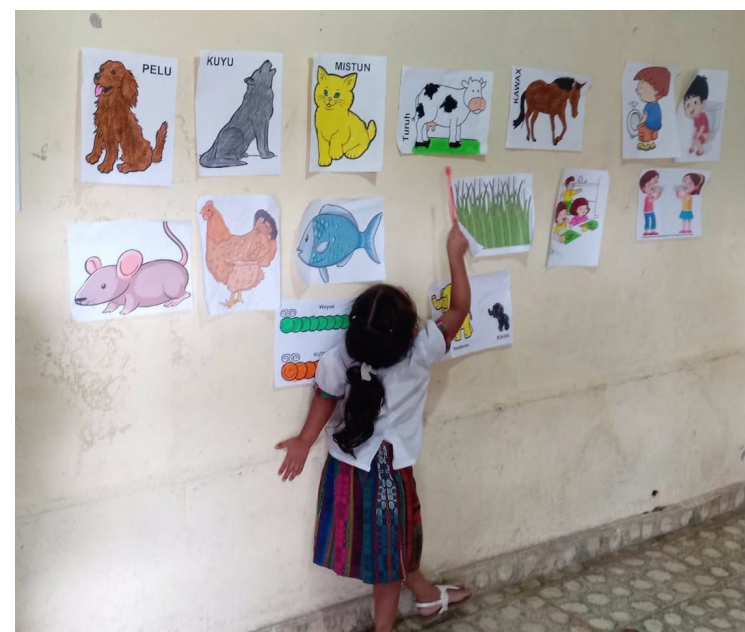
Clases en la Cuna Nahuat de Nahuizalco, que se encuentra a la espera de trasladarse a su nueva sede en el distrito de Nahuizalco Sonsonate Norte.