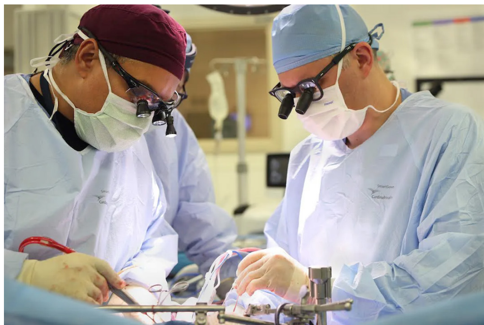
Según los diputados, los cambios a la normativa buscan agilizar el proceso de donación de órganos para que más pacientes tengan acceso oportuno a este beneficio.

El artículo 29, anteriormente citaba: “El Registro Único de Compatibilidad para Trasplantes refleja el registro de datos de los pacientes aptos, preparados y listos para recibir un trasplante, que hayan sido avalados previamente por la Junta de Delegados del Consejo Salvadoreño de Trasplantes (CST), con el fin de garantizar los principios de igualdad y equidad”.