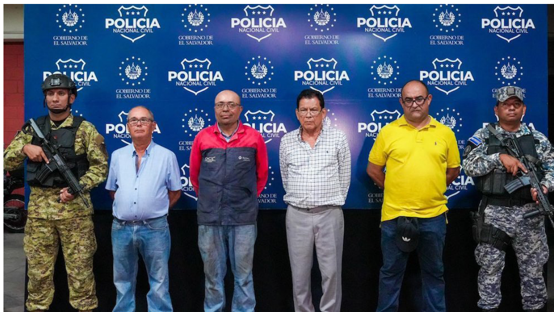
La PNC captura a siete transportistas quienes serán acusados de peculato, al no brindar el servicio de la forma acordada con el gobierno.