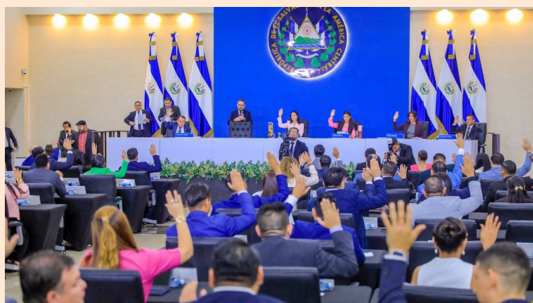
Según los diputados, el propósito de estos fondos es reducir el déficit habitacional mediante la provisión de créditos hipotecarios para la adquisición de viviendas sociales.

El objetivo del proyecto, según se explicó, es reducir el déficit habitacional mediante la provisión de créditos hipotecarios para la adquisición de viviendas sociales. La población beneficiada será aquella que requiera una vivienda de interés social, teniendo acceso a un crédito de hasta $40 mil. Además, con el 50 % de los fon-