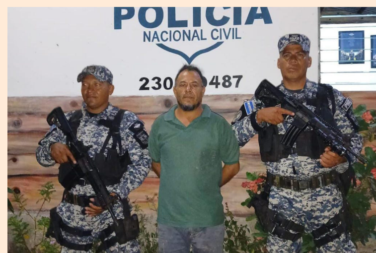
Ambos intentos de homicidio fueron perpetrados por sus compañeros de vida. Hasta el momento se ha capturado a uno de esos responsables.

Organizaciones defensoras de derechos de las mujeres registraron 38 feminicidios solo en 2024. El 52 % fue cometido por parejas o exparejas de las vícti-