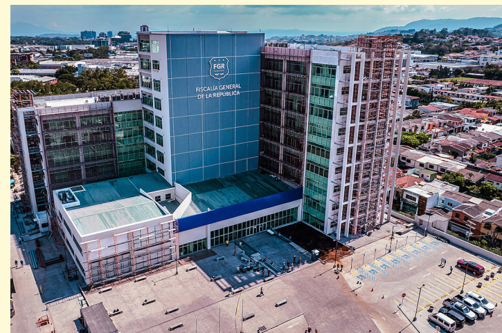
El Banco Centroamericano de Integración Económica (BCIE) vía préstamo, aportó los $70.2 millones para la construcción del edificio en busca de centralizar las actividades y operaciones de la FGR.

De hecho, el monto inicial fue de $25.3 millones, pero se amplió hasta los $70.2 millones. A Raúl Melara lo destituyeron el 1 de mayo de 2021, cuando Nuevas Ideas llegó al poder.