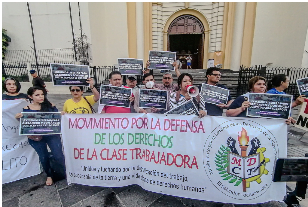
Organizaciones reiteran el llamado a las autoridades para que liberen a los líderes detenidos de la Cooperativa El Bosque.