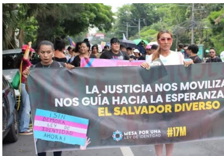
La marcha sale desde el parque Cuscatlán para alzar la voz y exigir una Ley de Identidad de Género.

En febrero de 2022 la Sala de lo Constitucional de la Corte Suprema de Justicia (CSJ) expresó que la Car-