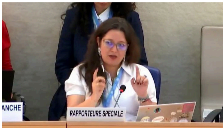
La representante de la ONU exhorta a la Asamblea Legislativa a abrir un debate público plural y transparente, e incorporar los principios internacionales de derechos humanos.