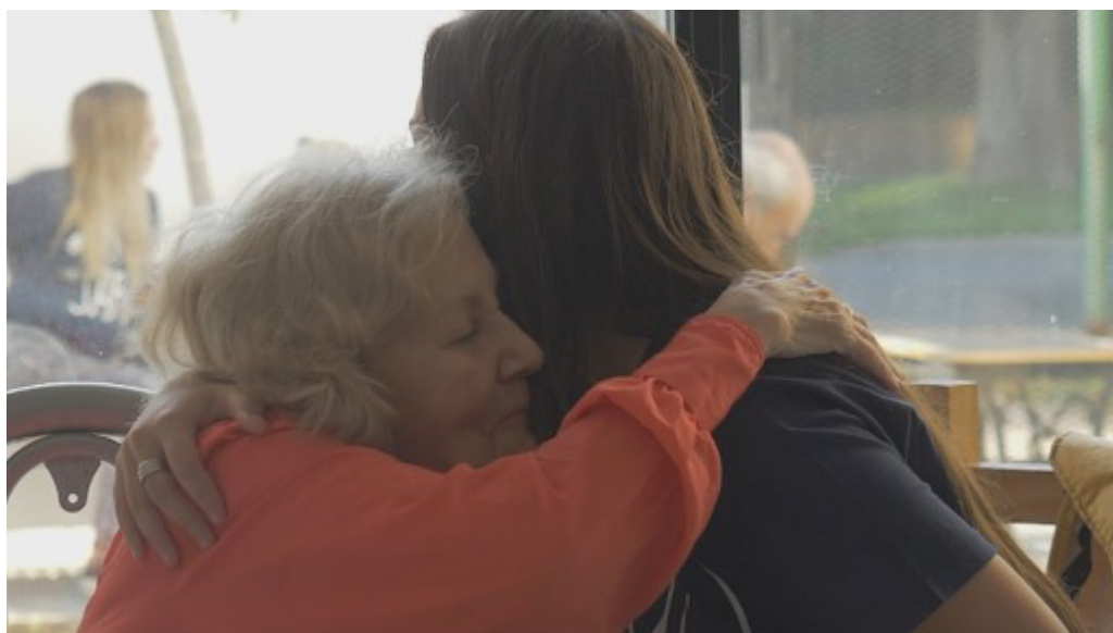
Estudios del Ministerio de Salud reportan que los adultos mayores institucionalizados suelen padecer de cuadros de ansiedad y depresión, especialmente en contextos de baja interacción social.

En el caso de los niños, el panorama es igual de alarmante. Se estima que alrededor de 2,7 millones de niños en el mundo viven en instituciones de atención, según el Fondo de las Naciones Unidas para la Infancia (UNICEF). “Muchos de ellos pasan años sin establecer vínculos afectivos estables ni recibir visitas externas. Si bien reciben contención material y educativa, la falta de relaciones significativas impacta directamente en su desarrollo emocional, su autoestima y su capacidad de crear lazos en el futuro”, señaló Huellas.