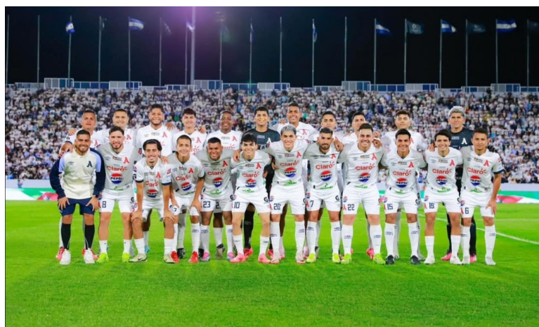
El Alianza venció 3 a 0 en el global y se enfrentará en la final, una vez más, contra Municipal Limeño, de Santa Rosa de Lima.

En el primer tiempo, pese al dominio del balón de parte de Alianza, con el 59% contra el 41% del Fuerte San Francisco, los albos no pudieron hacer el gol que le diera la tranquilidad, ya que el equipo mimado de los capitalinos tenía la ventaja del partido de ida, pero por la mínima.