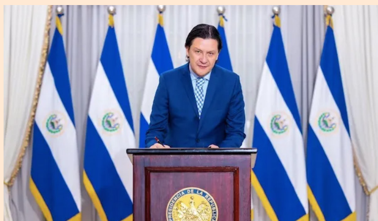
Comisionado de Derechos Humanos y Libertad de Expresión renunció a su cargo en medio de una grave tensión social y vulneración a los derechos humanos.