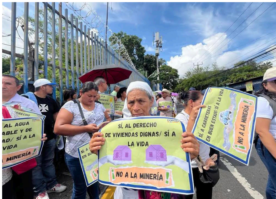
Comunidades se concentran en la Asamblea Legislativa para exigir la derogación a la Ley de Minería por ello presentan más de 7 mil firmas.

Los líderes de COFOA recordaron que el artículo 117 de la Constitución de la República establece que “es