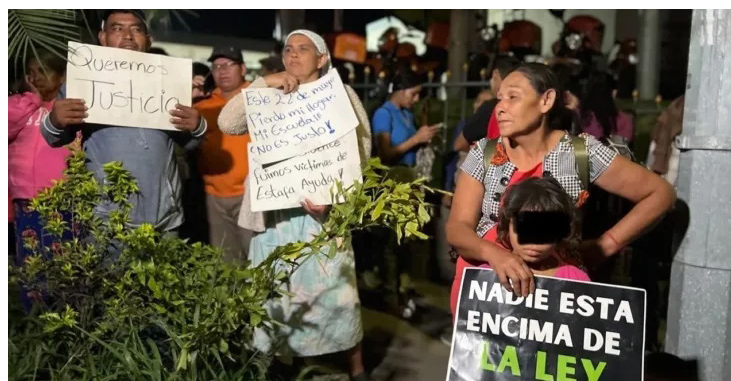
La protesta pacífica de habitantes de la cooperativa El Bosque por un posible desalojo de más de 300 familias en Santa Tecla, fue la excusa para que el presidente de El Salvador, Nayib Bukele, respondiera con la Ley de Agentes Extranjeros, aprobada este martes y que impondrá un 30 % de impuesto a los fondos de cooperación, provenientes de cualquier fuente nacional o internacional. Foto Diario Co Latino/Archivo..

Mientras, Verónica Reyna SPASS y Mesa por el Derecho a