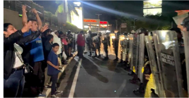
Habitantes de la Comunidad El Bosque son reprimidos e intimidados por la Policía Militar y la UMO tras un plantón pacífico en las cercanías de la residencia presidencial.

“Art. 293-A.- El funcionario público, agente de la autoridad o miembro de cuerpos de seguridad del Estado que ordenare, autorizare, ejecutare o participare en el uso de la fuerza pública contra personas que ejercen de manera pacífica el derecho de reunión o manifestación, sin causa legal justificada o de forma desproporcionada, o que impidan por distintos medios que las personas lleven a cabo o participen en una reunión o manifestación pacífica será sancionado con pena de prisión de tres a seis años e inhabilitación especial para el ejercicio del empleo o cargo por igual tiempo”.