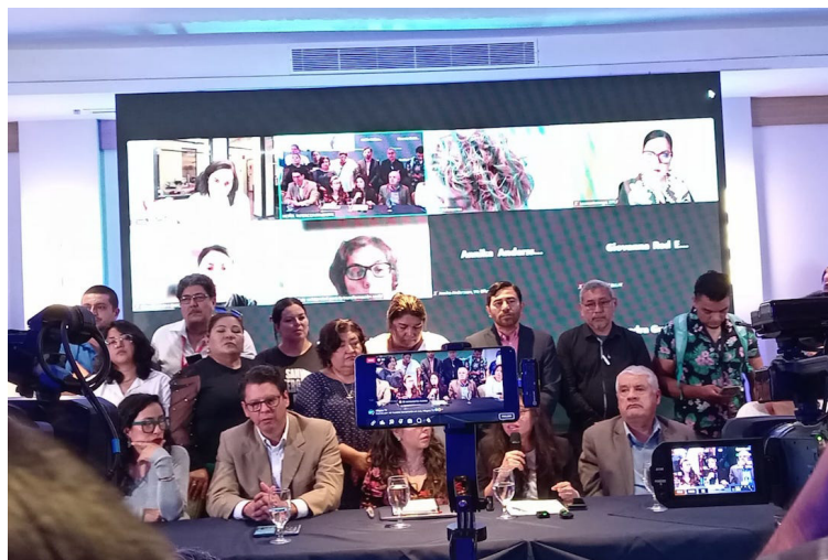
Representantes de diversas organizaciones, redes, movimientos, líderes comunitarios, sindicatos y colectivos de la sociedad civil salvadoreña y organizaciones internacionales, se pronuncian ante el escenario de persecución y criminalización a personas y organizaciones defensoras de derechos humanos en el país.

Asimismo, como población civil organizada “rechazaron enérgicamente” las acusaciones que calificaron de infundadas y el permanente “discurso estigmatizante y de odio”, que sólo contribuye en la difamación del legítimo trabajo de las