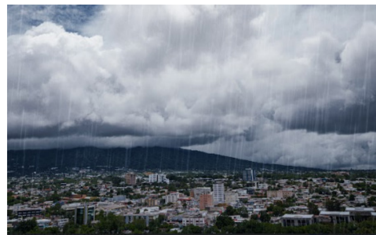
El MARN prevé para este jueves lluvias y tormentas en la zona central y occidental, cordillera volcánica y franja norte.

El funcionario dijo que durante la época lluviosa cada semana vendrán ondas tropicales las cuales traerán tormentas dos o tres días