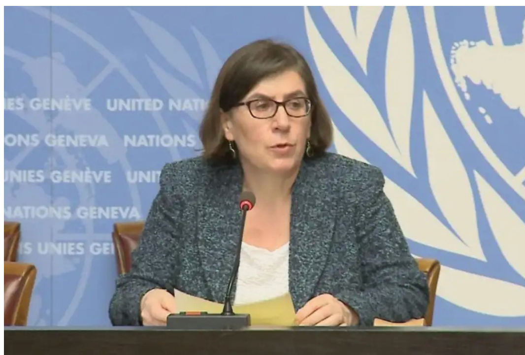
Liz Throssell, portavoz de Derechos Humanos de las Naciones Unidas (OHCHR), manifiesta su preocupación por la reducción del espacio cívico, y el respeto a los derechos humanos de la población salvadoreña. Foto Diario Co Latino/ Archivo.

El artículo 11 que contempla esta carga económica señala: “Por cada transacción financiera, desembolso, transferencia, importación en especies o bienes materiales, o cual-