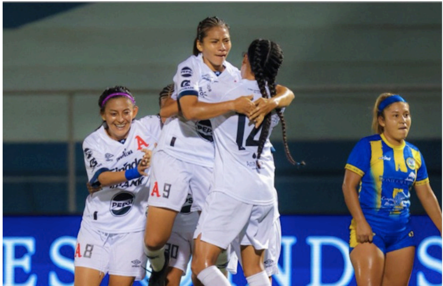
Alianza vence 3-1 a Municipal Limeño en Las Delicias y se convierte en campeona del Clausura 2025.

Sobre el cuarto de hora, en Las Delicias, Limeño se hacía dueño del esférico sin oportunidad para el cuadro capitalino que buscaba como única medida