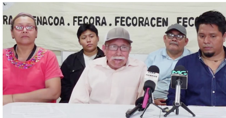
El sector campesino del BRP denuncia el incumplimiento del Ministerio de Agricultura, en la entrega de insumos agrícolas para el ciclo de siembra, sustituido por una tarjeta de $75, que no ha sido activada.

El sector campesino del Bloque de Resistencia y Rebeldía Popular (BRP), denunció que los campesinos pagan con prisión el delito de proteger sus tierras arrebatadas por la fuerza, tal es el caso de los 24 habitantes de La Floresta, quienes permanecen detenidos por defender sus propiedades, ya que fueron desalojados.