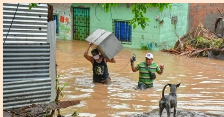
Las comunidades en mayor riesgo son las que verán afectadas, ante un “eventual retiro” de la cooperación y por el cierre de organizaciones, motivado por la incertidumbre y la falta de garantías en la aplicación de la referida Ley de Agentes Extranjeros.

“La Concertación Regional para la Gestión de Riesgos (CRGR), que está integrada por cinco Mesas Nacionales de Gestión de Riesgos de Centroamérica, expresa su solidaridad con el pueblo salvadoreño ante la reciente aprobación de la Ley de Agentes Extranjeros, que impone un impuesto del 30% a las transacciones, desembolsos, donaciones o importaciones en es-