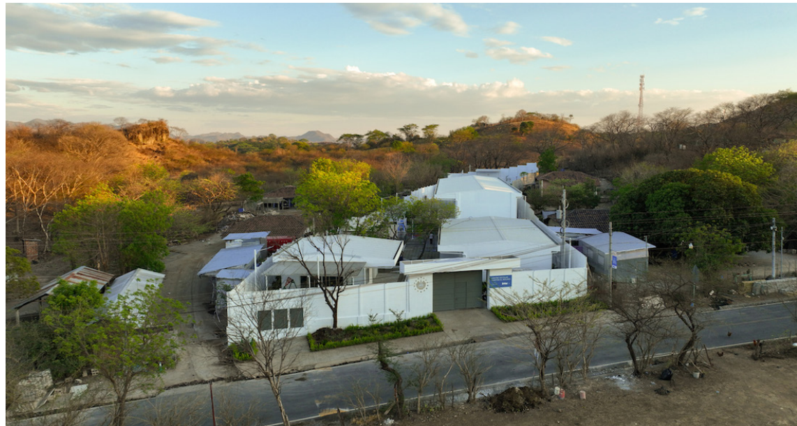
Bukele nuevamente anuncia que mejorará todos los centros educativos del sistema público en El Salvador; Foto: Diario Co Latino / Cortesía.

La inversión en el Centro Escolar Cantón Santa Clara ha sido de $3.8 millones, beneficiando a 860 estudiantes y con un área de construcción de 4,439 metros cua-