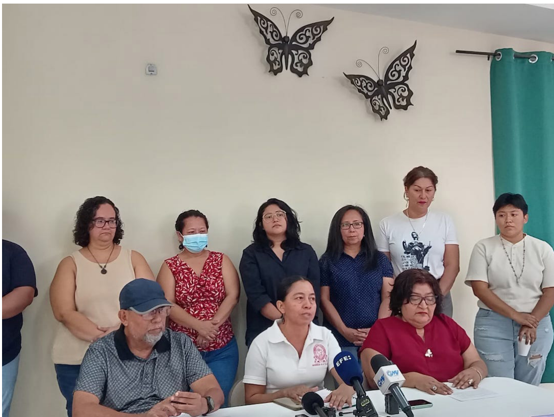
Distintos representantes de organizaciones de la sociedad civil, presentan el “Balance sobre la Situación de Derechos Humanos en El Salvador”, en el marco del primer año del segundo mandato presidencial.