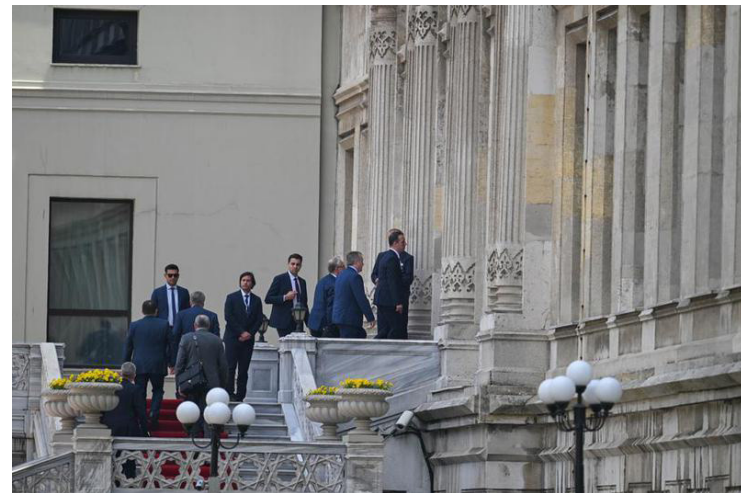
Miembros de la delegación rusa ingresan al Palacio de Çırağan, en Estambul, Turquía, el 2 de junio de 2025.

Las delegaciones rusa y ucraniana realizaron hoy en Estambul su segunda ronda de