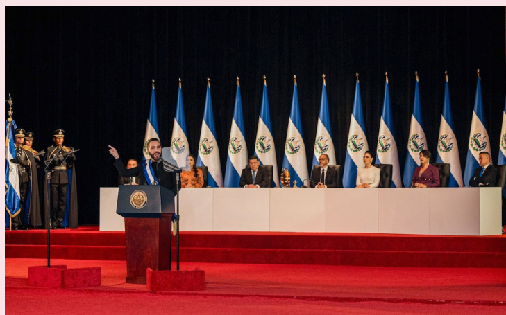
Nayib Bukele ofrece un discurso a la nación pero no rinde cuentas sobre su sexto año de gestión.

El partido tricolor dijo en su comunicado que el discurso se centró en el desprecio por la democracia y los derechos hu-