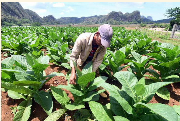
Un campesino trabajando en un campo de tabaco, en el valle de Viñales, en la provincia de Pinar del Río, Cuba.

ritmo incesante de trabajo, pues tienen que procesar unas 27 toneladas de hojas cosechadas en la finca, ubicada en la comunidad de Puerta de Golpe, a unos 20 kilómetros al este de la ciudad capital de la provincia.