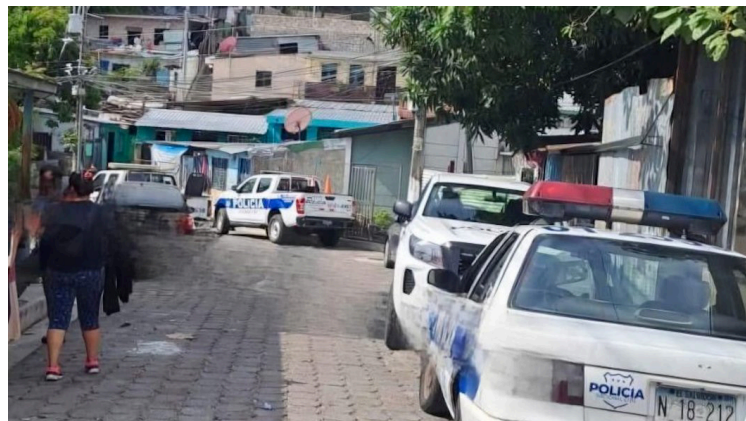
El cuerpo de una joven de 14 años, que no fue identificada, fue encontrado en una zona verde de la Comunidad 10 de Octubre, entre la Amatepec y Ciudad Credisa, en el distrito de Soyapango, San Salvador Este.