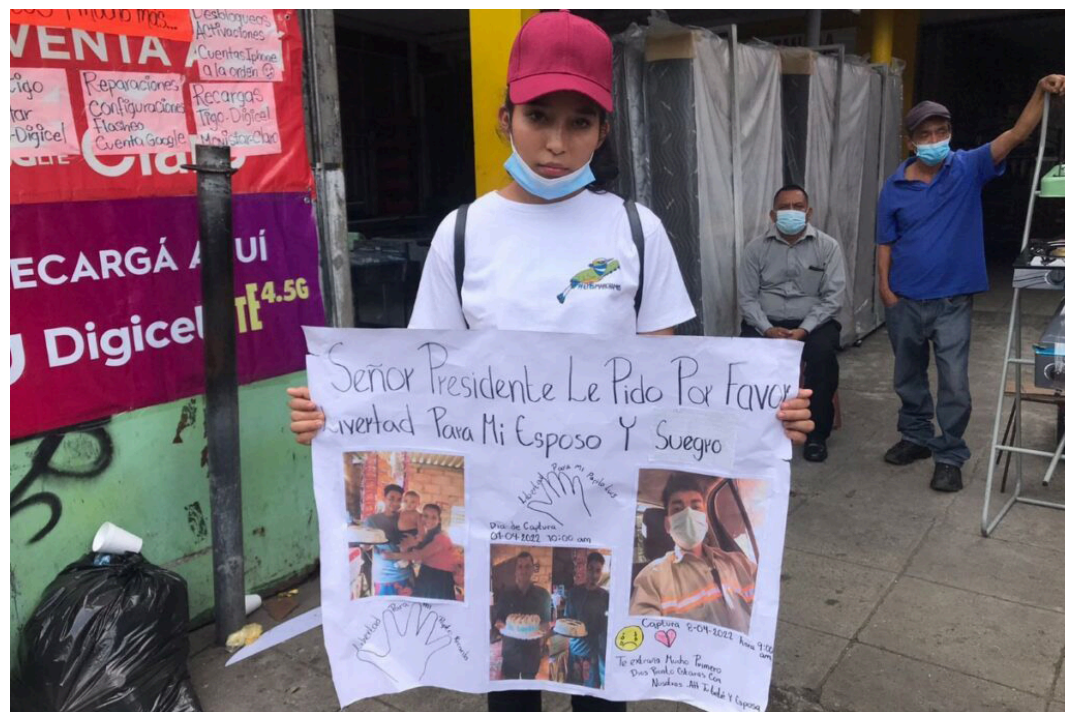
El discurso presidencial tuvo como objetivo general mandar un mensaje de “intolerancia al movimiento social y periodistas”, así como, reiterar que el régimen de excepción seguirá vigente este año.

Del mismo modo, en el análisis de estos 6 años del gobierno del presidente Bukele, consideró que se ha caracterizado por la intolerancia frente al movimiento social y organizaciones populares. Y que por tener un aspec-