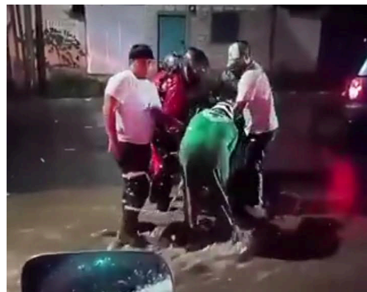
En la Aldea San Antonio, Santa Ana, socorristas de Cruz Verde ayudaron a motociclistas que habían quedado atrapados en el agua.

ciclón tropical en los próximos siete días, según el Centro Nacional de Huracanes de Estados Unidos.