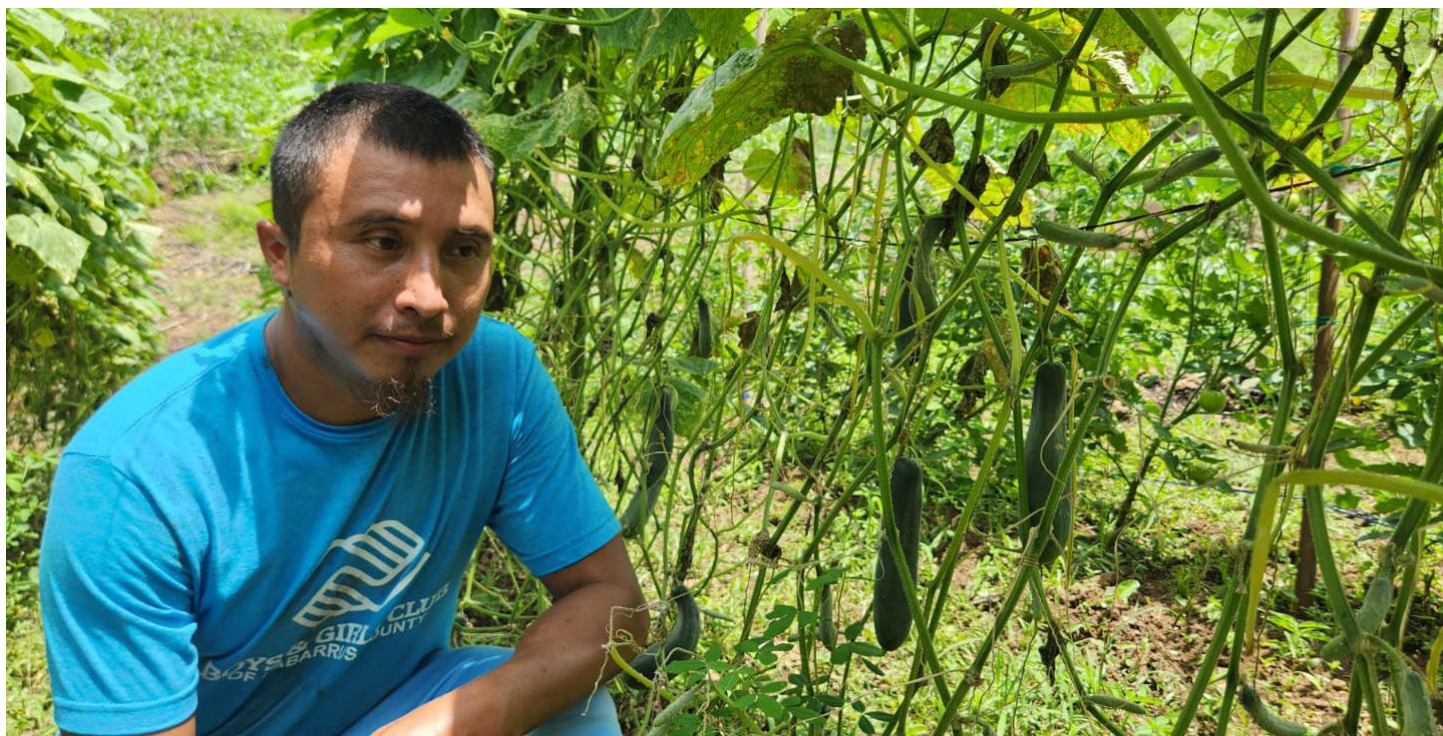
Familias de Pueblos Indígenas de los distritos de Santo Domingo de Guzmán y Santa Catarina Masahuat, Sonsonate, , cultivan hortalizas luego de recibir semillas para sus cultivos de subsistencia 9 .