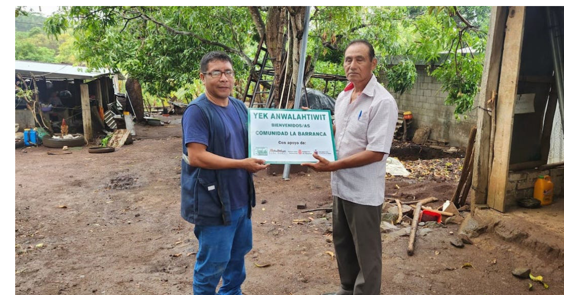
Agricultores de subsistencia, reconocen el apoyo de PRO VIDA, así como el gobierno de Navarra, el Ayuntamiento de Villaba Atarravia y el Colectivo El Salvador ELKARTASUNA”, en la lucha por mejorar las condiciones de vida de Pueblos Originarios.

“Ya llevamos un promedio de tres años apoyándoles en este esfuerzo en donde las familias están participando. Y claro, sabemos que de esos cultivos en sus cosechas no se logran a sacar el cien por ciento de esos productos. Porque siempre afecta el cambio climático, ya sea por sequía o por exceso de lluvias que inundan sus cultivos, y esto siempre afecta, pero, no obviamos que de sus cosechas siempre logran sacar algo para su alimentación y esto es importante frente a la crisis alimentaria que afecta la zona”, explicó.