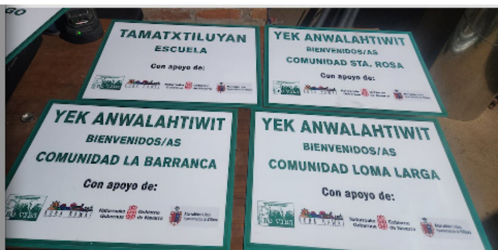
Comunidades indígenas trabajan en la colocación de nomenclatura de calles y lugares en idioma nahua como preservación y rescate de la identidad de los Pueblos Originarios en el país.