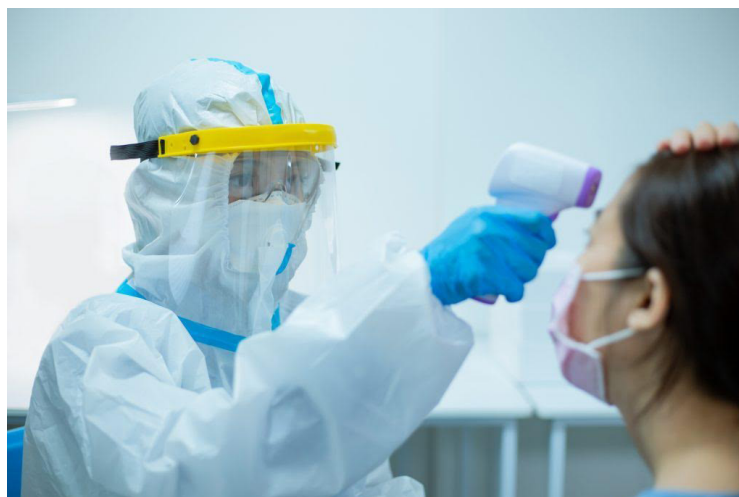
La variante NB.1.8.1 del COVID-19 es comparada en el mundo científico con la cepa original, debido a la rápida propagación del virus.

Con respecto al gusano barrenador, indicó que la mosca no es de carroña, sino que busca los seres vivos, si hay una herida deposita los huevos y de dos a cuatro días hay una cantidad de gusanos saliendo tanto en animales como humanos.