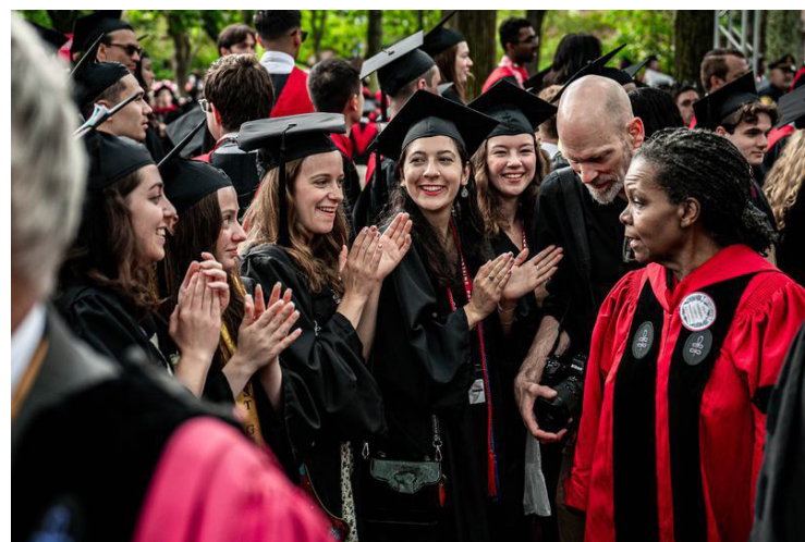
Imagen del 29 de mayo de 2025 de estudiantes asistiendo a la ceremonia de graduación en la Universidad de Harvard, en Cambridge, Massachusetts, Estados Unidos.

presentó el jueves una impugnación legal ante un tribunal federal contra la prohibición de la administración Trump de que estudiantes internacionales ingresen a Estados Unidos con visas para asistir a Harvard.