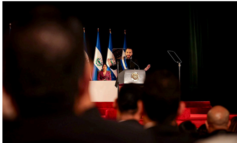
Nayib Bukele critica a la comunidad internacional por que le cuestionan su forma de gobernar, basado en las violaciones derechos humanos y aprobación de leyes que van en contra de la democracia.

El 20 de mayo, la Asamblea Legislativa, de mayoría oficialista, aprobó la referida ley de forma exprés. La ley permitirá que Bukele cree todos los reglamentos que quiera para aplicarla, incluso, definir quién es “agente extranjero”. Sin controles ni límites. En manos del poder, esta ley puede usarse para callar a ONG, prensa y voces críticas tal y como lo han señalado diversos expertos y analistas. “Si bien la Unión Europea mantiene su compromiso de apoyar el desarrollo económico y social inclusivo y sostenible en El Salvador, la nueva legislación sobre agentes extranjeros y la reducción del espacio para la sociedad civil podrían socavar el desarrollo y afectar negativamente la cooperación”, puntualizó la UE.