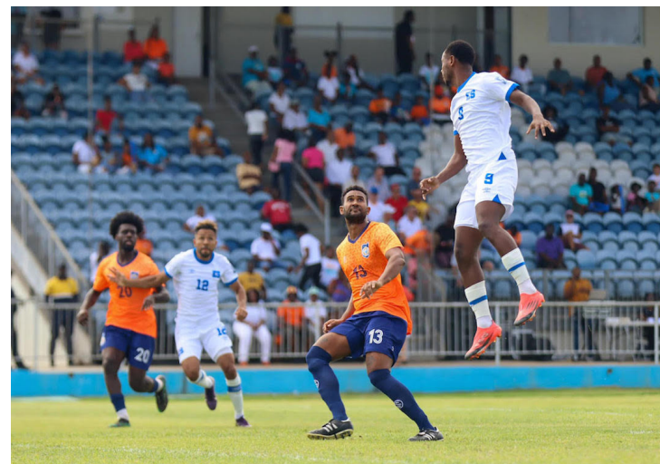
La Selecta vence 3-0 a Anguila en las eliminatorias mundialistas de CONCACAF rumbo a la Copa del Mundo 2026.

mente en disputa se clasificarán los primeros dos lugares de cada grupo, por ello El Salvador debe este martes vencer o empatar ante Surinam para clasificarse a la tercera fase de la eliminatoria. Sin embar-