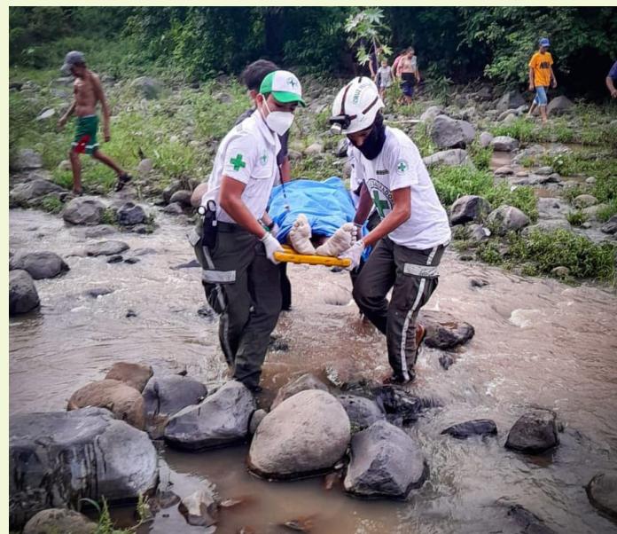
Cruz Verde Salvadoreña (CVS) recupera el cuerpo de un hombre encontrado en un río en el Puerto de La Libertad luego de reportarse como desaparecido.

Este es el segundo caso de personas que son encontradas en un río en los últimos días, pues un día antes de ello, el viernes 6 de junio, el cadáver de una mujer de la tercera edad fue encontrado y recuperado por ele-