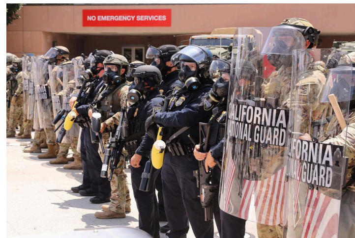
Imagen del 8 de junio de 2025 de soldados de la Guardia Nacional de California y oficiales de policía vigilando en el Centro de Detención Metropolitano de Los Ángeles, en Los Ángeles, California, Estados Unidos.

Reporteros de Xinhua en el lugar vieron a elementos de la Guardia Nacional, junto con agentes del Servicio de Inmigración y Control de Aduanas y del Departamento de Seguridad Na-