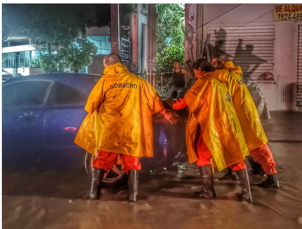
Bomberos ayuda a un conductor cuyo vehículo quedó en medio de un anegamiento de agua, en el Redondel El Lagarto en el cantón Cantarrana, Santa Ana.

condiciones se deben al flujo acelerado del este combinado con humedad, vaguadas y ligeros apoyos de sistemas en capas medias, formarán nubosidad asociada a tormentas que se organizarán mejor por la tarde y noche.