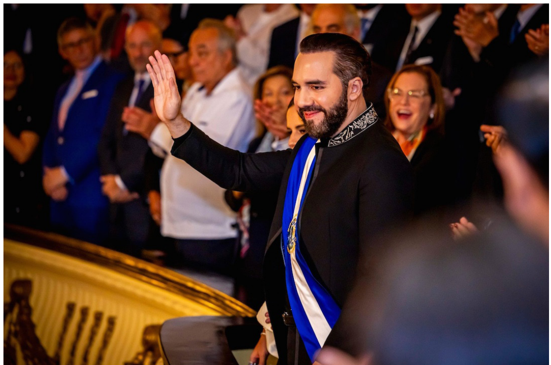
El Gobierno de Bukele habría desviado fondos USAID para destinarlos a las maras; esa fue la sospecha que tenía el Departamento de Justicia de EEUU, según investigación de Propublica.

nario de la ley federal: “El dinero iba de nosotros, de USAID, a este grupo del tejido social” (...) “Se supone que tenían que construir cosas y adquirir capacidades y aprender(...)”. También, se conoció, por medio de testimonios de pandilleros que los Centro Urbano de Bienestar y Opor-