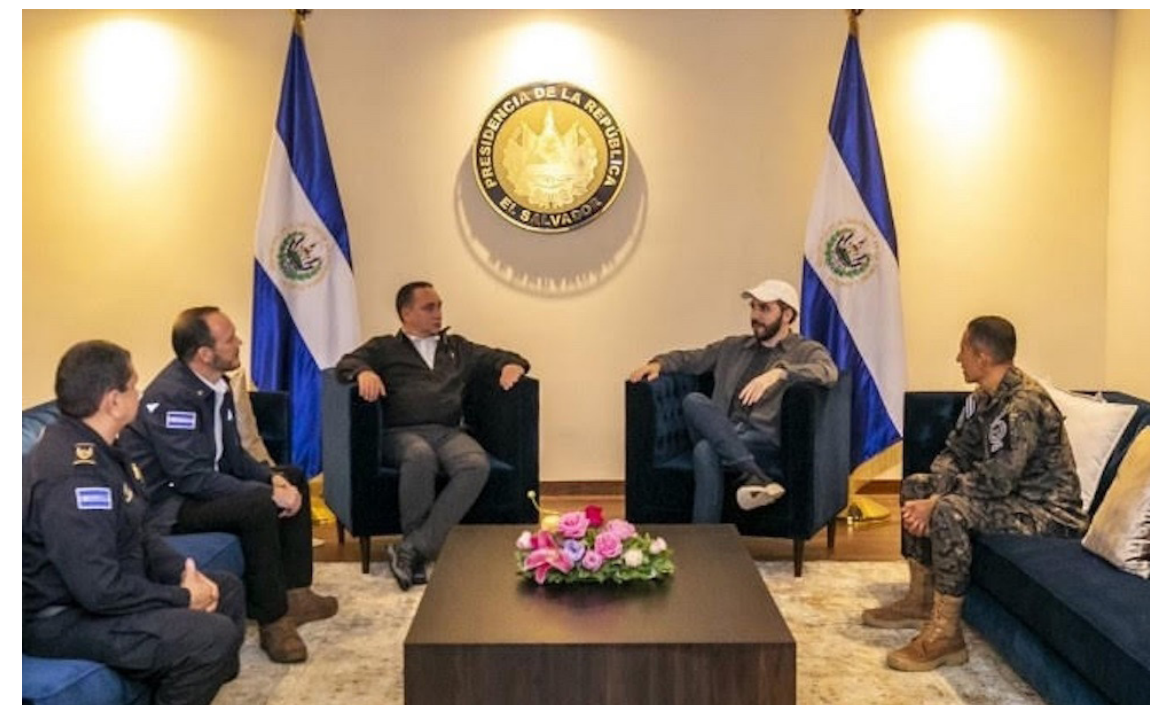
Senadores de Estados Unidos piden al Congreso de EUA que sancionen a Nayib Bukele y varios de sus ministros.

“Además de sus acciones junto a la Administración Trump para encarcelar a personas de Estados Unidos, Bukele y su gobierno han seguido