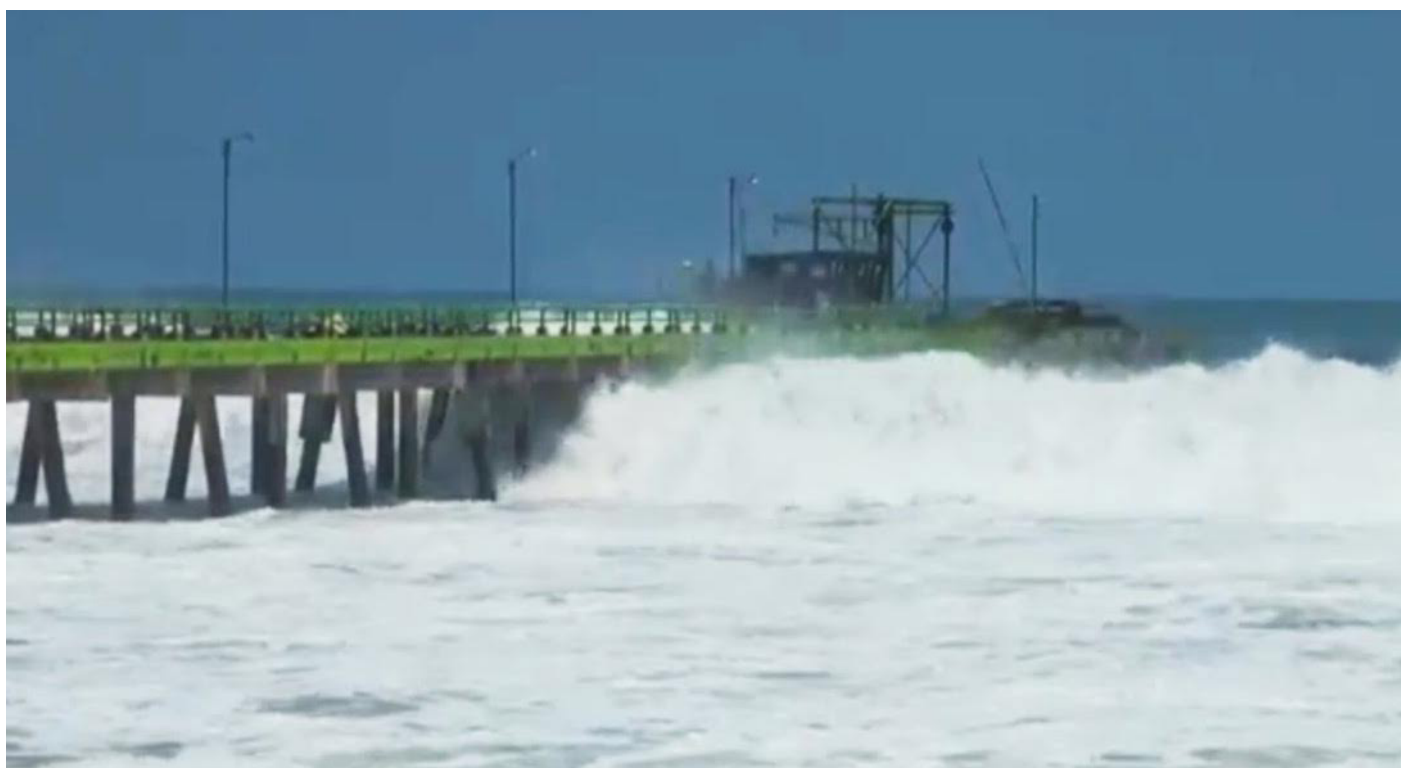
Protección Civil emite advertencia por oleaje más alto y rápido de lo normal.