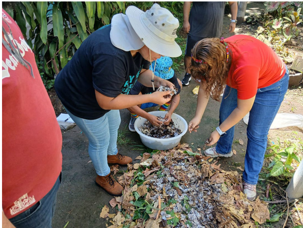
Colectivo Micelio Suburbano, inicia un nuevo curso de práctica y aprendizaje en algunas técnicas de huertos en contextos urbanos y prácticas agroecológicas, para preparar los suelos.