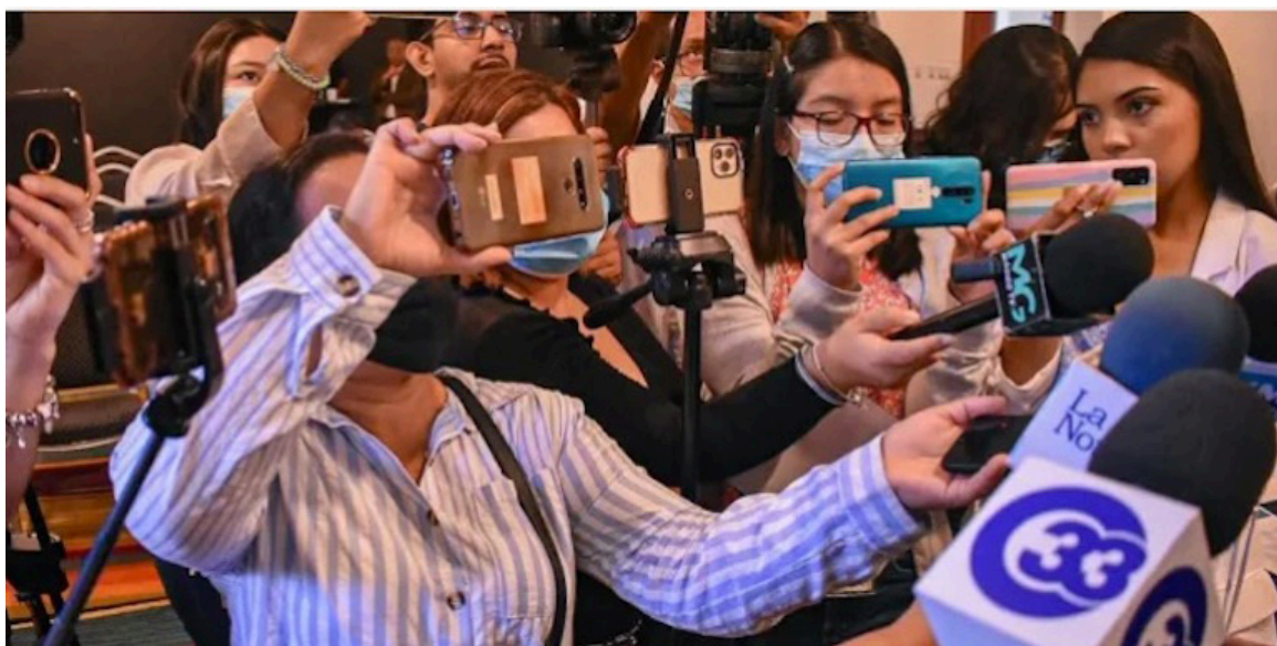
La Asociación de Periodistas de El Salvador, se pronuncia por el xodo masivo de periodistas fuera del país, debido a las constantes violaciones a los derechos humanos del gremio.

“En las últimas semanas hemos documentado el desplazamiento forzado de aproximadamente 40 periodistas del país, ante múltiples casos de hostigamiento, intimidación y restricciones arbitrarias hacia periodistas y medios de comunicación”,