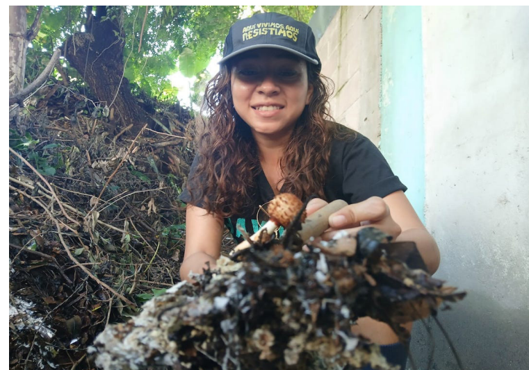
La práctica de los huertos urbanos es cultivar alimentos como verduras, frutas y hierbas ya sea de condimento o medicinales en espacios urbanos como balcones, patios, zonas verdes o terrenos comunitarios.

“Hacemos actividades también de apropiación del espacio público para poder desarrollar estos huertos agroecológicos y hacemos también talleres de preparación de ungüentos naturales a partir de plantas medicinales y la enseñanza de técnicas agroecológicas. Por lo que nos estamos preparando para lanzar próximamente un Manual Agroecológica Suburbana”, anunció Alemán.