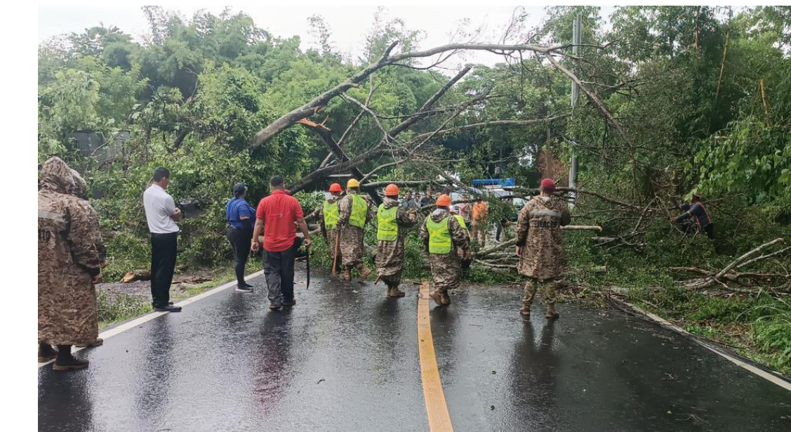
Reportes ciudadanos y de Protección Civil, señalan fuertes lluvias este domingo en el Área Metropolitana de San Salvador (AMSS), causando inundaciones y caídas de árboles.

El Ministerio de Medio Ambiente y Recursos Naturales (MARN) advirtió que las lluvias se mantendrán hasta la madrugada del martes 17 de junio, por una baja presión con “potencial ciclónico” y una onda tropical que estaría contribuyendo a estas precipitaciones.