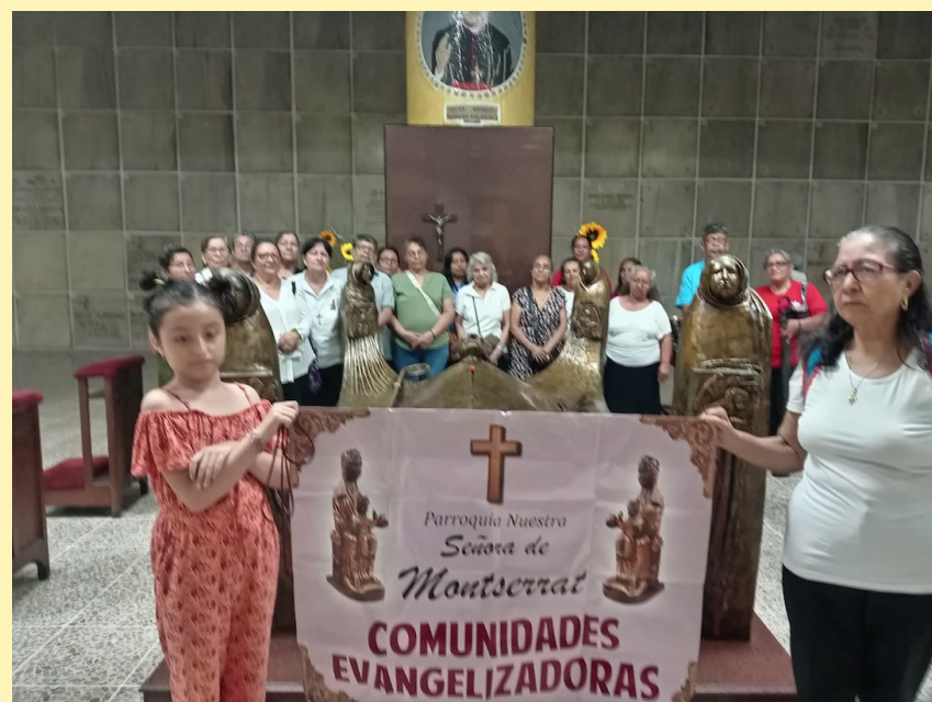
En la Cripta de San Oscar Romero las Comunidades Evangelizadoras de la Parroquia de Nuestra Señora de Monserrat, llegan a la santa misa en catedral metropolitana.