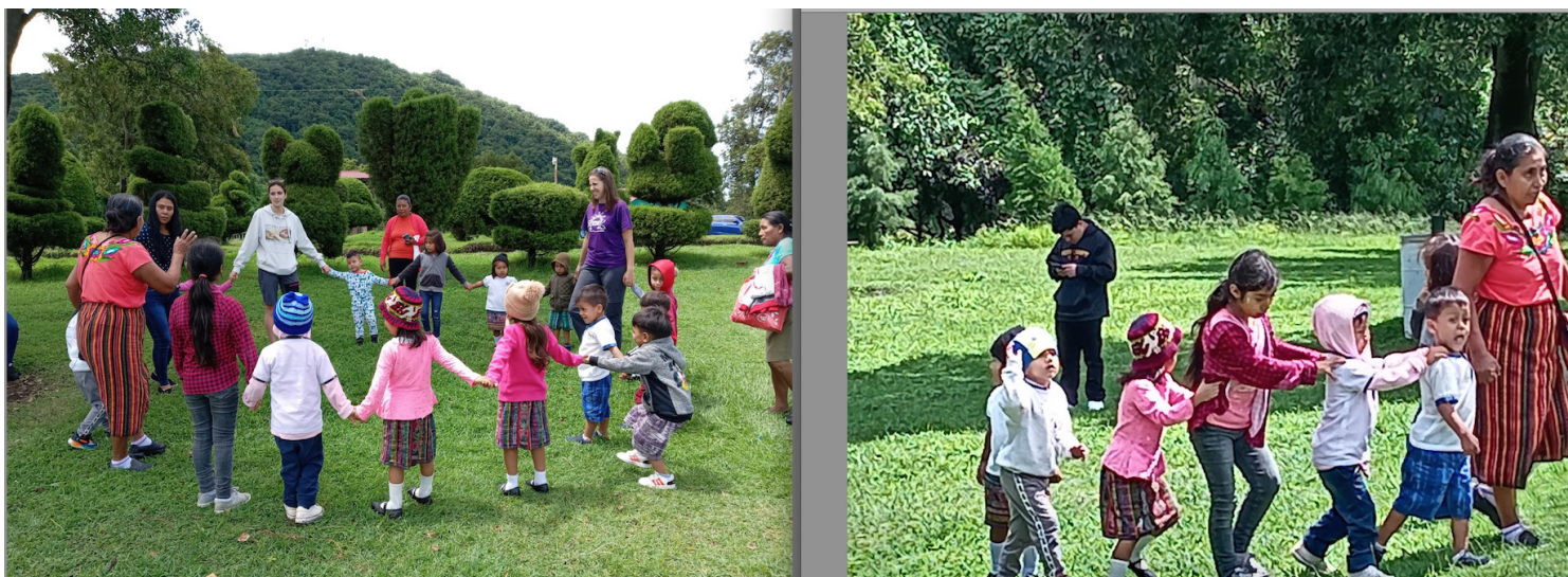
Alumnos de las Cunas Nahuas de Santo Domingo de Guzmán, Santa Catarina Masahuat y Nahuizalco, disfrutaron de una clase interactiva del idioma nahuat, en el cerro Verde, junto a sus maestras o natzin.