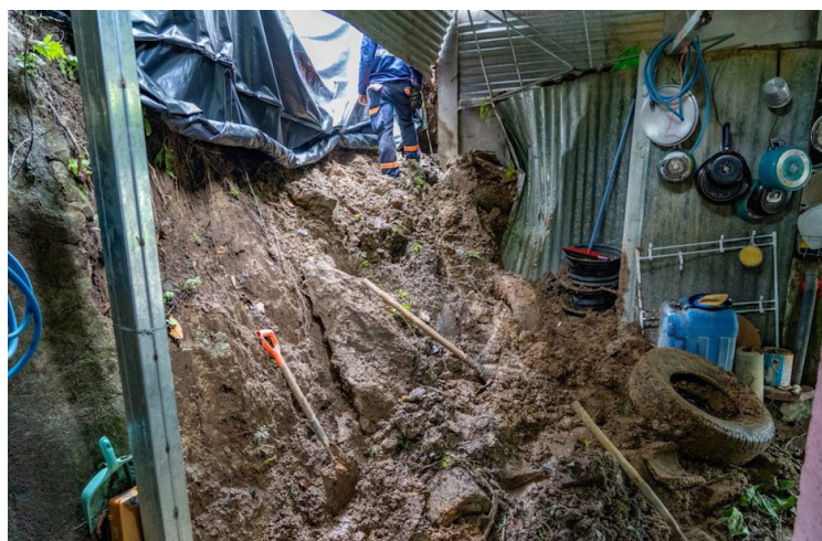
En el pasaje 8 de la comunidad Vista Bella 3, San Salvador ocurrió un deslizamiento de tierra en una vivienda.

El Ministerio de Medio Ambiente y Recursos Naturales (MARN) indicó que la tormen-