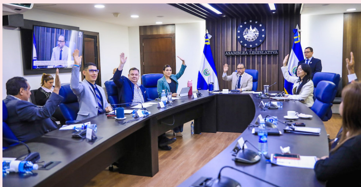
La Comisión Política de la Asamblea Legislativa emite dictamen para que el pleno elija al titular del Tribunal del Servicio Civil, el cual se prevé que se realice esta semana.

las personas que están acá, cuáles son los perfiles y las visiones que tienen con las diferentes instituciones”, expresó Castro.