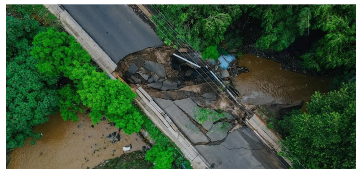
El puente en la entrada de Villa Lourdes, Colón, La Libertad, colapsó debido a las fuertes lluvias por la tormenta tropical Erick.

Protección Civil pidió a la población evitar cruzar ríos, quebradas o cualquier corriente de agua que se genere durante las lluvias o tormentas y posterior a ellas, debido a la probabilidad de arrastre.