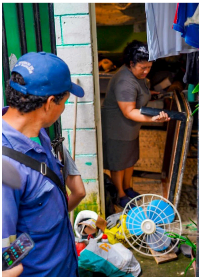
Las lluvias provocaron el colapso parcial de varias viviendas en la comunidad Nueva Israel, San Salvador.