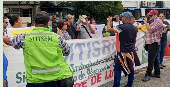
El Sindicato de Trabajadores del Instituto Salvadoreño de Bienes Magisterial (SITISBM) denuncia la difusión de mentiras para crear su debilitamiento, y que los empleados no reclamen sus derechos.

la entrega de las credenciales, con el cual ha tratado de frenar el trabajo no solo del SITISBM, sino de muchos sindicatos a escala nacional.