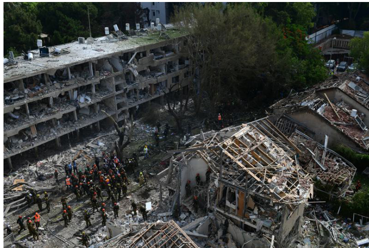
Fuerzas de seguridad y rescate israelíes trabajan en el sitio de un ataque con misiles iraníes, en Tel Aviv, en el centro de Israel, el 22 de junio de 2025. Misiles balísticos lanzados desde Irán hacia el centro y norte de Israel en la mañana del domingo dejaron 26 personas heridas, informó el servicio nacional de emergencia israelí Magen David Adóm.

La cancillería declaró que la decisión irresponsable de llevar a cabo ataques con misiles y bombas contra territorio de un Estado soberano, sin importar cuáles sean los argumentos invocados, viola gravemente el derecho internacional, la Carta de las Naciones Unidas y las