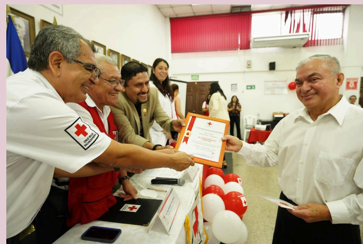
Cruz Roja reconoce a quienes, de forma altruista y frecuente, ayudan a mantener activas las reservas de sangre.

Dijo que en El Salvador y el mundo entero la necesidad de sangre es constante, no hay un