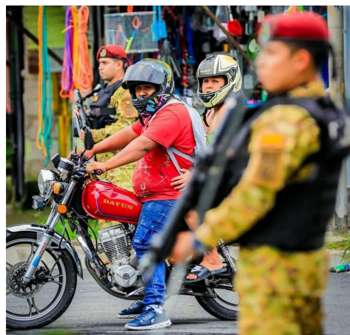
Cerca de 1,500 elementos de la Fuerza Armada y 500 de la PNC instalaron un cerco de seguridad en San Bartolo, Ilopango, para ubicar a remanentes de pandillas.

Durante la última semana en redes sociales habitantes de la zona denunciaron que jóvenes, supuestamente hijos de pandille-