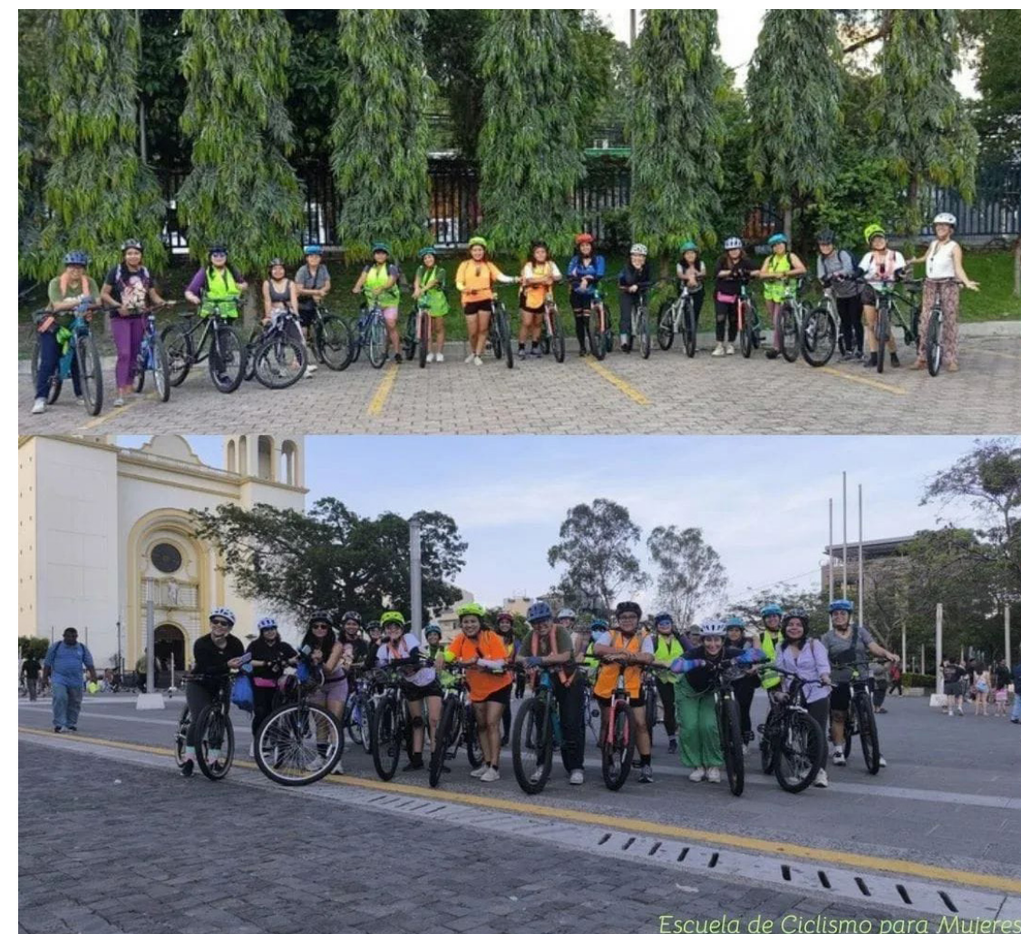
Escuela de Ciclismo para Mujeres

El 15 de marzo de 2022, la Asamblea de Naciones Unidas (ONU), adoptó la resolución sobre el “Uso Generalizado de la Bicicleta”, destacando el papel fundamental como herramienta para el desarrollo sostenible y el transporte público.