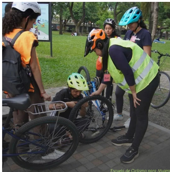
Escuela de Ciclismo para Mujeres

“Entonces, nos enfrentamos a ciudades que no son seguras para nadie y otro de los principales riesgos, también es la idea que muchos tienen sobre el uso de bicicleta, que lo ven como un hobby, y esto deriva a que muchas perso-