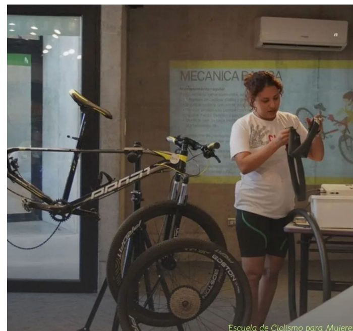
Escuela de Ciclismo para Mujeres

El uso de la bicicleta además de ser un transporte limpio y accesible, como la baja emisiones de Gases Efecto Invernadero, contribuye a la salud de la sociedad en general.