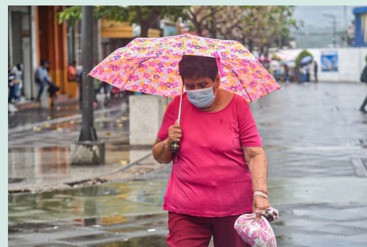
El MARN prevé para la noche de este martes, algunas lluvias y tormentas frente a las costas.

timas horas, los habitantes del cantón Joya Grande, manifestaron que el desbordamiento del río Chagüite pone en peligro tanto a los residentes como a los automovilistas, ya que el paso entre Ilopango y Santiago Texacuango queda completamente inundado.