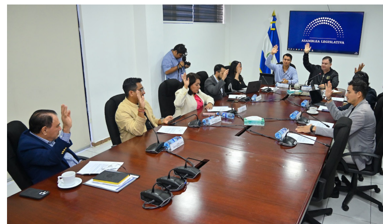
La Comisión de Hacienda emite dictamen para asignar $2.1 millones al INCAF, a fin de capacitar a personas y adquirir recursos tecnológicos.