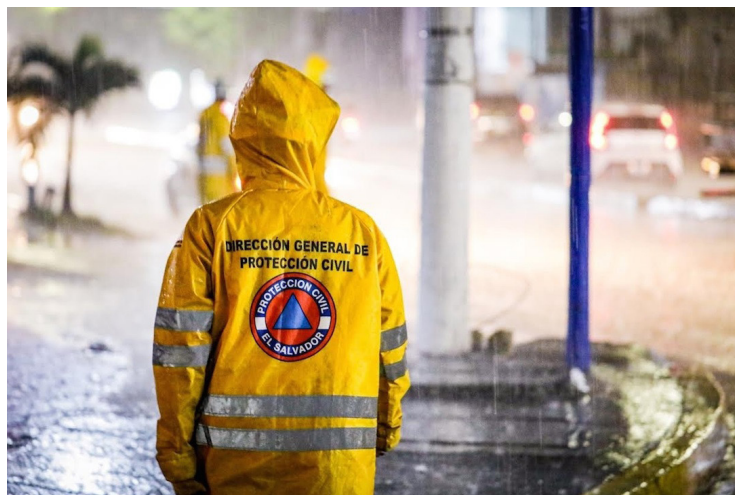
Las lluvias y tormentas previstas para este miércoles son favorecidas por la influencia de una onda tropical, el aporte de humedad desde el Caribe y vaguadas en la región.

El director general de Protección Civil, Luis Amaya, dijo que en los próximos días se prevé el inicio de la canícula, un período donde las lluvias tienden a disminuir significativamente. Está previsto que durará cerca de dos semanas.