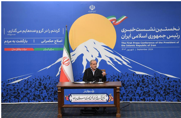
El presidente de Irán Masoud Pezeshkian.

Pezeshkian indicó que Irán espera que EAU transmita a Estados Unidos que Irán sólo busca sus derechos legítimos y de ninguna manera pretende desarrollar armas nucleares.