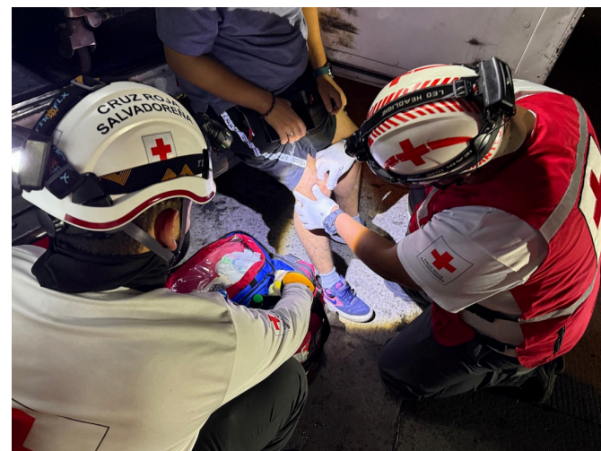
Cada día, socorristas voluntarios dedican su tiempo libre para ayudar a víctimas de accidentes, emergencias médicas y desastres naturales.

El suizo Henry Dunant, testigo del desastre, organizó a los