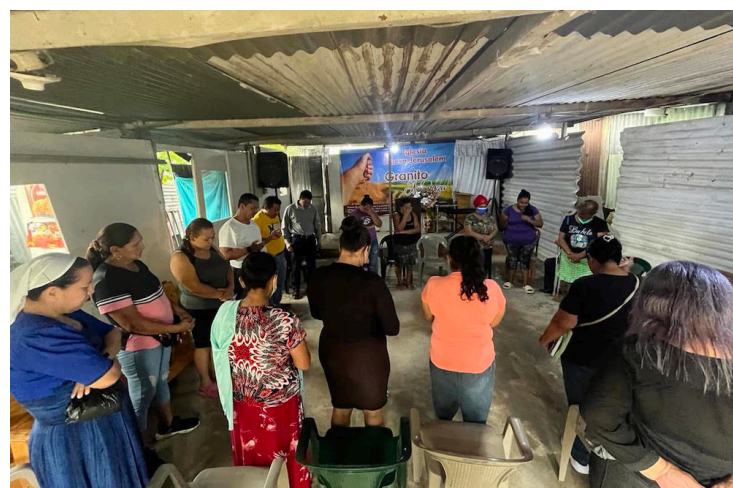
La comunidad realiza una oración previo a desarrollar una jornada de socialización de la problemática para Diario Co Latino a fin de que las autoridades puedan conocer su situación.

Miguel recuerda que, cuando llegaron al lugar, era "un ba-