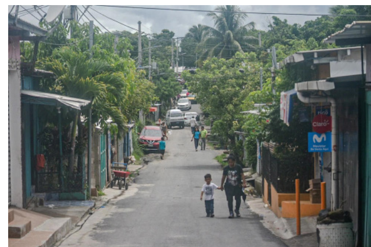
Los habitantes del lugar en su mayoría no pueden acceder a créditos. Lamentan que las cuotas sean “demasiadas altas”.