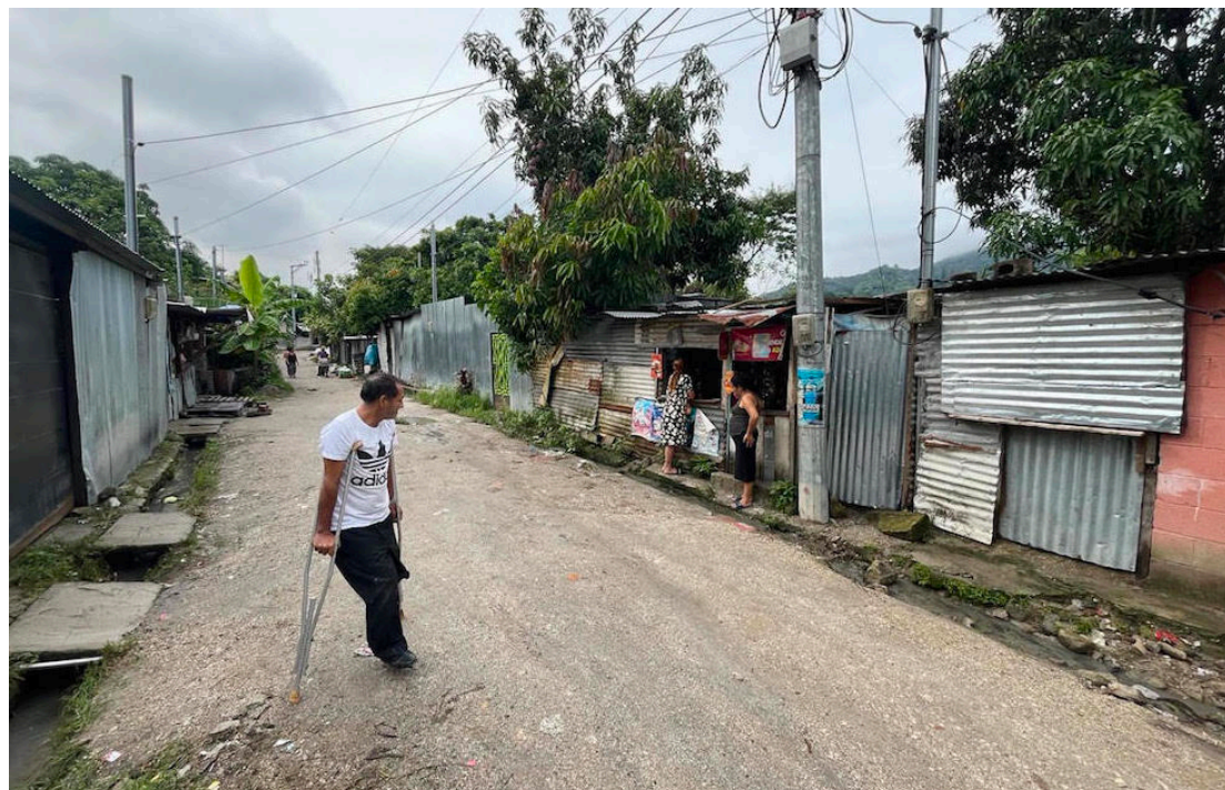
Son más de 1,500 champas y más de 5 mil habitantes los que serán afectados por la empresa dueña de los terrenos ya que no pueden cancelar el monto total de los terrenos.

Una de las habitantes a quien se le midió el terreno en el sector de Las Victorias compartió su constancia, emitida por Quebec S.A. de C.V., donde se detalla la información del lote, su precio comercial y un supuesto descuento.