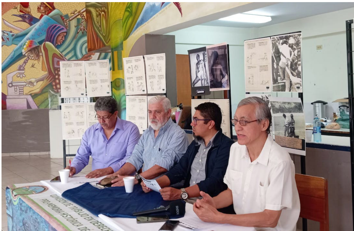
La Comisión de Trabajo en Derechos Humanos Pro-Memoria Histórica de El Salvador, exhorta al gobierno a cumplir con la ratificación del Protocolo Facultativo contra la Tortura, en el Día Internacional en Apoyo de las Víctimas de la Tortura.

También, tiene como intención intimidar o coaccionar a esa persona o a un grupo de personas por cualquier razón a partir de cualquier tipo de discriminación realizada por funcionario público o persona