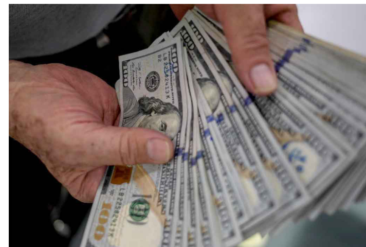
Durante los años 2020 y 2021 ha habido un fuerte incremento en las remesas enviadas primordialmente desde Estados Unidos.