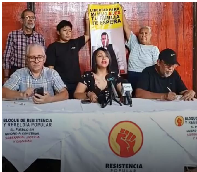
El Bloque de Resistencia y Rebelión Popular (BRP) señala que en su discurso de sexto año de gobierno, Nayib Bukele, no presentó ningún balance concreto sobre su gestión.

Ramírez destacó que, en estos años, el gobierno de Bukele