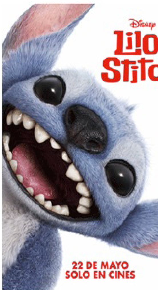
Lilo y Stitch