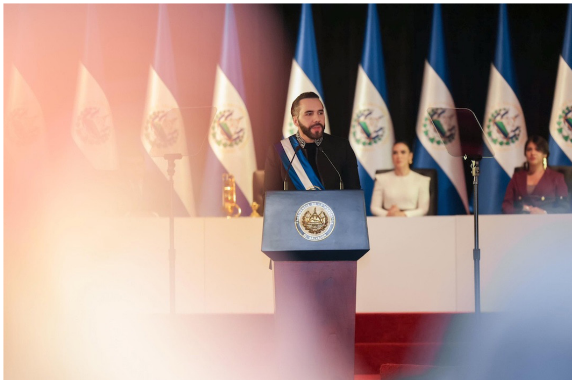
Nayib Bukele brinda su discurso en el Teatro Nacional de San Salvador por los seis años de gestión.