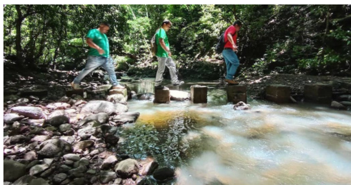
Las caminatas ecológicas con turistas nacionales, extranjeros y para estudiantes de la zona que investigan sobre biodiversidad forman parte de la cotidianidad del Bosque de Cinquera.

turísticas ecológicas, pero también el tema de la Memoria Histórica y cultura que está dentro de esta área natural. Y con el apoyo de El Salvador ELKARTASUNA hemos logrado comprar poco a poco la tierra y ahora tenemos el Parque Ecológico, con un 12% de toda el área del bosque, y esto ha sido muy importante en la preservación del medio ambiente”, manifestó Hernández.