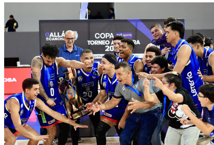
Metapán conquista su cuarto título consecutivo en la Liga Mayor de Baloncesto.

Para el entrenador, la defensa fue una de las claves del triunfo. “Hoy solo permitimos 63 puntos, y eso fue fundamental. Creo que fue el partido en el que San Salvador anotó menos en toda la temporada. En la segunda mitad no hicieron más de 30 pun-