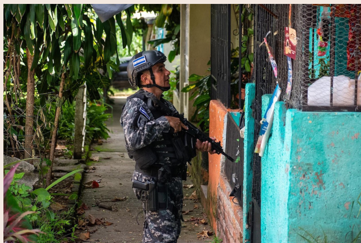
La Asamblea Legislativa aprueba la cuadragésima prórroga al régimen de excepción.