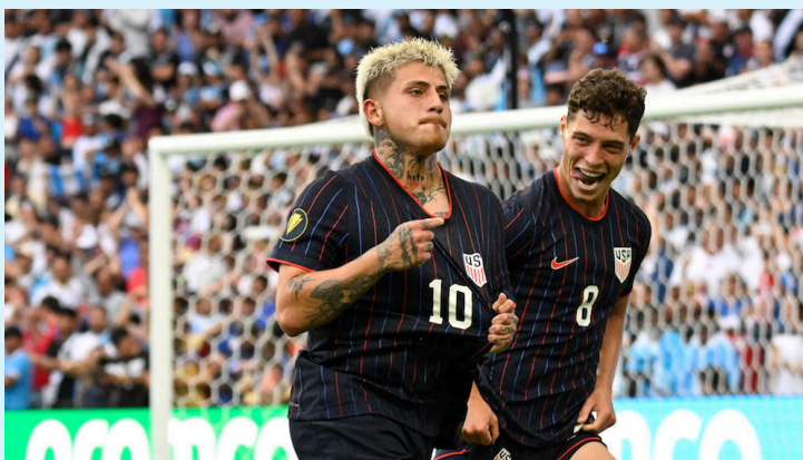
Estados Unidos podría conseguir un nuevo título de la Copa Oro a costa de México este fin de semana.

ganador histórico de la LMB, Santa Tecla. Además, volvió a cerrar la serie como visitante, tal como sucedió en el torneo pasado ante Lobos, y ahora en el Gimnasio Nacional José Adolfo Pineda frente a San Salvador.